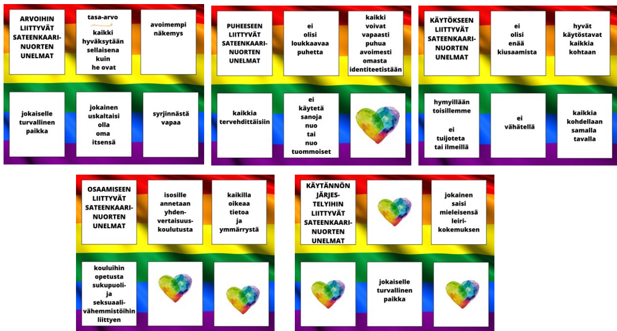
Kuva 16. Unelmien toteutus -harjoituksen korttien taustalle on lisätty Pide-lippu.

Tässä harjoituksessa etsitään ratkaisuja, miten sateenkaarinuorten unelmat tehdään todeksi ja miten osallistujat voivat edesauttaa unelmien toteutumista omalta osaltaan. Tehtävä tehdään ryhmissä ja jokainen ryhmä miettii yhden kortin unelmia. Unelmat on lajiteltu teemoittain alla olevien kuvakorttien mukaisesti. Osallistujien tehtävänä on ryhmissä miettiä konkreettisia tekoja, menetelmiä, toimintatapoja ja käytänteitä, joiden avulla unelmia edesautetaan omassa työssään tai tehtävässään. Kuvakorttien kääntöpuolella on kysymys, miten edesautat unelmien toteutumisen omassa tehtävässäsi seurakunnassa. Edellisen harjoituksen hyvien kohtaamisen tekijöitä voidaan käyttää tämän harjoituksen unelmia toteuttavina tekijöinä.