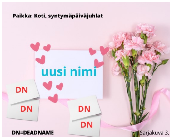
Kuva 3. Sateenkaarinuorta ilahduttaa uuden nimen käyttö, toisin kuin deadnamen käyttö.