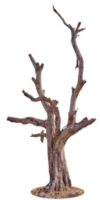
Kuva 11. Tulevaisuustyöskentelyn puu harjoituksen alussa.

Tulevaisuuden puun lehtiin kirjoitetut sanat ovat seuraavat: