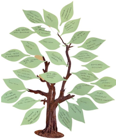
Kuva 12. Sama puu harjoituksen lopussa.

"Kaikki voivat vapaasti puhua avoimesti omastaidentitteestään", "Ei tuijoteta ja ilmeillä", "Tasa-arvo", "Hyvät käytöstavat kaikkia kohtaan", "Jokaiselle turvallinen paikka", "Ihmiset otetaan tosissaan", "Kaikki kohtelisivat muita tasavertaisesti", "Hymyillään toisillemme", "Jokainen uskaltaisi olla oma itsensä", "Tervehditään kaikkia, sanot moi kaikille", "Kaikki hyväksyttäisiin sellaisinaanakin he ovat", "Jokainen saisi mieleisensä leirikokemuksen", "Kaikkia kohdellaan samalla tavalla", "Ei vähättelyä", "Kouluihin opetusta sukupuoli- ja seksuaalivähemmistöihin liittyen", "Koulutetaan isosia yhdenvertaisuudesta ja tasa-arvosta, isosille yhdenvertaisuuteen koulutusta", "Kaikki kohtelisivat toisiaan kunnioittavasti", "Avoimempi näkemys", "Syrjinnästä vapaata", "Kaikilla oikeaa tietoa ja ymmärrystä", "Kaikille tarvittaessa oma rauha", "Ei ole loukkaavaa nimittelyä", "Ei olisi enää kiusaamista", "Ei käytetä sanaa 'tuo' ja 'nuo tuommoiset'"