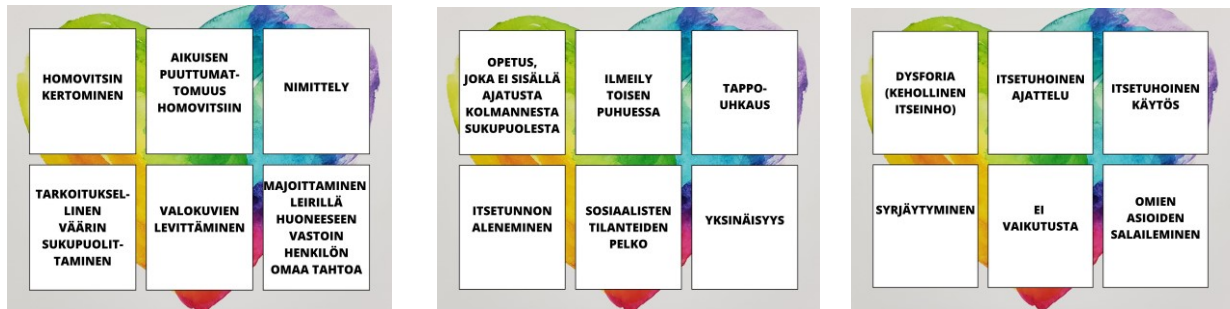
Kuva 15. Harjoituksissa käytettävien korttien visualisointiin voi lisätä sateenkaarisymboleita ja väritystä.

Harjoituksessa tehtävänä on yhdistää syrjivä toiminta ja siitä koitua seuraus. Harjoitus jatkaa edellistä harjoitusta. Harjoituksessa käytetään kortteja, joissa on tutkimuksissa todettuja syrjinnän seurauksia ja sateenkaarinuorten kokemia syrjinnän tapoja. Korteista on tarkoitus leikata tekstilaatikat irti toisistaan, jotta koulutukseen osallistujat voivat siirrellä vierekkäin syrjivät toiminnat niiden seurausten viereen, jotka kokevat olevan seurausta toiminnasta.