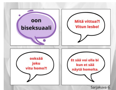
Kuva 6. Tuleeko sateenkaarinuoren näyttää tiettyä, että on uskottava sateenkaarinuori?