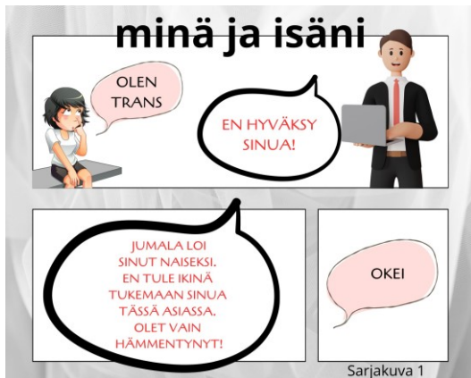
Kuva 1. Sarjakuvassa ilmenee hengellistä syrjintää isän taholta.

kokemukset ovat kirjoitettu punaisella ja positiiviset hyväksyvät kokemukset ovat kirjoitettu sinisellä tekstillä. Saavutettavuuden ja nuorten henkilöllisyyden suojaamisen vuoksi olen tehnyt sarjakuvat Canva-kuvankäsittelyohjelmalla uudelleen mukailleen nuorten tekemiä sarjakuvia. Nuorten kirjoittamat tekstit ovat pysyneet täysin samoina. Kuvia olen selkeyttänyt, muuttanut värimaailman ja käsin kirjoitetut tekstit saavutettavammiksi. Sarjakuvat ovat alla.