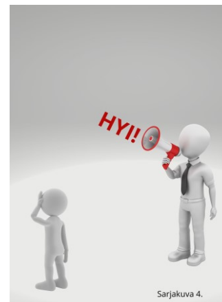
Kuva 4. Yksikin sana voi syrjiä.