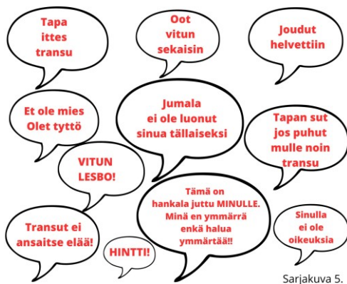
Kuva 5. Syrjivän kielen kirjoja.