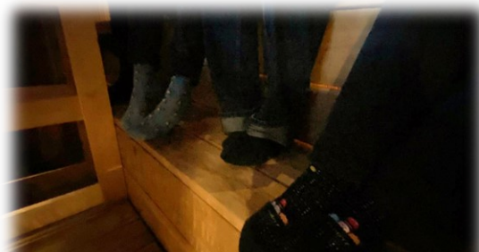
Kuva 10. Voiko sateenkaarinuori saunoa yhdessä muiden kanssa leireillä tai julkisissa tiloissa?

Kehittämispäivän keskusteluissa nuoret kertoivat kokevansa, että leireillä enimmäkseen myös sateenkaarinuoret voivat saunoa. Nuoret pitivät hyvinä ratkaisuna kolmen saunavuoron systeemiä (tytöt, pojat ja muut), uikkaria-saunoja, sekasaunoja tai mahdollisuutta varata saunavuoroja pienemmissä porukoissa. Ehdotettiin myös, että leirikirjeessä voisi kysyä haluaako nuori mil-laisen saunavuoron ja että annetaan leiriläisille tietoa, miten saunavuorot on jaettu.