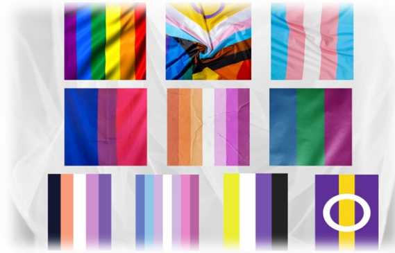
Kuva 13. Kuvassa erilaisia sukupuolta ja seksuaalisuutta ilmaisevia lippuja ja väriyhdistelmiä. Lueteltuna vasemmalta oikealle ja ylhäältä alas.

Ylärivi: sateenkaarilippu eli seksuaali- ja sukupuolivähemmistöjen lippu, sateenkaarilippu, johon lisätty intersukupuoliset, transihmiset, rodullistetut sateenkaari-ihmiset ja kolmantena transihmisten lippu.