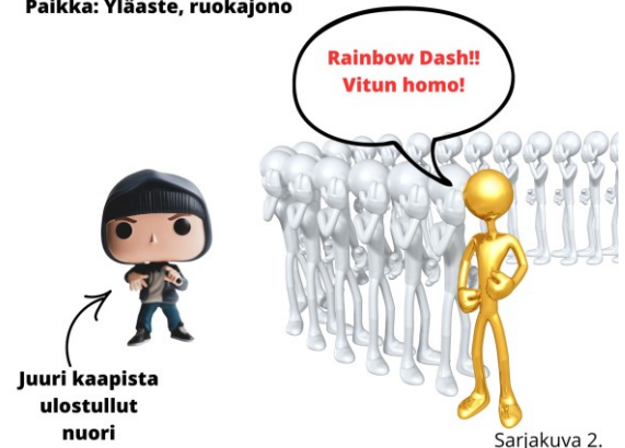
Kuva 2. Aikuisten on välillä vaikeaa tunnistaa nuorten käyttämää syrjivää kieltä.