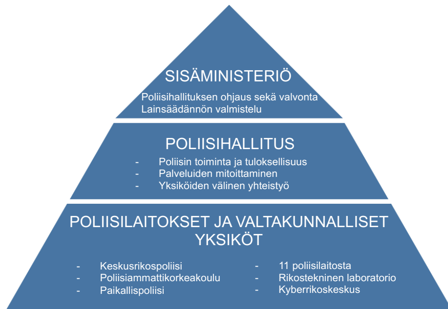
Kuvio 1. Suomen poliisiorganisaation rakenne (Sisäministeriö 2023)

poliisiammattikorkeakoulun ja keskusrikospoliisin toimintaa. (Sisäministeriö 2023).