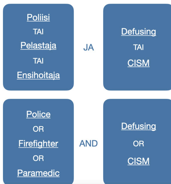
Kuvio 3. Hakulausekkeet

Tiedonhaku aloitettiin selvittämällä keskeisten käsitteiden englanninkieliset vastineet. Keskeiset käsitteet nostettiin tutkimuskysymyksistä, joita olivat ensihoitaja, pelastaja, palomies, poliisi, defusing ja CISM. Pelastaja- termi on verrattain uusi virkanimike viitaten pelastusalan entiseen palomies-nimikkeeseen, joten molempien termien hakusanoina käyttö mahdollisti eri ikäisten artikkeleiden saatavuuden. Hakulauseke muodostui sanoista ”poliisi” TAI ”pelastaja” TAI ”ensihoitaja” JA ”defusing” TAI ”CISM”. Tiedonhaussa käytettiin tietokantakohtaisia hakutermejä ja asiasanoja soveltuvin osin. Käytetyt hakulausekkeet on kuvattu kuviossa 3.