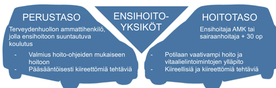
Kuvio 2. Ensihoitoyksiköt

Ensihoitaja työskentelee ambulanssissa, jotka jaetaan kahteen osaamistasoltaan ja vaativuudeltaan eriävään yksikköön. Perustason yksiköissä voivat toimia ensihoitoon suuntautuneet muut terveydenhuollon ammattihenkilöt, kuten lähihoitajat tai pelastajat. (Terveydenhuoltolaki 340/2011.) Hoitotason ambulanssissa on valmius potilaan laajempaan lääkehoitoon sekä vaativimpien hoitotoimenpiteiden toteuttamiseen. Hoitotasolla työskentelevä ensihoitaja on lisäkoulutuksen käynyt sairaanhoitaja tai ammattikorkeakoulun käynyt ensihoitaja. (Terveydenhuoltolaki 340/2011.)