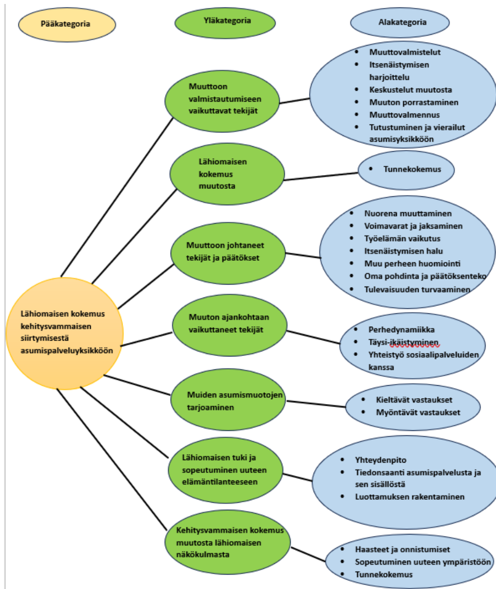
Kuva 2. Opinnäytetyötutkimuksen sisällönanalyysi