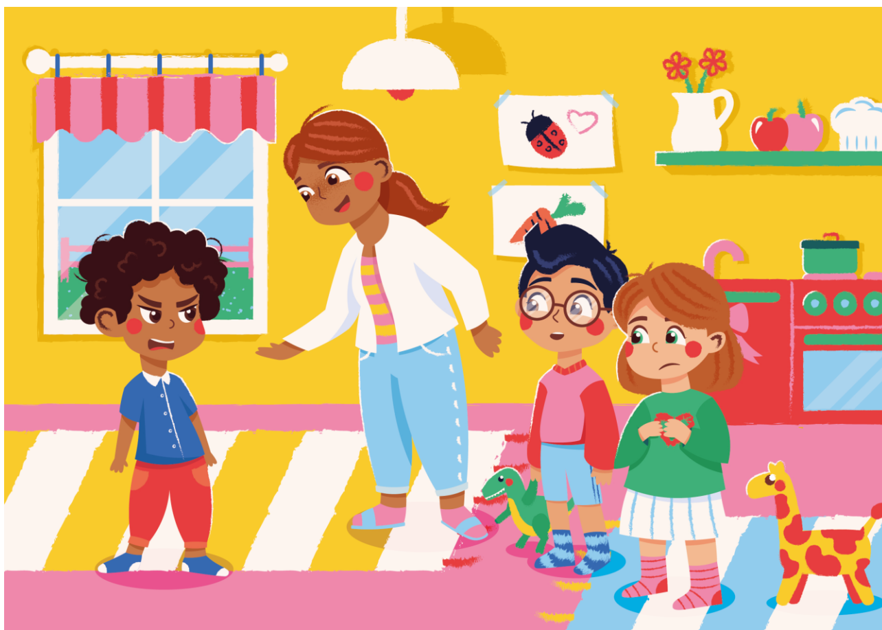
Henna Leinonen, CC BY-NC