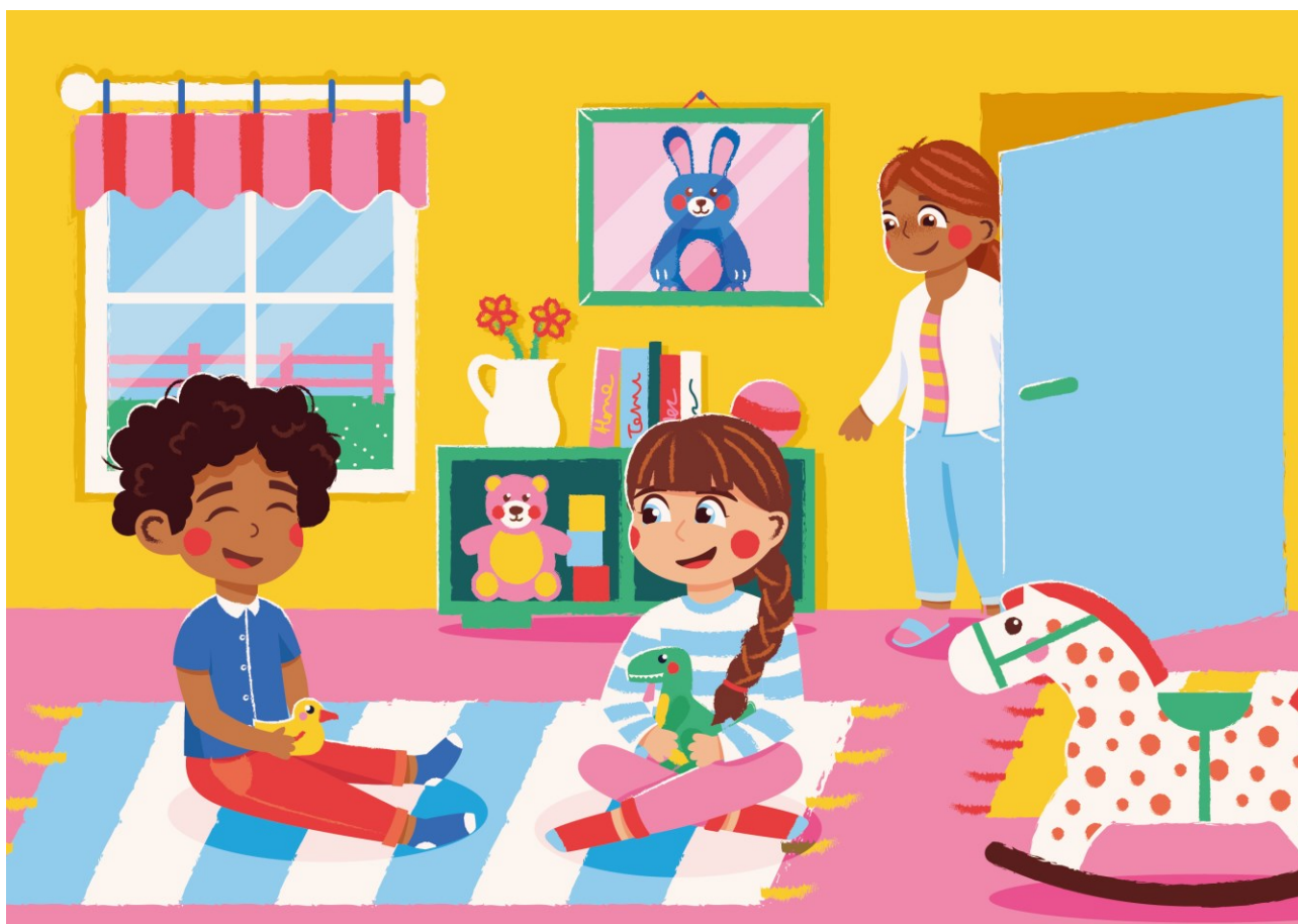
Henna Leinonen, CC BY-NC