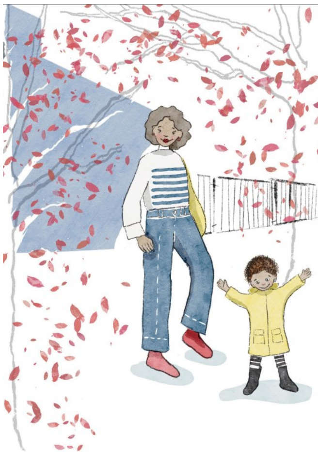
Hanna Kulmala, CC BY-NC