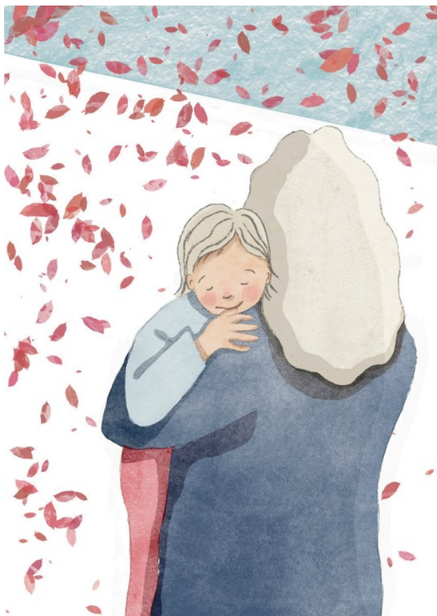
Hanna Kulmala, CC BY-NC