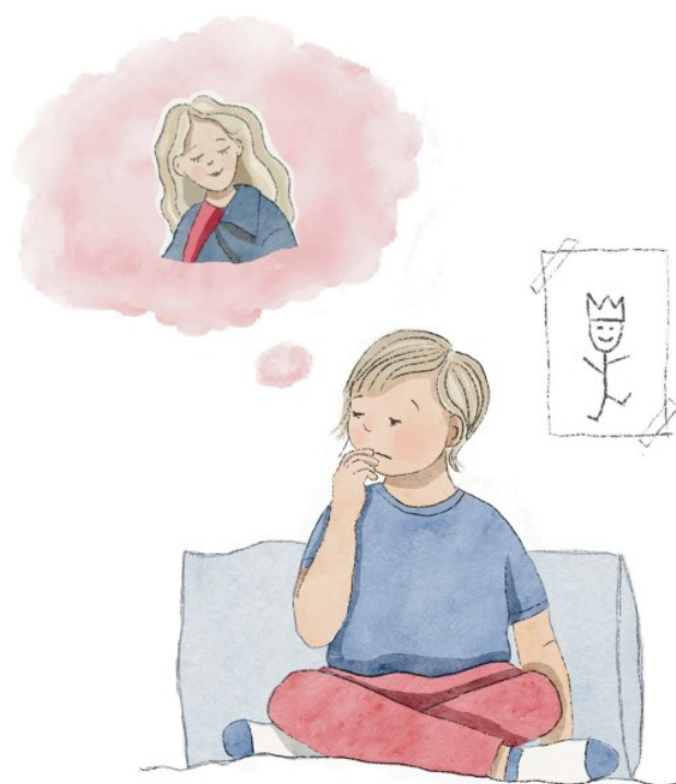
Hanna Kulmala, CC BY-NC

Liikuntaosuus: Halaa itseäsi niin, että kurottelet sormillasi vastakkaista olkapäätä.