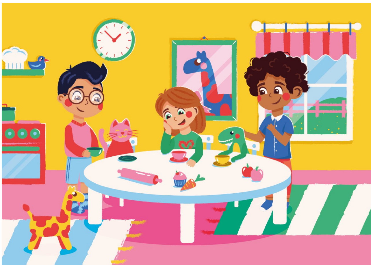
Henna Leinonen, CC BY-NC