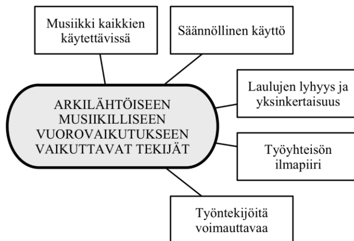
Kuvio 2. Arkilähtöiseen musiikilliseen vuorovaikutukseen vaikuttavat tekijät ensikodin työntekijöiden mukaan

Tutkimuksen tavoitteena oli saada musiikki osaksi ensikodin vauvatyöskentelyn arkea. Tarkemmin sanoen osaksi kaikkia niitä hetkiä, joita vauvojen kanssa ensikodissa eletään. Tutkimuksen tulokset olivat hyvin positiiviset. Musiikki oli tullut kahden vuoden tutkimusjakson aikana eläväksi osaksi ensikodin arkea. Seuraavassa kuviossa (Kuvio 2) on näkyvillä asiaan vaikuttaneet tekijät ensikodin työntekijöiden kuvaamina.