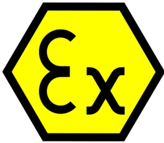
Kuva 4. Ex-laitteen merkintä (ATEX 2012.)