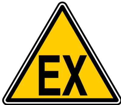
Kuva 3. Räjähdyksvaarallisen tilan varoitusmerkki. (ATEX 2012.)