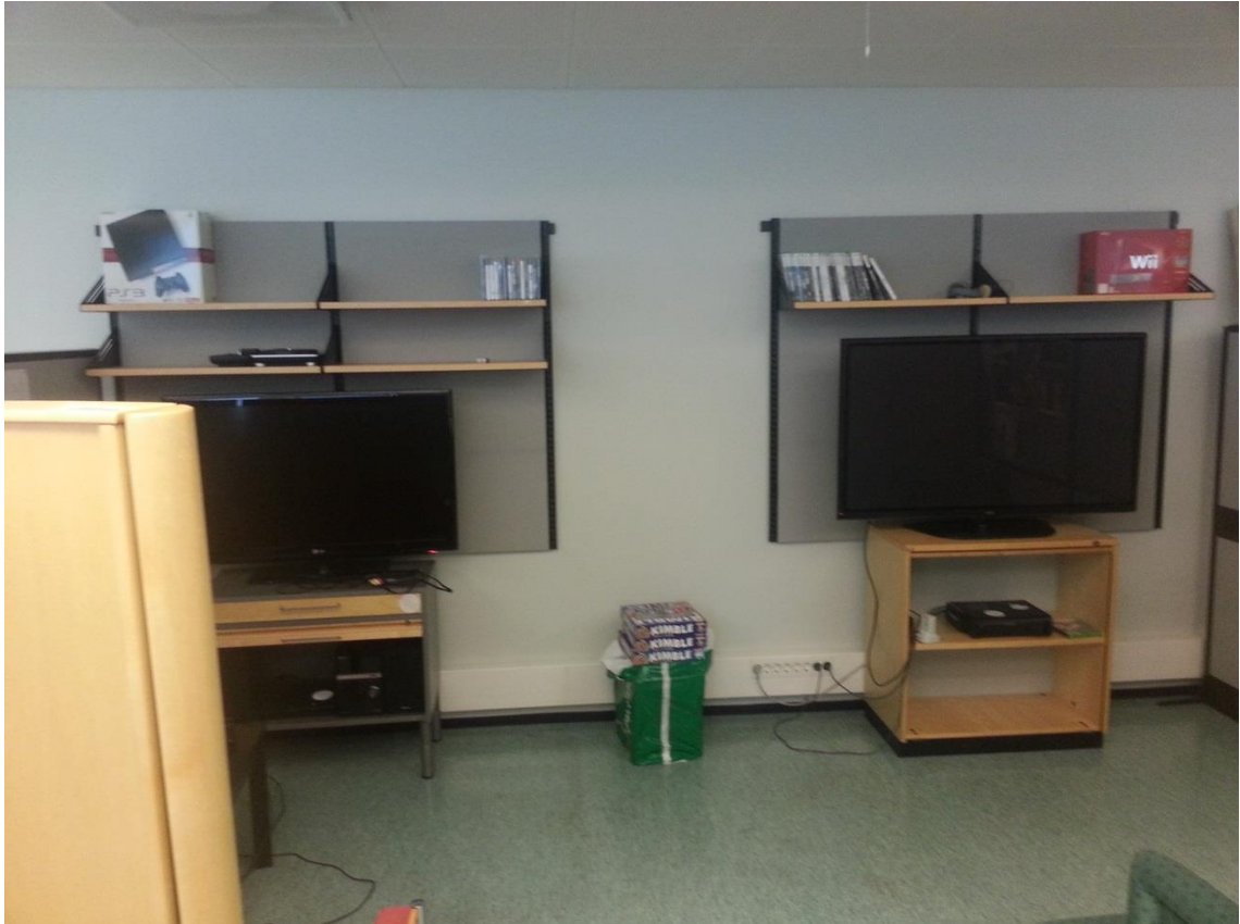
KUVA 2. Pelikonetilat

Pelikoneita on Pelistudiossa tällä hetkellä neljää mallia: PS3, Xbox360, Wii ja Wii U. Wii U:ta lukuun ottamatta kaikki pelikoneet ovat niin sanottuja seitsemännän sukupolven pelikoneita. Koska kahdeksannen sukupolven pelikoneet Wii U:ta lukuun ottamatta tulivat yleiseen käyttöön vuoden 2013 lokakuussa, eivät pelikoneet ole vielä vanhentuneita. Wii U on sijoitettu esittelytiloihin ja loput pelikonetiloihin..