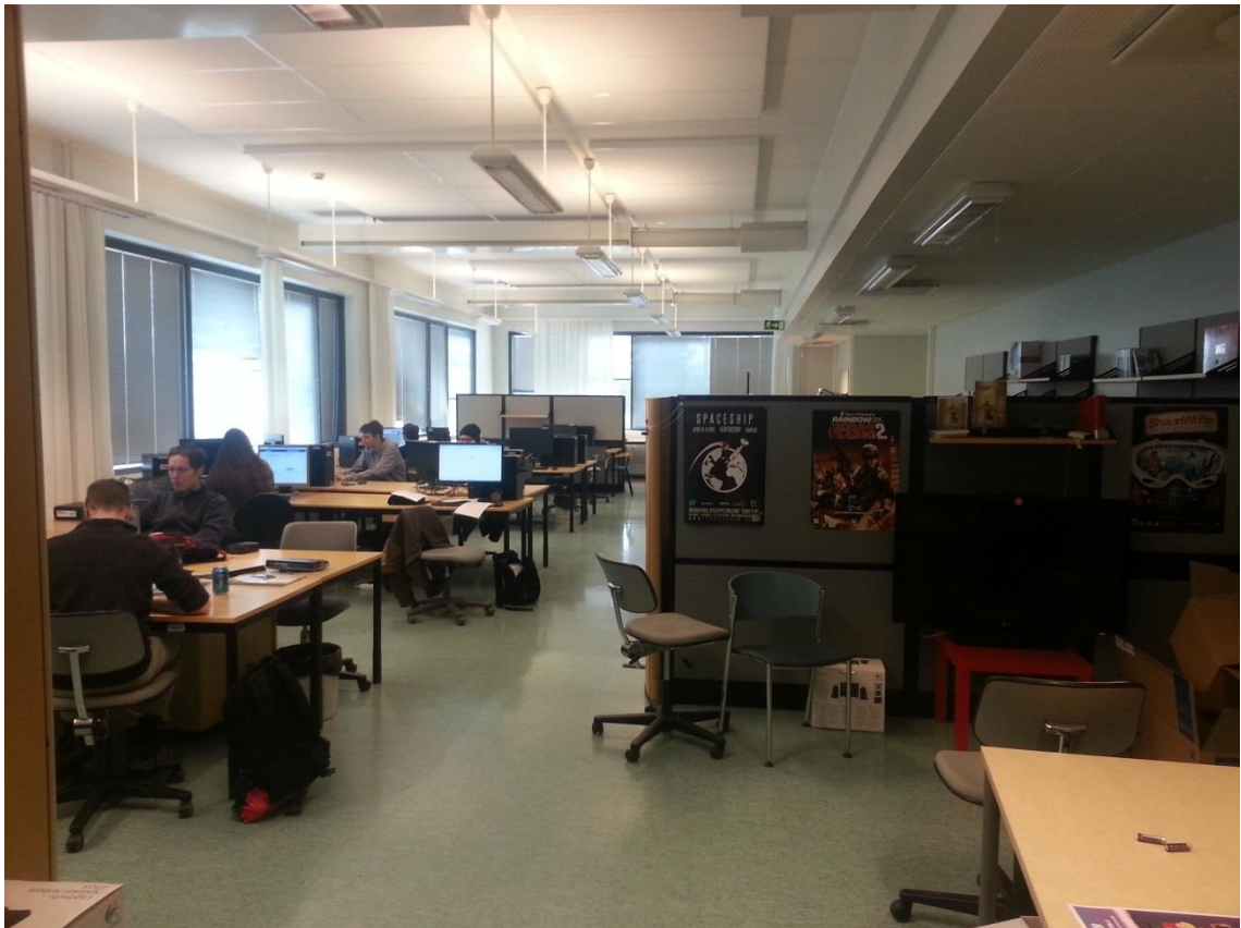
KUVA 1. Pelistudion PC-tila.