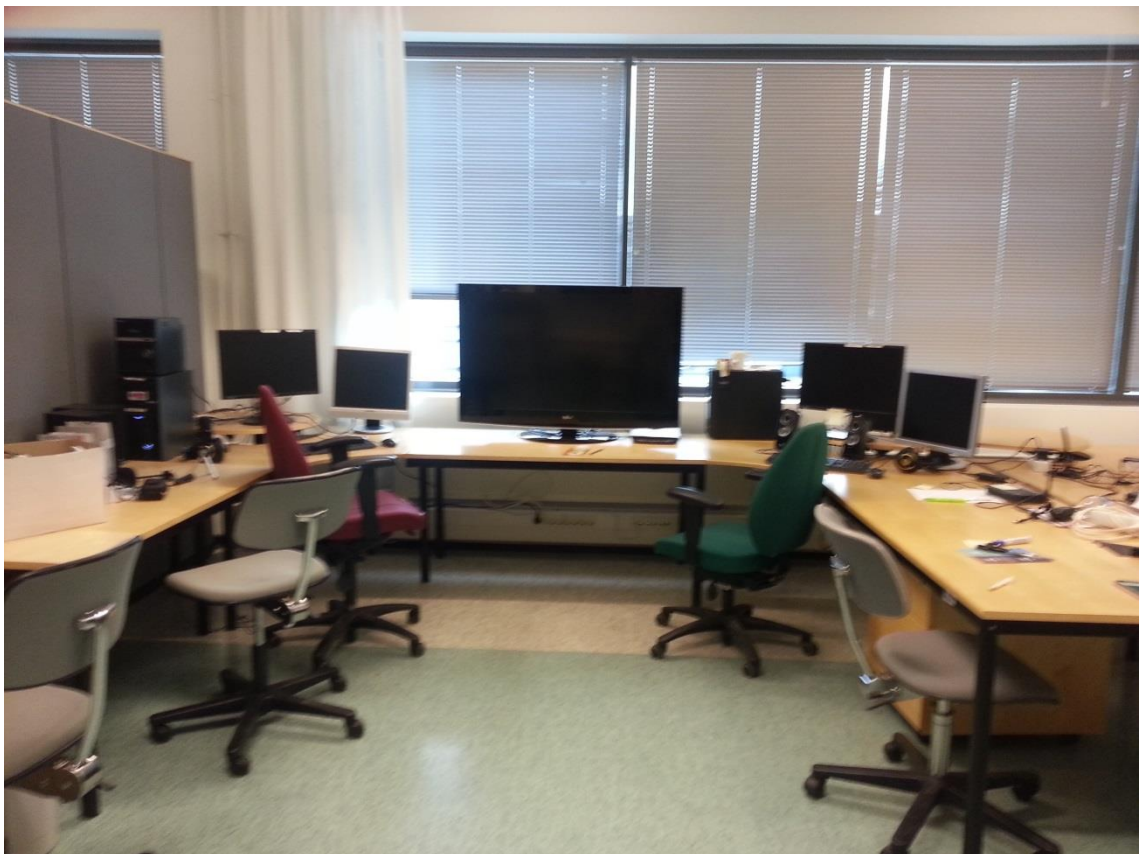
KUVA 3. U-kirjaimen muotoinen pöytäasettelu.

Poikkeuksellisenä mainittavana ovat kodinkoneet. Pelistudiossa on nimittäin kahvinkeitin, teekeitin (kumpiakin kaksi kappaletta), jääkaappi ja pakastin sekä mikroaaltouuni. Elintarvikkeita löytyy myös, lähinnä kahvia ja sen lisukkeita. Kaikki tämä sijaitsee esittelytiloissa.