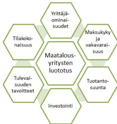
Kuvio 3. Työkalu maatalousyritysten luotonmyöntöön (Lehto 2013, 88).

työkalun maatalousyritysten luotonmyöntöön, mikä on nähtävillä kuviossa kolme. Työkalu on muistiväline, jonka avulla kaikki tärkeimmät maatalousyritysten luototukseen liittyvät asiat tulevat läpikäydyiksi. Lehdon työkalussa lähdetään liikkeelle yrittäjä ominaisuuksista, joiden arvioinnin kehittäminen tuli esille myös tässä työssä. Kaikki Lehdon työkalun pääkohdat tulivat esille myös tämän opinnäytetyön haastatteluissa.