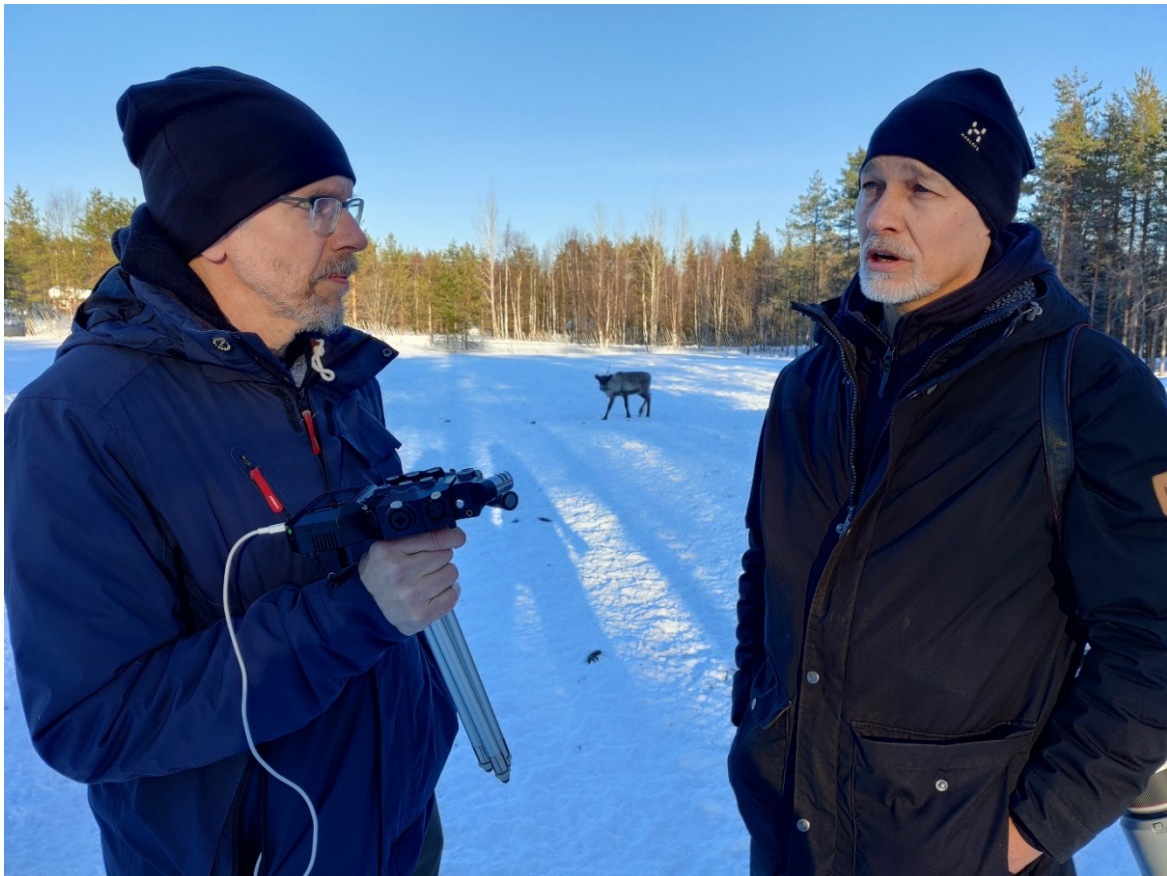
Kuva 1. Podcastin äänitystä poroitauksessa

Mitä opimme? Aina ei tarvitse hankkia kallista asiantuntijaa puhujatoimistoista. Me lehtorit ja asiantuntijat olemme puhetyöläisiä, tottuneet tutkimaan ja ottamaan haltuun uusia sisältöjä ja olimme todellakin hankkeen aiheiden asiantuntijoita. Uuden oppiminen ja podcastin teko oli sitä paitsi hauskaa! Äänityksiä tehtiin niin Teams-kokouksissa, poroitauksessa kuin hotellihuoneessa eli erityistä äänitysstudiota ei välttämättä tarvitse. Sisältö ja editointitaidot ratkaisevat.