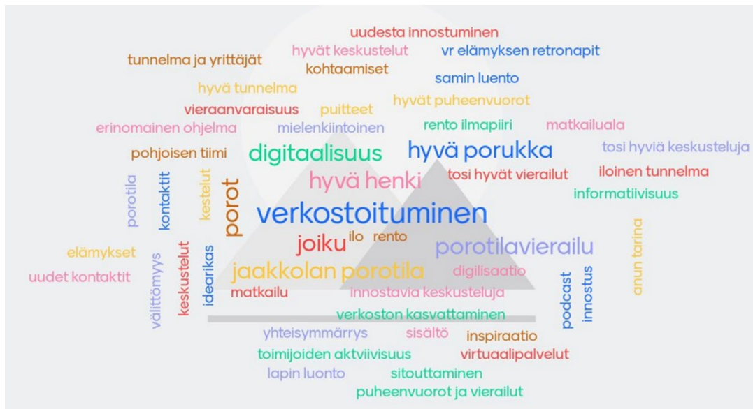
Kuva 6. Palaute hankkeen benchmarking-matkasta

Yhteistyö Lapin ammattikorkeakoulun eHospitality projektin kanssa on ollut hedelmällistä. Ilman mobile eye tracking -testiä ja tulosten perusteellista löytämistä palvelumme ei olisi kehittynyt nykyiseen muotoonsa. Arviointitulokset auttoivat näkemään todelliset kehittämiskohteet ja saivat innostumaan muokkaamisesta. Yhteistyö Lapin ammattikorkeakoulun eHospitality projektin kanssa on ollut hedelmällistä. (K3)