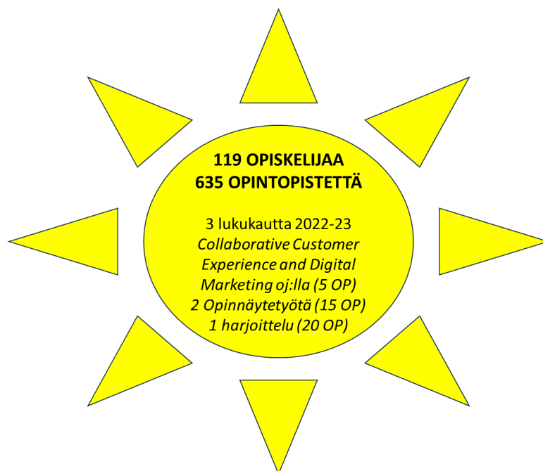
Kuva 5 . Hankeintegraation kautta saavutetut opintopisteet

eHospitality-hanke toimi loistavana kokeilujen ja kokeilukulttuurin alustana. Hanke oli monilla mittareilla vaikuttava ja sai positiivista palautetta osallistujilta ja sidosryhmiltä. Hankeblogin 47 artikkelia saavat jatkuvasti uusia lukijoita. Hankeintegraation myötä hankkeeseen osallistui yhteensä 119 opiskelijaa ja opintopisteitä kertyi huimat 635 pistettä.