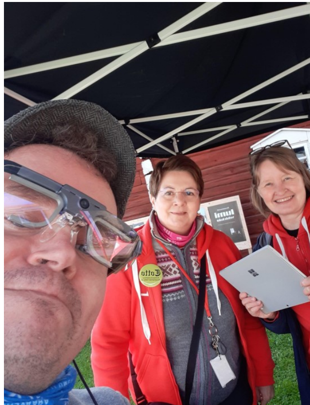
Kuvat 3 ja 4. Eye tracking –testaaja Rovaniemen kotiseutumuseolla. ja Eye tracking –nauhoite näyttää testaajan silmänliikkeitä luontopolulla (Kuvaruutukaappaus)