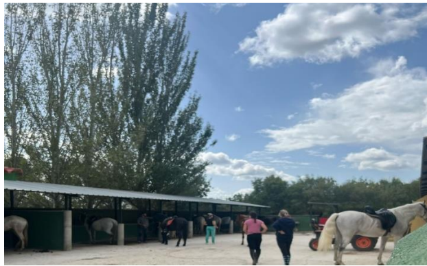
Kuva 1. Vaellustalli Espanjassa

Matkailupalveluiden kehittämisessä turvallisuus on tärkeä näkökulma. Turvallisuus hevosmatkailupalveluissa riippuu usein siitä, miten hyvin asiakas ja hevonen sopivat yhteen. Jos kyseessä on reikajelu tai hevosshow, asiakkailla ei ole juuri vaikutusta turvallisuuteen, vaan silloin turvallisuus on lähinnä palvelun tuottajan käsissä. Mutta kun kyse on ratsastamisesta, on tärkeää, että hevoset soveltuvat asiakkaiden ratsuiksi, ja että ratsastaja käsittelee hevosta asianmukaisesti. Reaktiivista hevosta ei kannata käyttää asiakkaiden kanssa, mutta laiskastakin hevosesta voi tulla vaarallinen, jos asiakas ei osaa käsitellä sitä oikeudenmukaisesti. Hevosmaailmassa on tällä hetkellä jatkuvasti kohuja siitä, että hevosia käsitellään väkivaltaisesti. Väkivaltaisuus ja turvallinen päättäväinen käsittely ovat kuitenkin kaksi eri asiaa ja ne usein monella sekoittuvat. Väkivaltainen käsittely aiheuttaa hevoselle kipua ja traumoja, kun taas päättäväinen käsittely etenkin nuorten hevosten kanssa antaa hevoselle rajat, miten toimitaan, ja näin ehkäistään sitä, että hevosesta ei tule myöhemässä vaiheessa vaarallista.