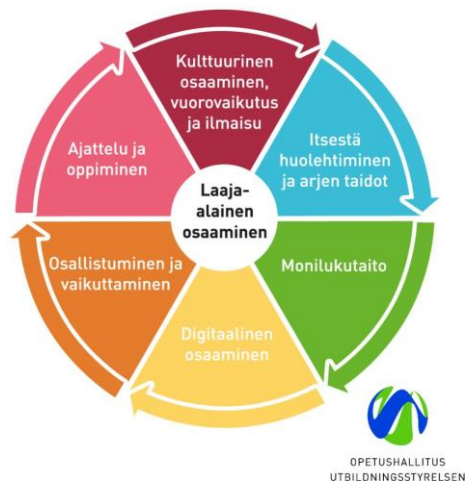
Kuva 2. Laaja-alainen osaaminen varhaiskasvatuksessa. (Opetushallitus, n.d.)

Hyvä ja laadukas varhaiskasvatus antaa pohjan lapsen laaja-alaiselle osaamiselle. Laaja-alaiseen osaamiseen kuuluu monilukutaito, digitaalinen osaaminen, osallistuminen ja vaikuttaminen, ajattelu ja oppiminen, itsestään huolehtiminen ja arjen taidot sekä kulttuurinen osaaminen, vuorovaikutus ja ilmaisu.