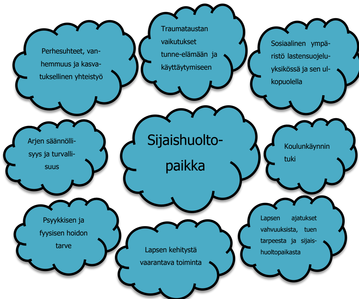
Kuvio 3. Teemoja sijaishuoltopaikan sopivuuden pohtimiseen