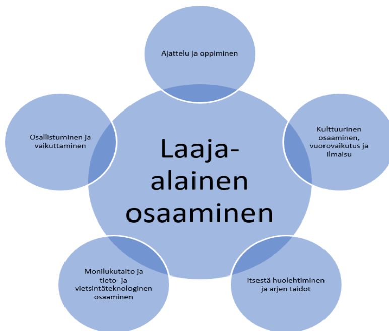
Kuvio 1. Laaja-alaisen oppimisen osa-alueet (Otavan oppimisen palvelut, 2021).

Varhaiskasvatussuunnitelmaan kirjatut tavoitteet ja sisällöt muodostavat laaja-alaisen osaamisen kokonaisuuden (Salminen & Poikonen, 2017, s. 65). Näitä on tarkoituksenmukaista toteuttaa arjessa soveltaen niitä lasten mielenkiinnon ja osaamisen mukaisesti. Osa-alueet muodostuvat seuraavista teemoista: