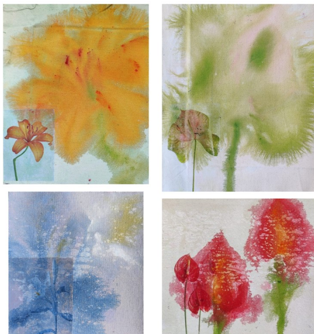
Kuva 7. Trooppiset kukat 2023, 2023. Akryyli ja pigmentinsiirto kankaalle, teosten yksittäinen koko 35 x 45 cm. Kuva: Julia Avén.

Teoksissa kukka-aihe on selkeästi esillä ja olen halunnut leikitellä esittävyden ja abstraktion kanssa. Tämä teos sai minut kiinnostumaan maalin leviämisestä ja hallitusta hallitsemattomuudesta. Pystyin asettamaan maalin toivomaani muotoon, mutta en pystynyt vaikuttamaan kuinka se lopulta käyttäytyi kankaalla. Nautin teosten työstämisestä, mutta niiden prosessi muistutti minulle ennemminkin kankaan värjäämistä kuin maalaamista. Tein huomion, että tarvitsen prosessiini enemmän kehollisuutta ja paksumpaa maalimassaa. Näissä teoksissa maali imeytyi pohjustamattomaan maalauskaaseen. Lopputulos näyttää kauniilta, mutta tulin siihen lopputulokseen, että minua kiinnostaa enemmän kerrostaa paksua maalia maalaus pohjalle, kuin luoda ohuita pohjaan imeytyviä kerroksia.