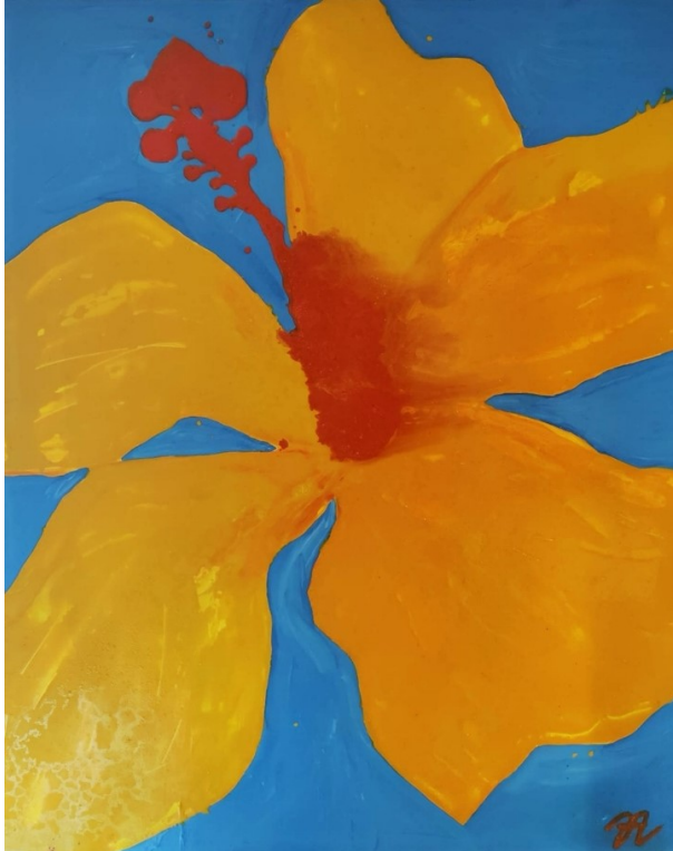
Kuva 8. La flor, trooppinen kukka 2. 2023. Enkaustiikka puulle 100 x 81 cm.

Teosta tehdessäni huomasin ensimmäistä kertaa sen, kuinka luontevaa minulle oli työstää maalia kaatamalla. Maalin kaataminen tuo teokseen mukaan kehollisuuden, joka samalla tuo työstämiseen mukaan hetkellisyyden. Lopputulos tuntui sattumalta, johon pystyin itse hieman vaikuttamaan. Pystyin itse olemaan päätävässä siitä, minne asetan ja kaadan maalia, mutta en voinut vaikuttaa sen liikkumiseen maalaus pohjalla sen kuivumisen aikana. Vahasta tehtyä maalia pystyy sen kuivuttua sulattamaan uudelleen ja manipuloimaan lämmöllä. Vahaa pystyy muokkaamaan erilaisilla raaputtimilla, joilla siihen saa tehtyä erilaisia mielenkiintoisia jälkiä ja efektejä. Tämän teoksen kautta minulle syntyi selkeä kuva siitä, että haluan tulevaisuudessa jatkaa enkaustiikalla työskentelyä ja haluan syventyä sen tutkimiseen.