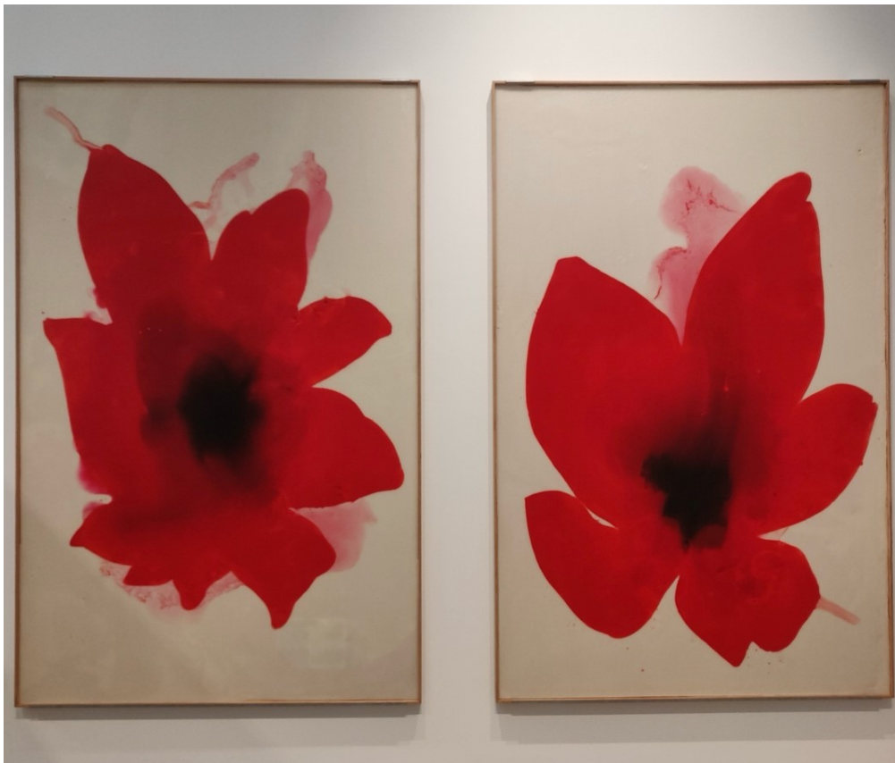
Kuva 6. José María Sicilia, La luz que se apaga 1999. Vaha ja öljy puulle 185 x 122 cm.

Tämänhetkistä taiteellista työskentelyäni inspiroi vahvasti espanjalainen kuvataiteilija José María Sicilia (s.1954). Hän keskittyy maalauksissaan abstraktioon ja materiaalisuuteen. Hän työskentelee materiaalin näkökulmasta ja analysoi teoksissaan muotoa, tilan rakentamista ja valon rakennetta. Sicilia tutkii valoa ja materiaa, sekä ilmentymisen ja poissaolon välisyyksiä, kuinka valo on vuorovaikutuksessa materiaalin kanssa, luoden maalauksiin visuaalisia tiloja ja tunnetta syvyydestä. Häntä kiinnostaa valon ja materian luomat kangastukset, jotka saavat hänen teoksissaan asiat ilmestymään ja katoamaan. (Artnet n.d.) Abstrakteissa maalauksissaan hän hyödyntää mehiläisvahaa, joka mahdollistaa valon ja sen luomien tilojen vuoropuheen kuvapinnalla (Galeria Joan Prats n.d.).