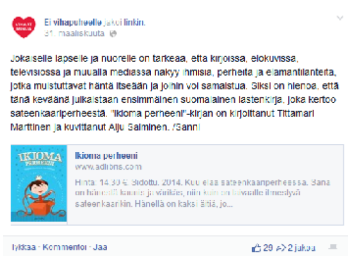
Kuva1 Tilapäivitys Ei vihapuheelle -liikkeen Facebook-sivulta. (viitattu 15.11.2014)

Facebook on Ei vihapuheelle -liikkeen aktiivisin kanava ja eniten myös aktivistien päivittämä. Facebookissa organisoidaan toimintaa ja keskustellaan päivittäin. Aktivistit päivittävät julkiselle sivulle aktiivisesti sisältöä. Useimmiten aktivistit jakavat sisältöä muilta sivuilta ja esimerkiksi jäsenjärjestöjen linkkejä. Jaettuun sisältöön liitetään kuitenkin kuvaileva tai kantaaottava kommentti, joka liittyy päivityksen Ei vihapuheelle -liikkeen ajamiin teemoihin.