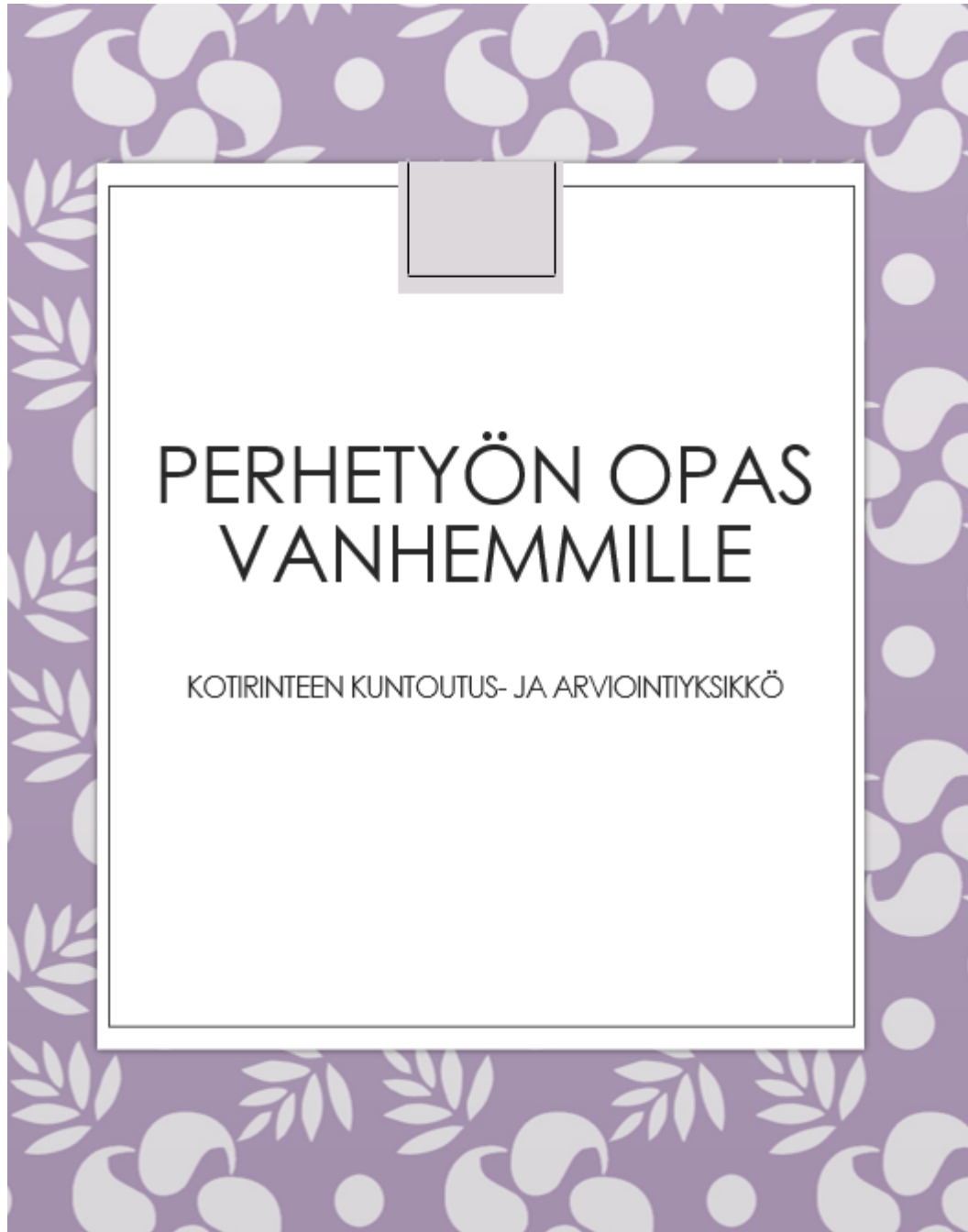
Liite 6: Oppaan kansi