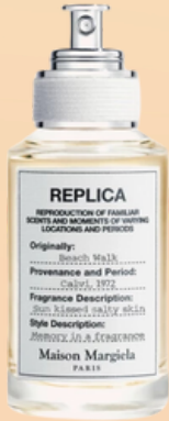
Maison Margiela Replica Beach Walk

TUOKSUNUOTIN VOIMAKKUUDESTA RIIPPUEN VOIVAT TOIMIA MYÖS SYDÄNTUOKSUNA