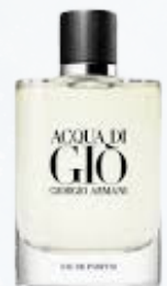
Armani Acqua Di Giò

Kauppanimellä raaka-aine tunnetaan usein Aquamor, Calone ja Ganone