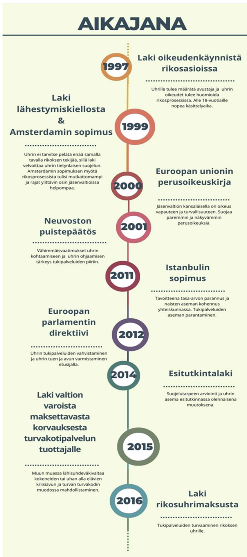
KUVA 2. Aikajana