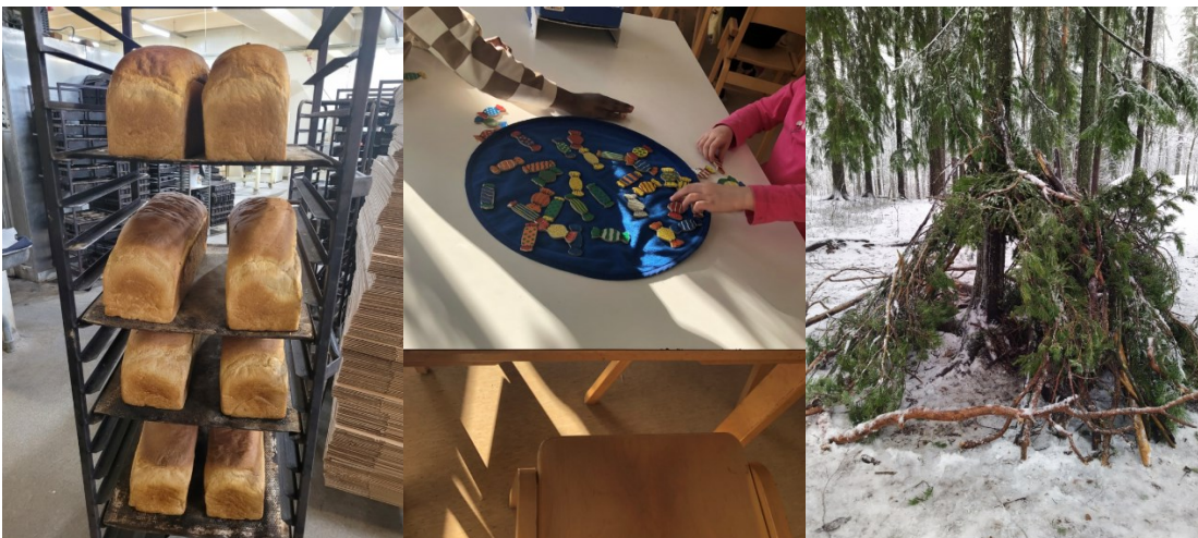
Kuvasarja 1. Opiskelijan ensimmäinen valokuva voi olla mistä tahansa ammattialan ympäristöön kuuluvasta kohteesta.

Portfoliopedagogiikassa opiskelijan aktiivinen rooli on tärkeä heti opintojen alkaessa. Huomasimme, että prosessin käynnistämävaiheessa esiintyi toistuvasti ongelmia. Alussa opiskelijoiden oli vaikea keksiä, mistä he ottaisivat kuvia. Opettajan tehtävänä tässä alkuvaiheessa olikin ohjata ja antaa ideoita siitä, mistä kaikista kuvista voi ottaa. Pikkuhiljaa opiskelijat oivalsivat, että kuvia voi ottaa aivan tavallisista työarjen ympäristöistä, tilanteista ja tehtävistä. Kuvasarjassa 1 on esimerkkejä siitä, millaisiin asioihin opiskelijoiden huomio kiinnittyi elintarvikealan tai varhaiskasvatuksen työssä. Valokuvaan leipäruudukosta, pelilaudasta tai metsämajasta opiskelijat osasivat yhdistää ihmisiä ja ihmisten välillä käytyjä vuoropuheluja. Kuva toi mieleen myös erilaisia työtoimintoja ja niissä käytettyjä työvälineitä. Kuvat auttoivat opiskelijoita palauttamaan mieleen kokonaisvaltaisen kokemuksen työpaikalla tapahtuvassa oppimisessa.