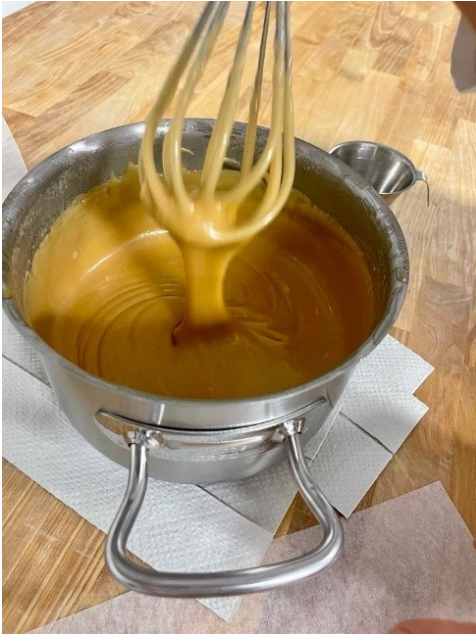
Kuva 2. Opiskelija tapailee suomenkielisiä verbejä samalla kun kertoo kuvasta

Ammattiaineiden ja yhteisten tutkinnon osien opettajien tietoinen ePortfoliota hyödyntävä yhteistyö rakensi opiskelijan kokonaisvaltaista oppimisprosessia, jossa opiskelijalla oli mahdollisuus harjaantua samanaikaisesti sekä ammattitaidoissa että yleisissä taidoissa.