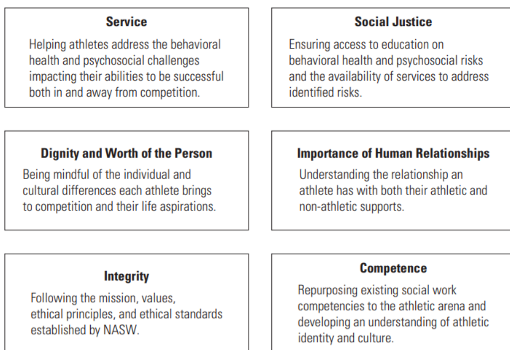
Kuva 1. Urheilusosiaalityön arvot ja etiikka, sovellettu kohteesta Kansallinen sosiaalityöntekijöiden liiton NASW:n eettiset periaatteet (2017)