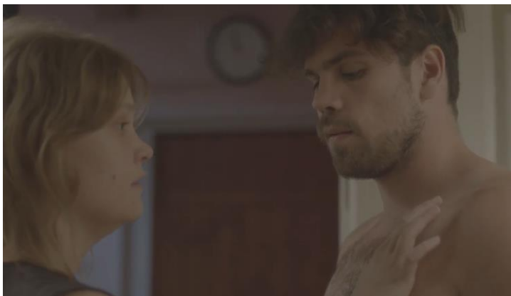
Kuvat 11 ja 12: VARJOJUHLA