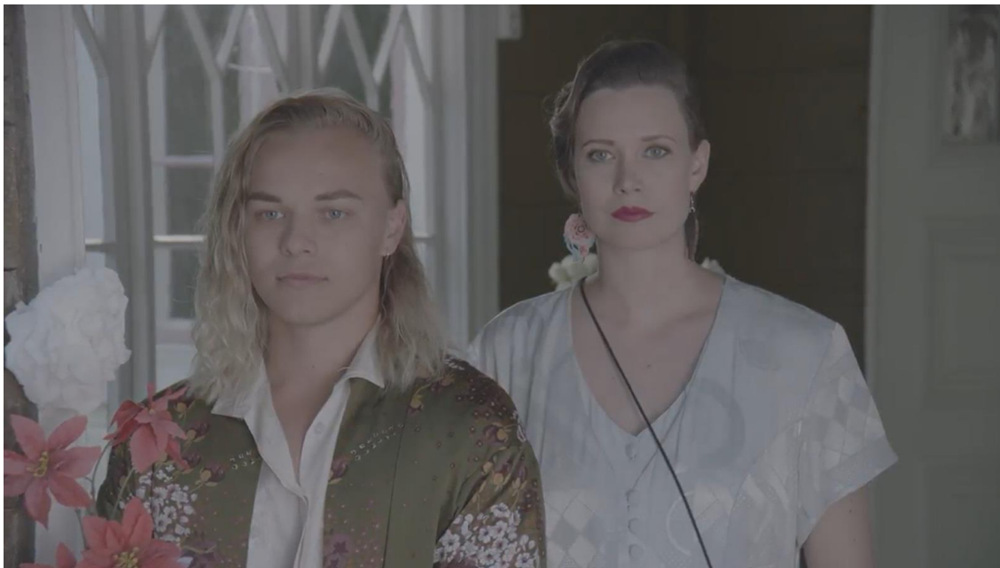
Kuva 4: Kuvakaappaus elokuvasta VARJOJUHLA.

rakenteeseen ilmeni, olimme välittömästi yhteydessä varmistaaksemme, ettei se vaadi merkittäviä muutoksia myös toisen osapuolen työstä.