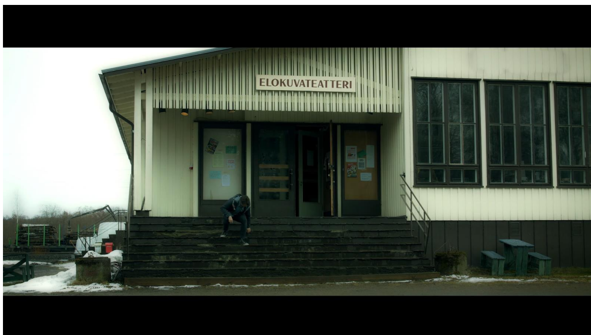
Kuva1: Kuvakaappaus elokuvasta KUNTA.

Kunnan esivalmistelut alkoivat jo huomattavan paljon aikaisemmin kuin yksikään muu projekti missä olen ollut mukana. Ohjaaja esitti ideansa minulle jo 2018 ja lähdimme pohtimaan miten projektin voisi parhaiten toteuttaa. Ajatuksena oli se, että komediaelokuvaan olisi hyvä saada komediaorientoitunut leikkaaja ja koska meillä oli yhdessä useita vastaavan kaltaisia käsikirjoitusprojekteja takana tuntui luonnolliselta, että leikkaisin projektin. Kävimme siis paljon keskusteluja pelkäämään idean alkuperästä, ohjaajan omista kokemuksista pikkukylässä asumisesta sekä siitä, millaisiin ajatuksiin yhdistän itse suomen pienimmät kaupungit. Olin jossain määrin mukana käsikirjoitusprosessissa myös. Annoin palautetta ja pohdin mihin suuntaan lähtisin itse viemään. Kävin myös seuraamassa opettajien kanssa käytyjä palautekeskusteluja. Pyrin pysymään mahdollisimman kärryillä uusista ideoista, ja siitä mihin suuntaan tarina on etenemässä. Tarina ja sen visualisointi oli mielestäni tärkeä työkalu edittiin valmistautumiseen.