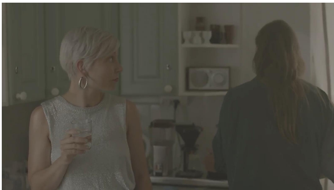
Kuva 9: Kuvakaappaus elokuvasta VARJOJUHLA.

Yksi elokuvan pääjuonia on Selenan ja Lauran välisen suhteen kehittyminen. Selenä on ihastunut Lauraan ja ihailee hänen elämäntyyliänsä. Laura lämpenee elokuvan loppua kohden myös Selenaa kohtaan, mutta kehitys on hidasta. Kohtauksissa pyritään antamaan yksityiskohtien kautta hahmojen välistä dynamiikkaa. Yksi esimerkki on aamukohtaus elokuvan puolivälissä.