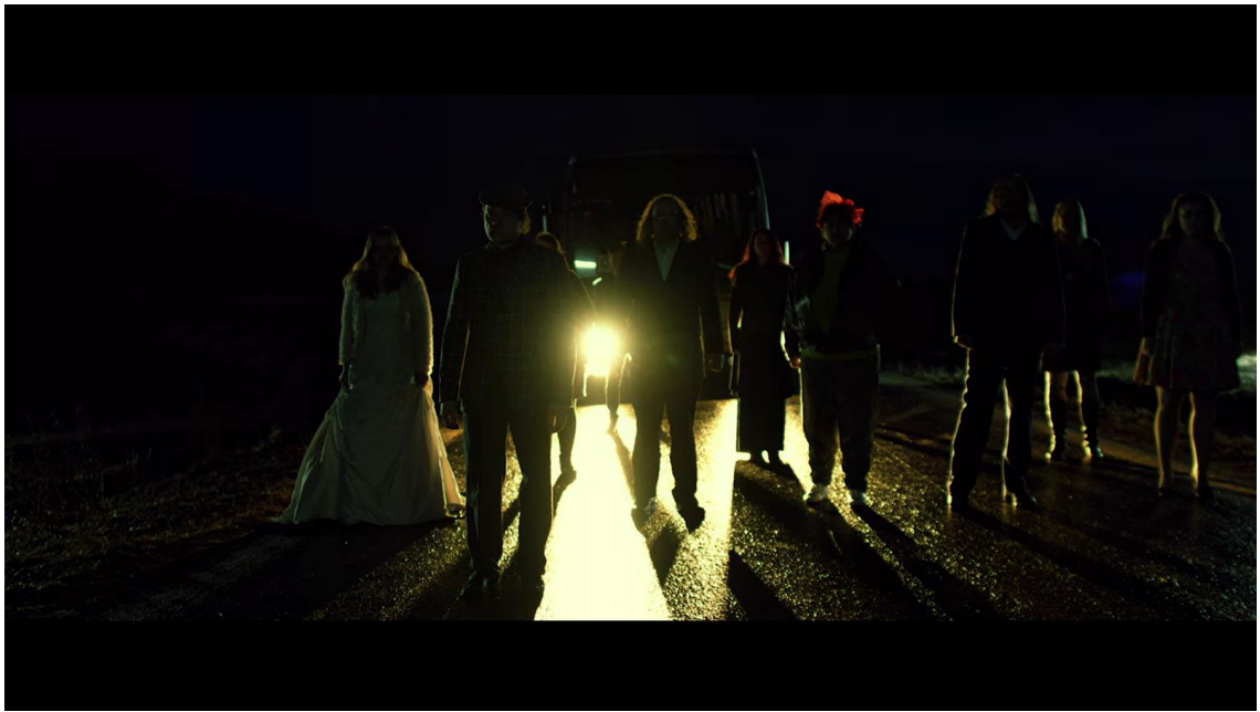
Kuva 7: Kuvakaappaus elokuvasta KUNTA.