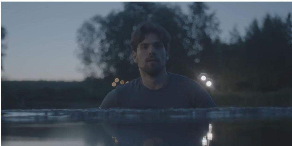
Kuva 5: Kuvankaappaus hukuttautumiskohtauksesta. (VARJOJUHLA)

rakenteen järjestäminen niin että lopun hukuttautumiskohtaus olisi mahdollisimman looginen.