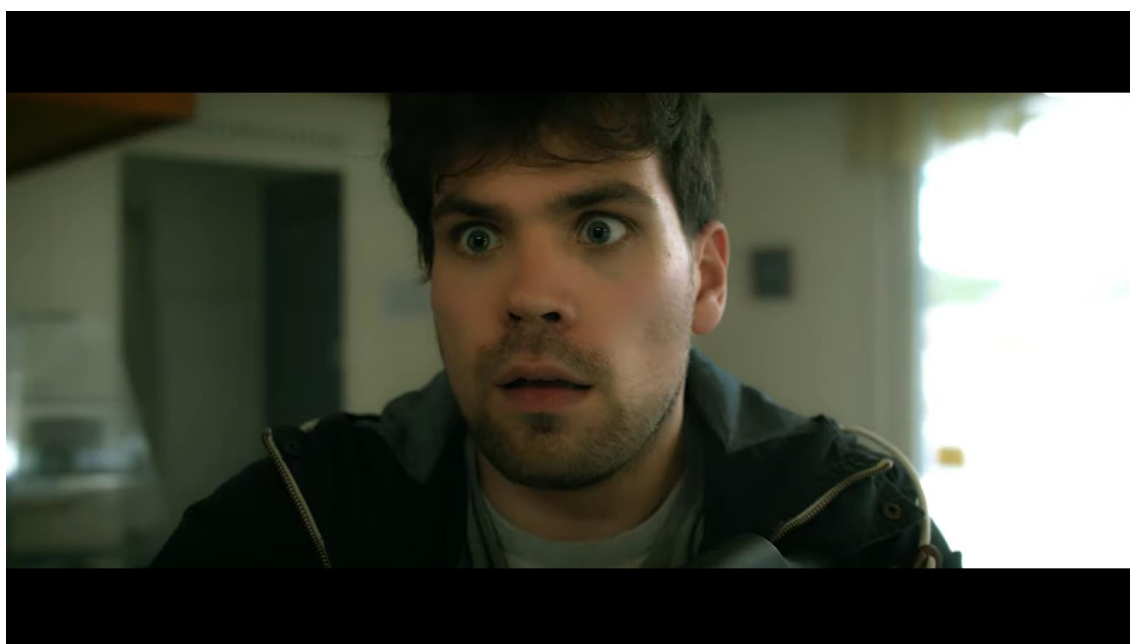
Kuva 8: Kuvankaappaus pankkiryöstökohtauksesta. (KUNTA)

Kohtauksen leikkaamisessa oli tärkeää pitää mielessä mitä siinä todellisuudessa tapahtuu. Jokainen päähenkilön uhkaava käsky oli isku kuntaa vastaan ja siihen vastaavat reaktiot olivat vastaisku päähenkilölle. Koska kunnan ylivallan oli tarkoitus välittyä kohtauksesta, piti kuntalaisten vuorosanojen tulla päähenkilöä runsaammin. Niiden piti kasaantua ja näin ollen leikkaamalla oikein saada mielikuva, että päähenkilö ahdetaan nurkkaan pelkästään puhumalla tilanteessa jossa hänellä itsellä on ase. Oikein leikattuna ja ilmaistuna omituinen mielikuva toimii viihdyttävänä ja hauskana kohtauksena.