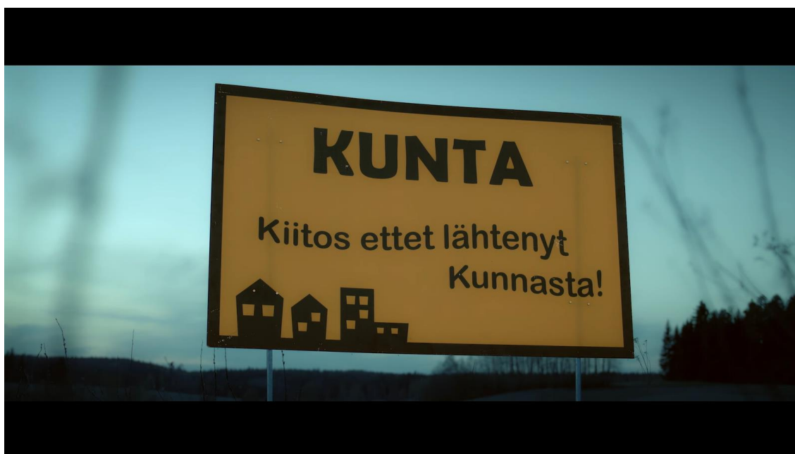
Kuva2: Kuvakaappaus elokuvasta KUNTA.

Näin ollen tein säännöstä oman lisäyksen itselleni: Jos kohtaus ei sisällä ”nauruja” eli siinä ei ole komediallista elementtiä, se tulisi joko poistaa tai muokata sellaiseen muotoon, että kriteerit täyttyisivät. Omana inspiraationa tähän sääntöön ovat yhdysvaltalaiset sitcomit(tilannekomedia) joiden perinteinen muoto on naururaitojen kanssa tiheästi vitseillä viljellyt kohtaukset. Vitsit voivat esiintyä missä muodossa tahansa. Ne voivat olla dialogin yhteydessä ilmaistuja sanallisia ”punchlineja” tai ne voi ilmaista visuaalisilla keinoilla kuten elokuvan alussa nähty kyltti, jossa lukee ”kiitos kun et lähtenyt kunnasta!”. Vitsi voi olla myös musiikin avulla ilmaistu kuten Kunnan ”radiohitti” yhdistettynä päähenkilön ankeaan elämään.