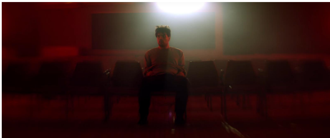
Kuva3: Kuvakaappaus unikohtauksesta. (KUNTA)

käymään huomattavan paljon keskustelua jopa turhautumiseen asti, kunnes lopulta saimme siitä sellaisen mihin olimme molemmat tyytyväisiä.