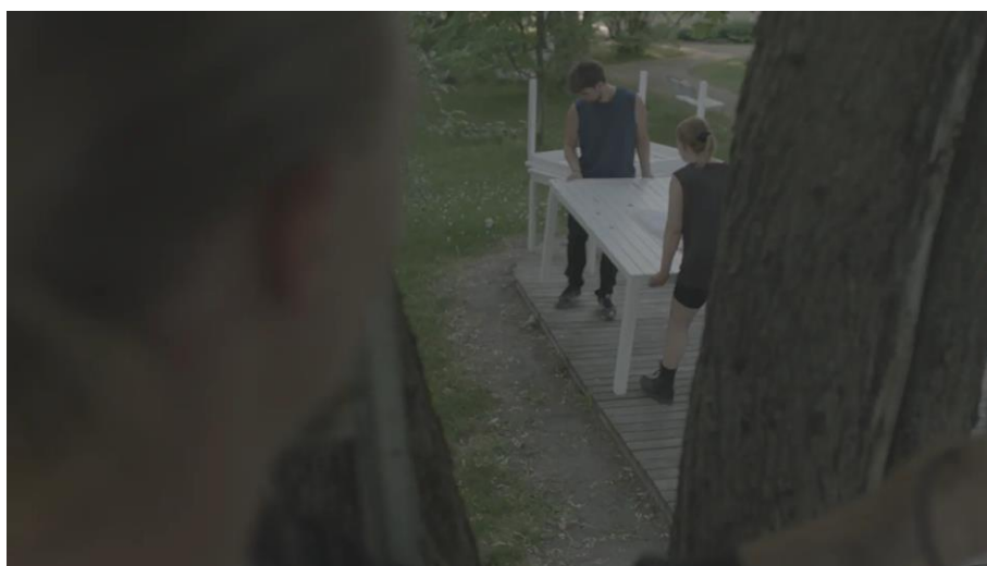
Kuva 10: Kuvakaappaus VARJOJUHLA

Kohtaus kertoi siis epäsuorasti katsojalle Selenan ja Lauran välien lähenemi- sestä yksityiskohtien kautta. Samanlainen lähestymistapa oli välttämätöntä ot- taa koko elokuvaan.