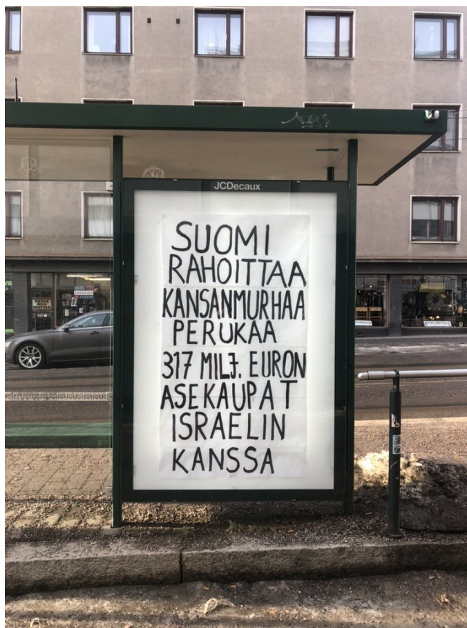
Kuva 24. Vallattu bussipysäkin mainoskaappi 30. tammikuuta 2024 Helsingissä (Tyrväinen 2024)

Siinä missä mainosmaailma päättää kuka on osa yhteiskuntaa ja kuka ei, mediassa on valta päättää mitä uutisoidaan, miten ja milloin. Esimerkiksi Gazassa tapahtuva kansanmurha kauhistuttaa kansalaisia eri puolilla maailmaa, ja se annetaan näkyä: monet ovat pettyneitä mediaan ja hallitukseen, joka johtaa tilanteeseen, missä faktat ja mielipiteet tuodaan itse julki kadulle tarran tai muun viestinnän keinoin, kuten valtaamalla mainoskaappi (kuva 22).