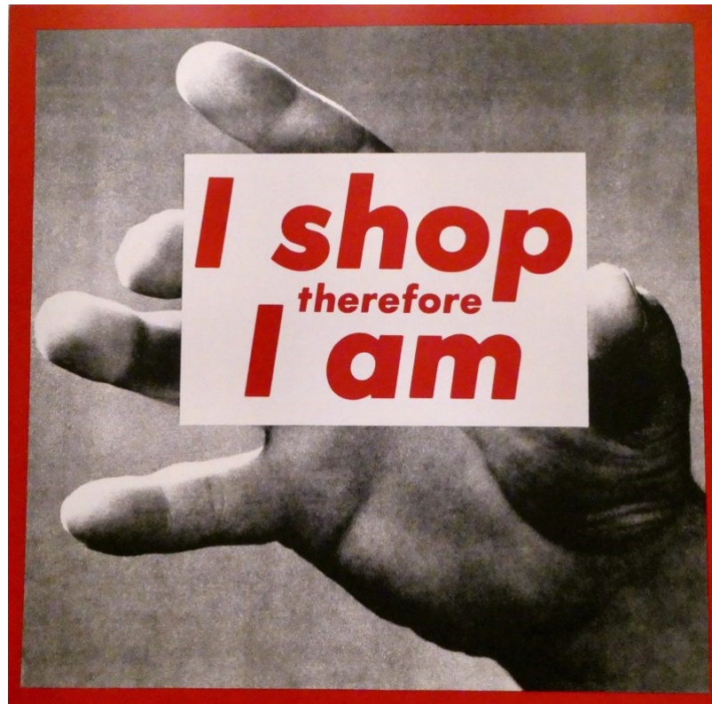
Kuva 14. Barbara Kruger – I shop therefore I am, 1987, serigrafia vinyylille, 125 x 125 cm

ympäröivässä maailmassa. Konsumerismin mukaan runsas kulutus on hyödyllistä sekä ihmiselle että taloudelle, mutta nykyään tätä taloudellista näkemystä ei enää niellä sellaisenaan. Muun muassa yhdysvaltalainen taiteilija Barbara Kruger, joka yhdistää teoksissaan graafiselle suunnittelulle tuttuja elementtejä, kuten kirjasintyyppejä Futuraa ja Helveticaa, versioi teoksessaan I Shop, therefore I Am (1987) (kuva 14) hienosti René Descartesin kuuluisaa ”Ajattelen, siis olen” lausetta.