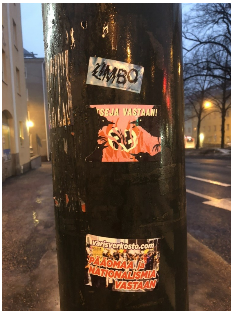
Kuva 21. Katutolppa Vallilan yössä (Tyrväinen 2024)

Katutilaa tarkkailemalla saattaa kiinnittää huomiota siihen, että julkisessa tilassa tarroja löytyy kaikkien neljän sektorien toimesta. Mäenpään ja Faehnlen mainitsema ilmiö neljännen sektorin olemassaolo havainnollistuu kuvassa 21, jossa yökerhon mainos, anonyymi varisverkoston antifasistinen tarra, sekä varisverkoston mainos samassa pylväässä.