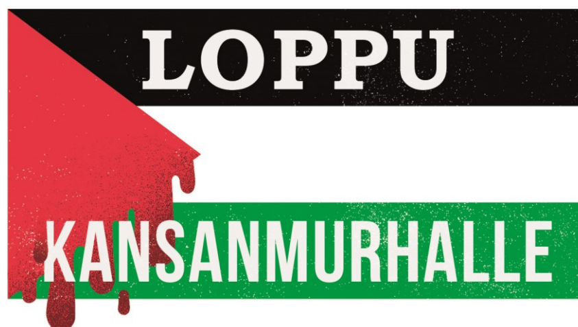
Kuva 26. Hot Mess Visualsin käynnissä olevasta kansanmurhasta muistuttava tarra (Tyrväinen 2024)

Suunnittelijan tai design-aktivistin haasteeksi koen maailmalla tapahtuvien vääryyksien määrän ja suunnittelijan ajanpuutteen. Esimerkiksi uiguurien tilanne Kiinassa on kammottava, johon haluaisin ottaa myös itse kantaa, mutta koulun, työn, Hot Messin, muiden projektien sekä tietysti vapaa-ajan kanssa tasapainoilu voi olla ajoittain hankalaa. Moniin asioihin tai tilanteisiin pitäisi kyetä reagoimaan salamana, vaikka aina se ei ole mahdollista. Koska neljäs sektori toimii oman eettisen missionsa ja nopean aikakäsityksensä mukaan (Mäenpää & Faehnle 2021, 211), se harvoin haluaa muiden sektorien toimintaan liiaksi mukaan, sillä tällainen toiminta voisi rapauttaa niiden omaa identiteettiä ja toimintatapoja esimerkiksi hidastamalla asioiden etenemistä.