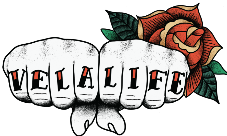
Kuva 18. Hot Mess Visualsin vapaaehtoisesti lapsettomat -tarra (Tyrväinen 2022).

Hot Messin old school tatuointi -henkinen tarra (kuva 18) yhdistää sekä parjatut, epäluuloa herättävät rystystatuoinnit sekä vapaaehtoisesti lapsettomuuden julistamalla vela life.