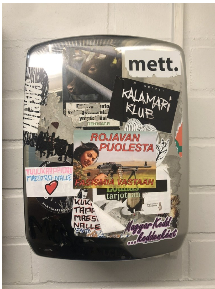
Kuva 22. Yhteen käsipaperitelineeseen mahtuu monenlaista viestiä. (Tyrväinen 2024)

Kaupunkiaktivismien kokonaisuus on laaja, limittäin ja lomittain kasvava alue, ja siksi siitä puhuttaessa onkin hyvä käyttää monikkoa. Kaupunkiaktivismien syntyyn ei välttämättä vaikuta konfliktit tai epäoikeudenmukaisuuden kokemus, mutta tässäkin tapauksessa rajoja on vaikea vetää. Aktivismit voivat syntyä someryhmien, osuuskuntien tai muiden hankkeiden myötä. Koska kaupunkiaktiveissa kyse on monen sortisesta toiminnasta, sen poliittisuutta pohtiessa on Mäenpään ja Faehlen mukaan parempi kysyä millä eri tavoilla poliittista ainesta esiintyy kaupunkiaktivismien kentällä (Mäenpää & Faehnle 2021, 182). Kaupunkikuvaa tarkkaillessa on helppo todentaa erilaisten toimijoiden laaja kirjo. Kuten kuvaan 22 on tallentunut, yhteen käsipaperitelineeseen mahtuvat eläinoikeuksien puolestapuhujat, tapahtumia mainostavat, fasismia vastustavat ja muut.