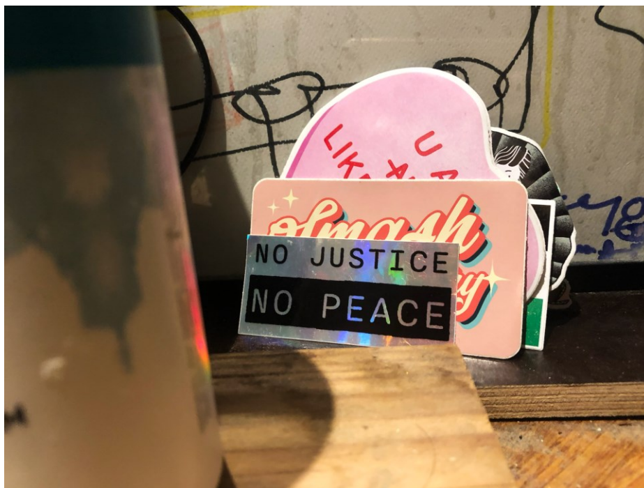
Kuva 1. Hot Mess Visualsin tarroja jätettyinä julkiseen tilaan (Tyrväinen 2024).

Tähän mennessä Hot Messin alla on noin 20 erilaista tarraa. Lisäksi osana projektia suunnittelin myös logon, jolla leimata itse suunnitellut kirjekuoret tarrojen postitusta varten. Projektia on tukenut Taiteen edistämiskeskus, Kuvittajat ry, Grafia ry sekä Jenny Perman rahasto.