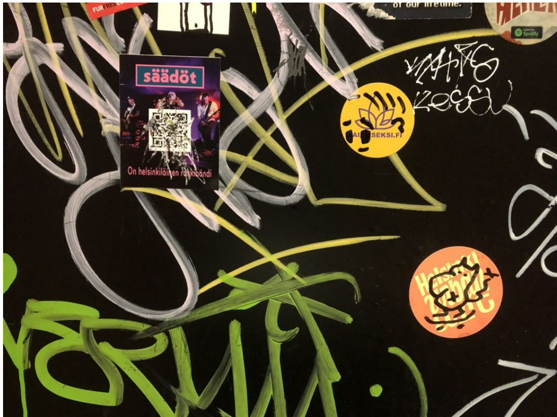
Kuva 19. Helsinkiläinen rokkibändi, kannabiksen laillisuutta ajava sivusto eikä katutaide luotsaava Helsinki Urban Art ole miellyttäneet kaikkia ihmisiä.

pysyä paikoillaan projektin alkuaajoista lähtien. Olen kuullut myös tarinoita, miten Hot Messin tarroja on saatettu irrottaa seinistä, jotta ne voidaan liimata oman puhelimen selkämäykseen.