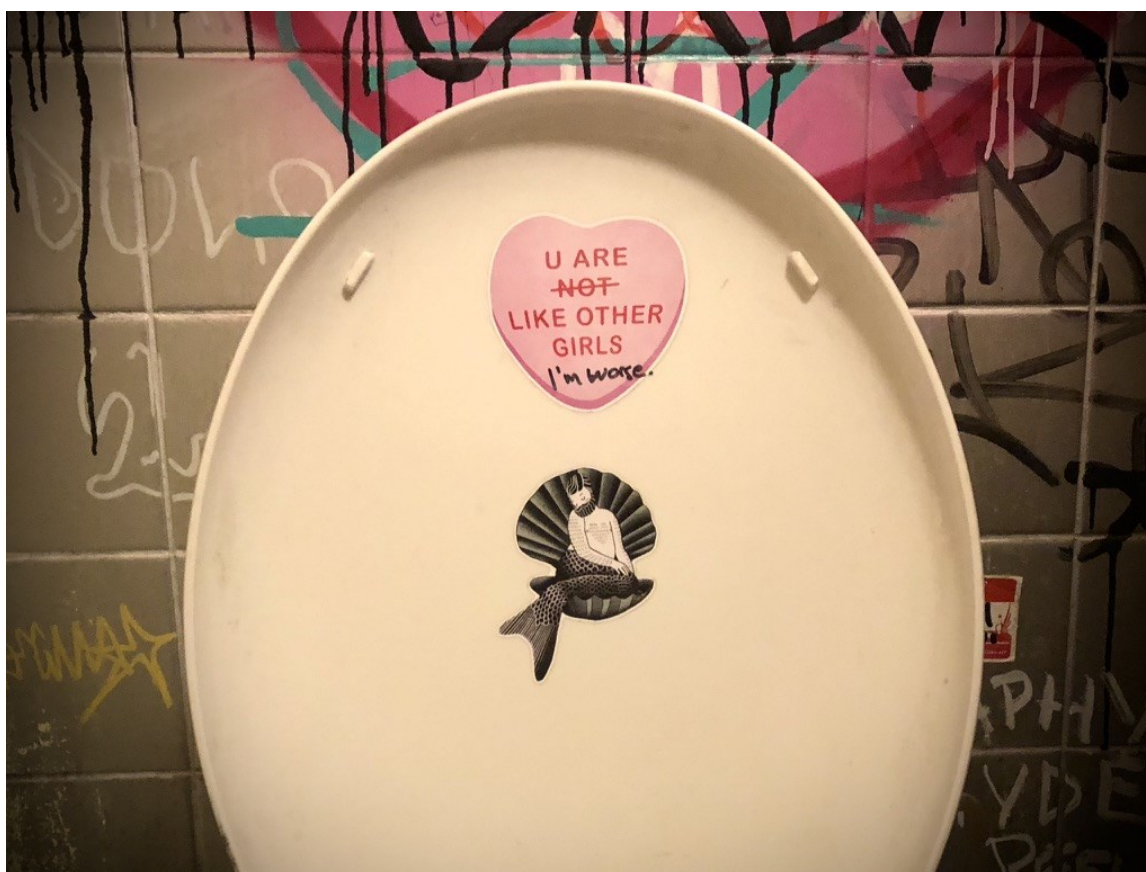
Kuva 20. Anniskeluravintolan vessassa nähtyä (Tyrväinen 2024).

Samassa kuvassa myös yksi toinen Hot Messin tarroista, jossa hyvin löyhästi mukaillaan Botticellin Venuksen syntymää ja Pientä merenneitoa. Kuvituksessa olen sallinut miehen olla lempeä ja herkkä niin luonteeltaan kuin ulkonäöltäänkin: pehmeässä vaaleanpunaisessa kehossa rintakarvatkin muodostavat sydänkuvion.