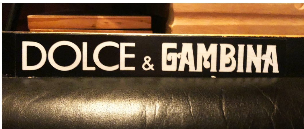
Kuva 11. Kahden logon yhdistelmä (Tyrväinen 2024).

Jotta détournement toimii kulttuurihäirinnän välineenä, on muokattavan artefaktin oltava tunnistetavissa tarkoitettulle yleisölle (Malitz 2012, 30), kuten kuvan 11 tapauksessa, jossa on yhdistetty italialainen luksusmerkki Dolce & Gabbana kulttimainetta kantavan Gambina-alkoholin kanssa.