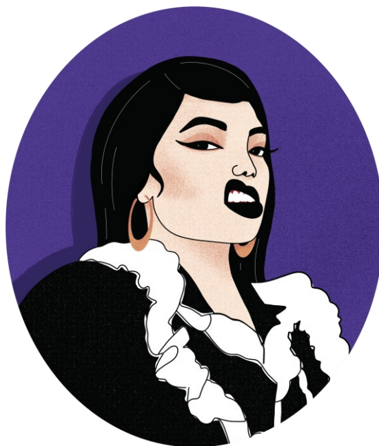
Kuva 16. Hot Mess Visualsin romaniaiheinen tarra (Tyrväinen 2022).

Sisäänkasvanutta rasismia tai naisvihaa ei välttämättä edes tunnista, ja niistä irti pääseminen vaatii aktiivista työtä. Siksi romaniniais-aiheinen kuvitus päättyi Hot Messin valikoimaan (kuva 16). Kuvan romaninaisen ilmeen voi tulkita määrätietoiseksi ja melkeinpä röyhkeäksi: jotain, mitä naisessa ei vielääkään haluttaisi suvaita. Sisäistetty naisviha elää ja voi hyvin 2020-luvun Suomessa. Miesten toivoma ja naisten toteuttama muista tytöistä erottautuminen, ”en ole kuin muut tytöt”, on vanha tapa, jonka olisi jo toivonut jääneen historiaan. Like other girls -tarra (kuva 17) on rakkaudentunnustus kaikille tytöille: tyttöydessä ei ole mitään väärää. Kuva viittaa sweethearts- tai conversation hearts -nimellä tunnettuihin makeisiin, jotka linkittyvät ystävänpäivään.