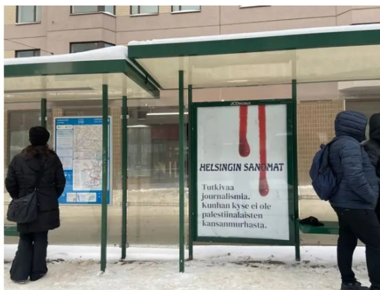
Helsingin Sanomien vastamainos perjantaiaamuna.

Aktivismi | Raitiovaunupysäkillä ilmestyi luvaton juliste Helsingin kantakaupungissa.