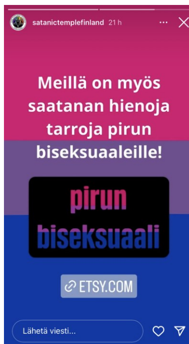
Kuva 2. Kuvakaappaus @satanicemplefinland-tililtä 23.9.2024, jossa mainostetaan myytävää ”pirun biseksuaali”-tarraa biseksuaalisuuden näkyvyyden päivänä.

magentan, violetin ja sinisen väreistä, kun vietetään biseksuaalisuuden näkyvyyden päivää (Celebrate Bisexuality Day). Esimerkiksi Suomen Satanic Temple mainosti biseksuaaleja näkyväksi tuovia tarrojaan (kuva 2).