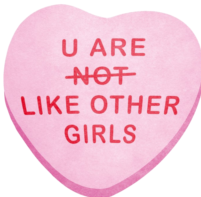
Kuva 17. Hot Mess Visualsin Like Other Girls -tarra (Tyrväinen 2022).

Mainokset sisältävät ymmärtääkseni usein kätkeytyn viestin: mikä on sinun asemasi ja paikkasi tässä yhteiskunnassa. Representaation moninaisuus sitouttaa ihmisiä yhteiskuntaan luomalla tilan, mihin kuulua. Toinen ryhmä, joka ei varsinaisesti ole vähemmistöä, mutta jota olen Hot Mess Visuals -projektissa halunnut nostaa yhden tarradesignin muodossa, ovat vapaaehtoisesti lapsettomat. Mainonta, media ja hallitus ruokkivat sanallisesti ja kuvallisesti, suorasti ja epäsuorasti viestiä: tässä yhteiskunnassa tehtäväsi on lisääntyä. Lapsettomuus ja esimerkiksi yksinasuminen nähdään vain väliaikaisena vaiheena, eikä Xamkin ja Vapaaehtoisesti Lapsettomat ry:n teettämän tutkimuksen (2024) saatesanojen mukaan