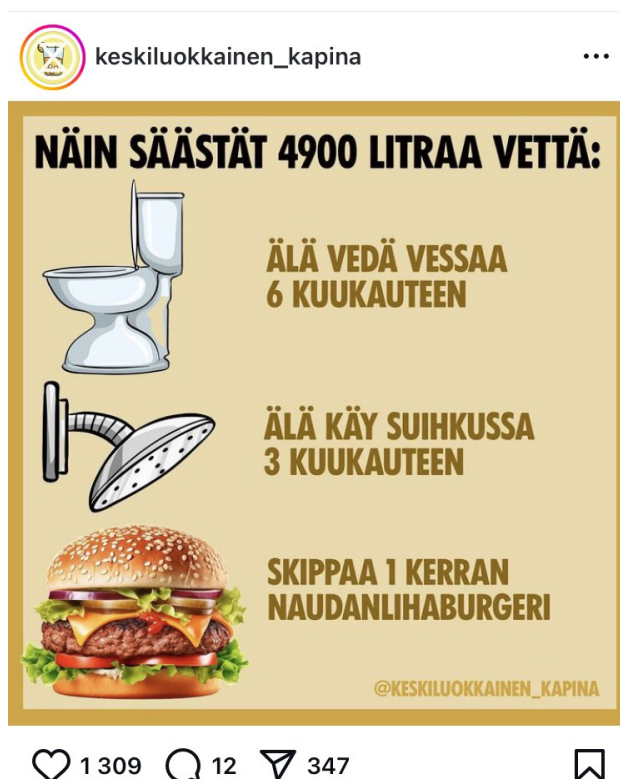
Kuva 27. Ruutukaappaus @keskiluokkainen_kapina-tilin postauksesta. Instagram.

Televisiota, mediaa ja mainontaa 1900-luvun puolivälissä kritisoineet eivät ehkä olisi voineet kuvitella, millainen 2000-luku tulisi olemaan. Sosiaalisen median kanavasta Tiktokista on tullut nuorille niin merkittävä uutis- ja ajankohtaistiedon lähde, että se on kiilannut jopa iltapäivälehtien ohitse (Parkkinen 2024). Myös Instagram on kasvanut tiedon lähteenä, jossa tekstisisältö tiivistetään pieniksi kuvasarjoiksi ja emojeiksi. Tietoa myös visualisoidaan tiivistämisen lisäksi: so-memaailma on nopea, ja sisällön on iskettävä samantien. Esimerkiksi Instagramissa toimiva @keskiluokkainen_kapina on tehnyt kuvan lihansyönnin vaikutuksista vedenkulutukseen (kuva 27).