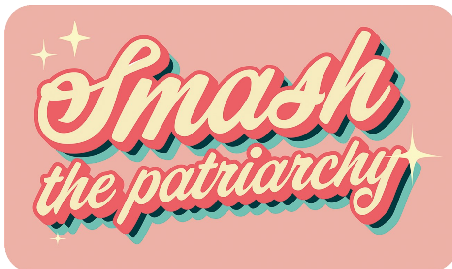
Kuva 4. Hot Mess Visualsin 50-luvun estetiikkaa henkivä Smash the Patriarchy (Tyrväinen 2022).

ilmaisun ja viestin välinen ristiriita. Erilaiset kontrastit ovat aina kiinnostaneet minua, sillä ne korostavat viestiä ja toimivat siten tehokeinona. Muissa töissäni olen esimerkiksi yhdistänyt somaa ja kamalaa samaan kuvaan.