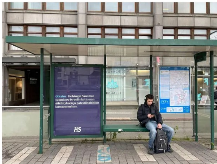
Uusi luvaton juliste oli perjantaina ripustettu Ruoholahden villojen raitiovaunupysäkillä Helsingissä. Juliste jäljittelee Helsingin Sanomien tyyliä, mutta se ei ole lehden.

Aktivismi | Raitiovaunupysäkillä Helsingin keskustaan ilmestyi uusi luvaton juliste. Tällä kertaa juliste käsittelee Israelin ja Gazan tilannetta.