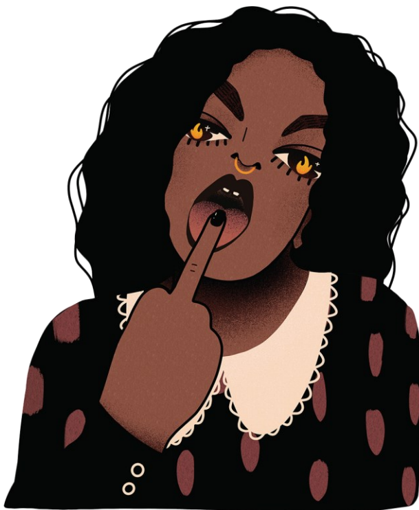
Kuva 23. Keskisormen näyttöä Hot Mess Visualsin tarrassa. (Tyrväinen 2022)

Koska design-aktivismiin määrittely vaihtelee hiukan määrittelijästä ja katsontakannasta riippuen, design-aktivismi ei välttämättä ole poliittista, mutta omasta mielestäni politiikkaa ja toimintaa on hankala erottaa, sillä teko, tai tekemättä jättäminen, johon liittyy toinen ihminen, on aina jollain tavalla poliittista. Terminä politiikka on laaja ja vaikea määrittellä, ja se voidaan ymmärtää monella tavalla: se voi tarkoittaa hallitsemisen taitoa ja valtion toimintaa, yhteisön asioiden hoitamiseen liittyvää toimintaa, konfliktien ratkaisua kompromissien ja neuvottelujen avulla, tai yhteisön resurssien hallintaa ja vallan käyttöä halutun lopputuloksen saavuttamiseksi (Wikipedia i.a). Tutkijoiden Della Portan ja Dianin mukaan yhteiskunnallisten liikkeiden toiminnassa korostuvat jaetut uskomukset ja solidaarisuus, joiden ympärille muodostuu epämuodollisesti toimijoiden verkostoja (Della Porta & Diani 2017, 13–14). Empatia sekä solidaarisuus kuuluu myös Hot Messin arvoihin vahvasti, ja tätä arvoa jaetaan tarroja, eli viestiä viemällä. Näytetään, että tuetaan. Esimerkiksi tarra, jossa POC-nainen (People of Colour) näyttää tulla silmissä palaen röhkeästi keskisormea (kuva 23) on kunnianosoitus kaikille rohkeille naisille.