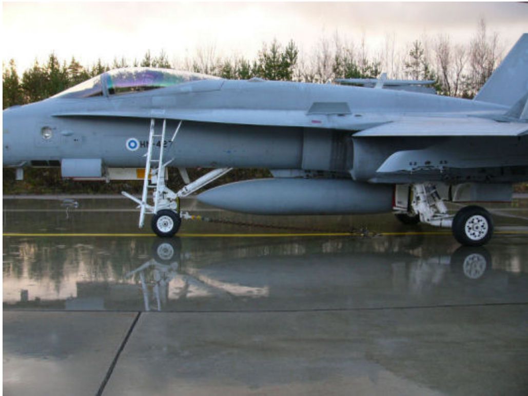
Kuva 4.2. Hornetin nokkapyöräankkurointi Pirkkalan tukikohdan koekäyttöpaikalla.

on yhteensopiva sekä HN:n että HW:n ankkurointilaitteistojen kanssa. Ilmavoimat käyttää kyseisestä ankkurointipisteestä (kuva 4.3) osamerkintää 2HN 024-1. Oulunsalon tukikohdan koekäyttötason piirustuksessa ankkurointipiste on sijoitettu koekäyttöalustan keskivaiheille 8,2 metrin päähän betonilaatan etureunasta. Sijoituskohdan on todettu olevan sopiva Hornetin ankkurointia varten. Kuvassa 4.2 HN on ankkuroituna Pirkkalan tukikohdan koekäyttöpaikalle. /9, 20/