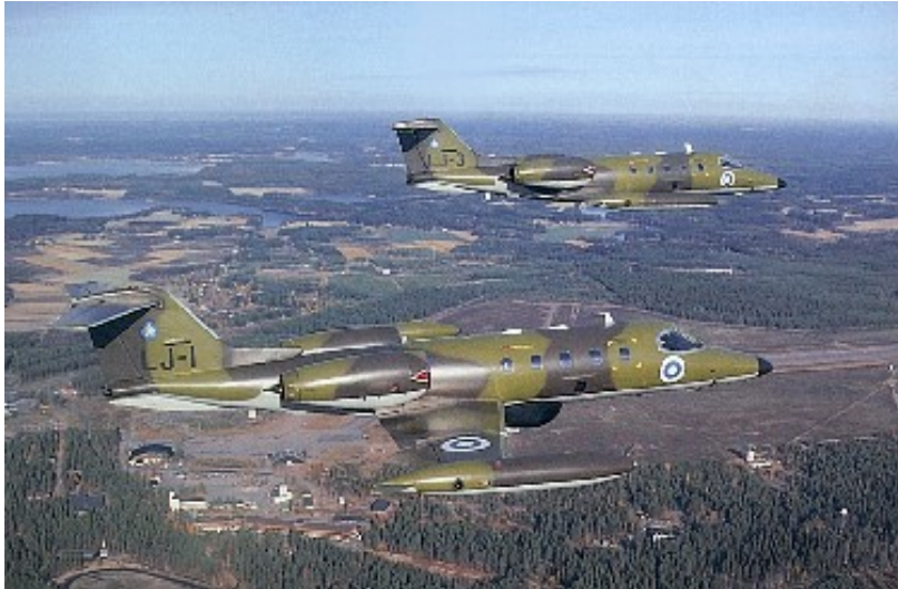
Kuva 2.5. Kaksi ilmavoimien Learjet-monikäyttösuihkukonetta. /1/