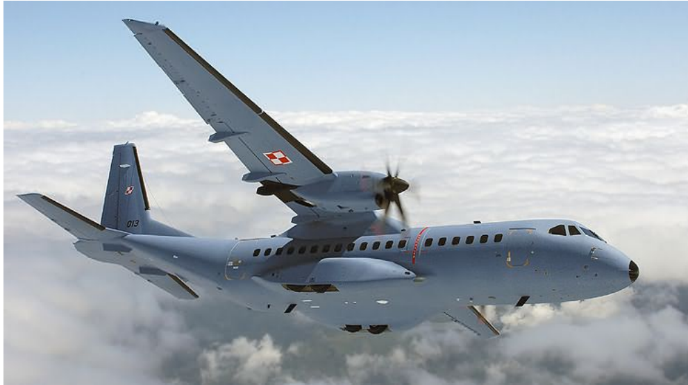
Kuva 2.4. Kuljetuskone Casa C-295M. /22/

aikana. 5000 kilometrin toimintasäde mahdollistaa operoinnin kansainvälisiin kohteisiin kauaskin Suomesta. /1/