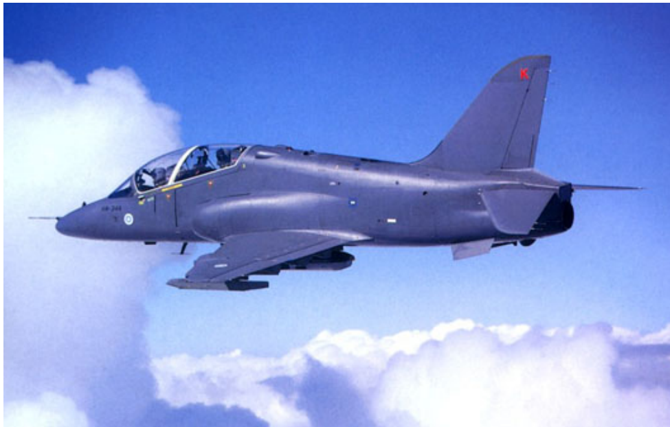
Kuva 2.2. Hawk-harjoitushävittäjä. /1/

Hornetien tavoin myös Hawkeja aiotaan käyttää aktiivisesti 2020-luvulle asti. Viime aikoina koneisiin onkin tehty merkittäviä päivityksiä, joista näkyvin on ns. lasiohjaamo-modifikaatio. Siinä osa perinteisistä analogisista mittareista ja laitteista korvataan nykyaikaisemmilla digitaalisilla näyttöruuduilla. Muutoksilla on tarkoitus kaventaa eroa Hornetilla lentämiseen verrattuna, jolloin ohjaajien on jatkossa helpompi siirtyä harjoituskalustosta varsinaisen torjuntahävittäjän ohjaimiin. Hawkit toimivat rauhan aikana Kauhavan Lentosotakoululla. Kappaleen otsikossa suluissa oleva HW on ilmavoimien yleisesti käyttämä lyhenne Hawk-lentokoneesta. Hawk esiintyy kuvassa 2.2. /1/