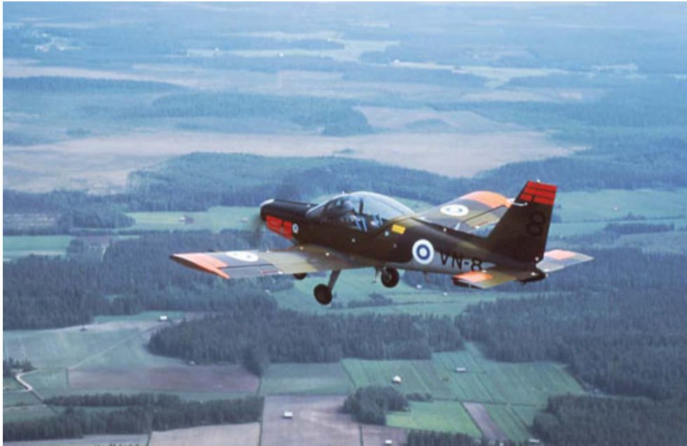
Kuva 2.3. Vinka-alkeiskoulutuskone. /1/

järjestämisen vastikään Patrialle. Vinkalla annettavan alkeiskoulutuksen ja aloitettavan peruskoulutuksen jälkeen tulevat hävittäjälentäjät siirtyvät jatkamaan peruskoulutusta Hawk-harjoitushävittäjillä. Muutamia Vinkoja on myös ilmavoimien muissa tukikohdissa, joissa niitä käytetään lähinnä yhteyslentotoiminnassa. /1/