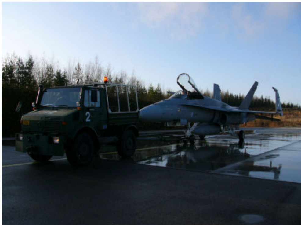
Kuva 4.1. Hornetin siirtämiseen käytetään yleensä Unimog-hinausajoneuvoa.

Oulunsalon tukikohdan seisontatasojen suunnittelussa muut kuin betonoidut lentoliikennealueet toteutettiin vaihtoehdolla, jossa pinnoitteena on 40 mm asfalttikerros. Pinnoitteen alapuolella on myös asfalttinen 60 mm sidottu kantava kerros. Asfalttikerrosten alapuoliset kerrokset ovat samanlaisia kuin edellä kuvatut betonilaatan alapuoliset kerrokset, mutta ilman HDPE-kalvoa. Betonilaattaa ympäröiville reuna-alueille pinnoiteasfaltin sijasta voidaan käyttää densiphalt-pinnoitetta, joka pitää tiiviimmin polttoaine- ja öljyvuotoja. Liikenneväylille riittää asfalttipinnoite. Liikenneväyliä rakennettaessa on myös huomioitava Hornetin vaatima vähintään 25 metrin kaarresäde mutkissa. Hornetia tosin ei rullata koekäyttöpaikalle omilla moottoreilla vaan hinausajoneuvon perässä (kuva 4.1). /21/