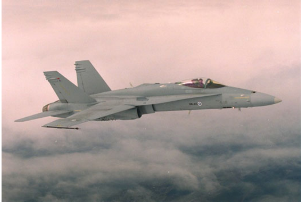
Kuva 2.1. Torjuntahävittäjä F-18 Hornet. /1/

parantamiseksi. Toistaiseksi käytössä on kuitenkin vain ilmasta ilmaan toimivia aseita. Hornetit ovat rauhan aikana sijoitettuna ilmavoimien päätukikohtiin eli Lapin, Satakunnan ja Karjalan Lennostoihin. Ilmavoimat käyttää yleisesti Hornet-lentokoneesta lyhennettä HN, jota myös tässä työssä käytetään samassa merkityksessä. Kuvassa 2.1. näkyy yksipaikkainen F-18C Hornet. /1/