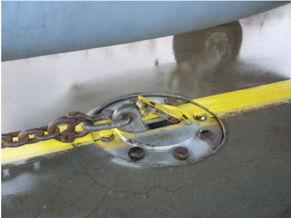
Kuva 4.3. Ankkurikettinki asennettuna ankkurointipisteeseen 2 HN 024-1.