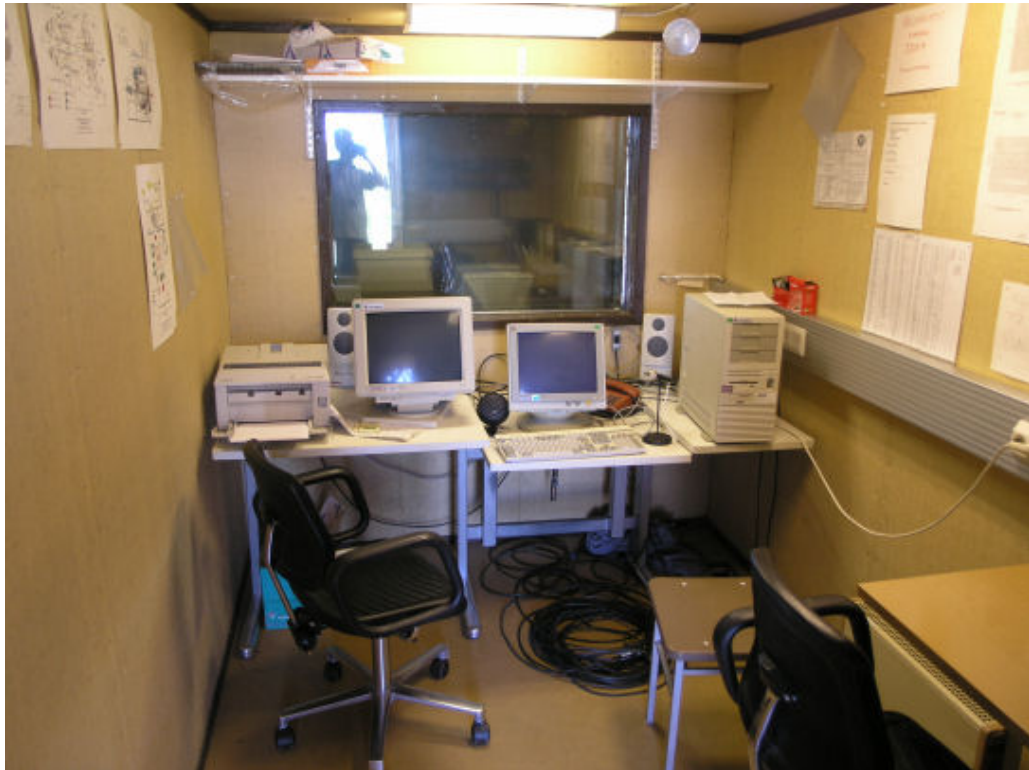
Kuva 4.5. Kauhavan koekäyttöpaikan valvontakontin toimistolaitteistoa. Valvontaikkuna on ollut kuvaa otettaessa peitettynä. /10/