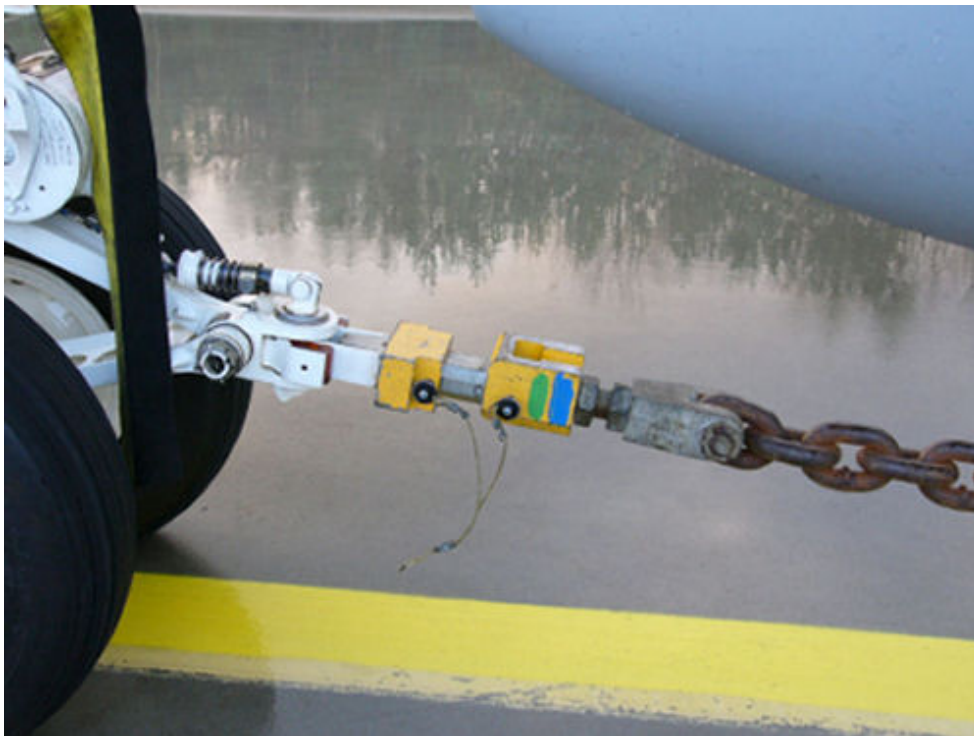
Kuva 4.4. Ankkurikettingin kiinnitys Hornetin nokkatelineeseen.

HN-koekäytössä ankkurointilaitteiston heikoin osa on HN-laiteohjekirjan mukaan ankkurikettingin lentokoneen pään kiinnityspiste nokkatelineessä (kuva 4.4). Koekäyttöpaikan alustan ankkurointipisteen on todettu olevan rakenteeltaan ylimitoitettu siten, että se varmuudella kestää Hornetin työntövoiman aiheuttaman kuormituksen. Nokkatelineessä sijaitsevaa kiinnityspistettä (holdback release bar) käytetään tukialuslento-ohjelmassa osana katapulttijärjestelmää. Kiinnityspiste on mitoitettu tukialuskäyttöä varten kestäväksi 258-274 kN kuormituksia. Näin ollen todetaan sen kestäväksi Hornetin maksimityöntövoimaa 160 kN (molemmat moottorit jälkipoltolla), joka jarrujen pettäessä tulee kokonaan ankkurointilaitteiston kannettavaksi. /11/