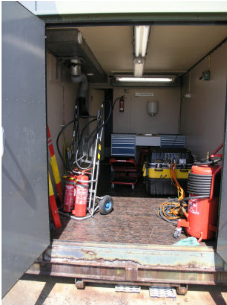
Kuva 4.6. Kauhavalla laitekontissa on säilytetty muun muassa palopulloja ja Moukari-koekäyttölaiteistoa (mustakeltainen laatikko), jota tarvitaan Hawk-koekäytöissä.