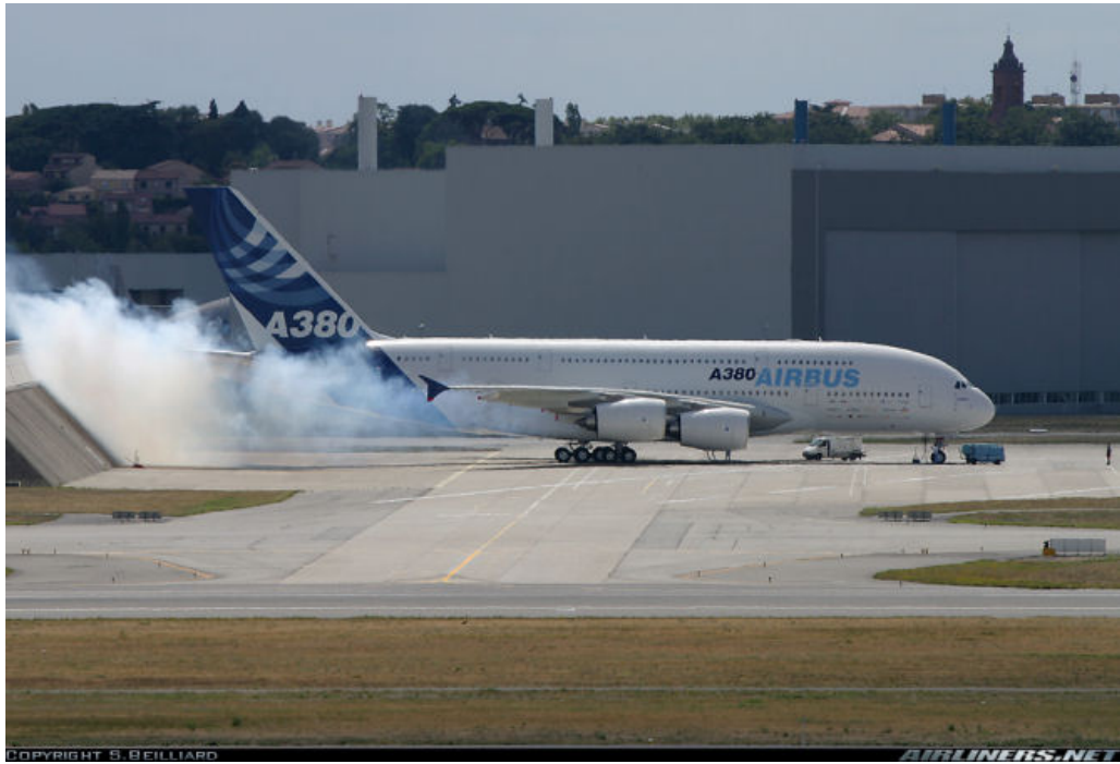
Kuva 3.2. Airbus A380 -superjumbo Airbusin tehtaiden koekäyttöpaikalla. /24/

Finnair Tekniikkaan. Kyselyn vastauksia on hyödynnetty seuraavissa kappaleissa. Kuvassa 3.2 on kuvattuna Airbus A380 -matkustajalentokoneen koekäyttö.