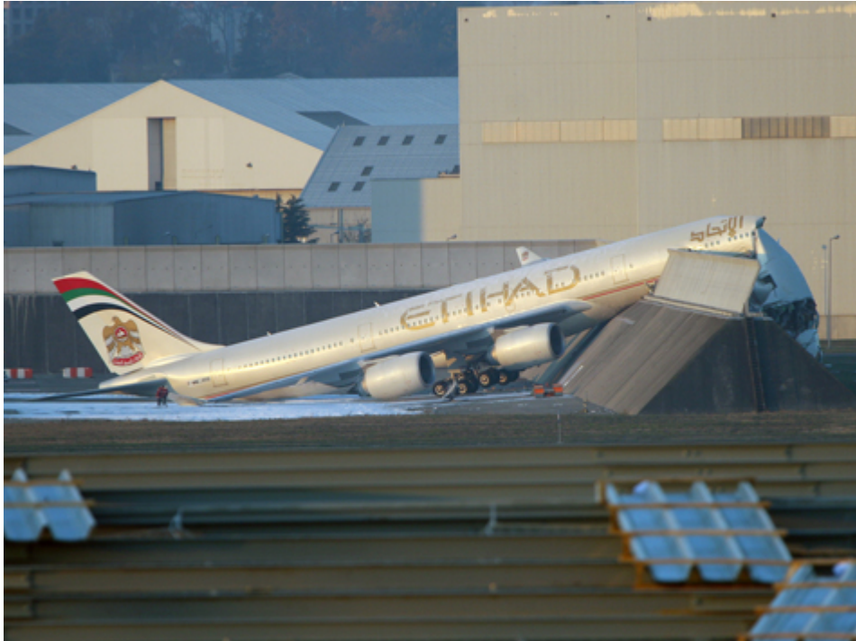
Kuva 3.6. Etihad Airwaysin Airbus A340 -tyyppisen matkustajakoneen jarrut vapautuivat koekäytössä, ja kone törmäsi koekäyttöpaikkaa ympäröivään valliin. /23/

Yleisiä koekäyttötoiminnassa esiintyviä ongelmakohtia ovat myös imuvaara-alueiden puhtaudesta huolehtiminen sekä inhimilliset huolimattomuudet esimerkiksi vaara-alueilla liikkumisessa.