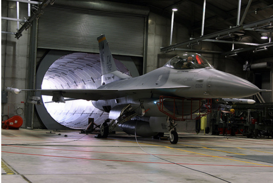
Kuva 3.1. F-16 -lentokoneen koekäyttö. /28/

rakennusteknisesti estetty. Koekäyttötaloissa koekäytetään pääasiassa hävittäjäkalustoa. Kuvassa 3.1 näkyy Hollannin ilmavoimien F-16 -hävittäjälentokoneen koekäyttö koekäyttötalossa, jonka poistoputki alkaa heti koneen takaa. /9/