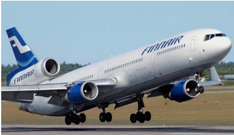
Kuva 3.5. MD-11 -matkustajakoneen takavaara-alueen pituus on yli 270 m. /25/

Tämän päivän matkustajakoneet eivät tarvitse koekäyttöjä varten mitään ulkopuolisia laitteita tai maasähköä, vaan koekäytöt ohjelmoidaan koneen omilla tietokoneilla. Kaikkien matkustajakonetyyppien sellaiset koekäytöt, jotka vaativat maatyhjäkäyntiä suurempaa tehoa, suoritetaan koekäyttöpaikoilla. /2/