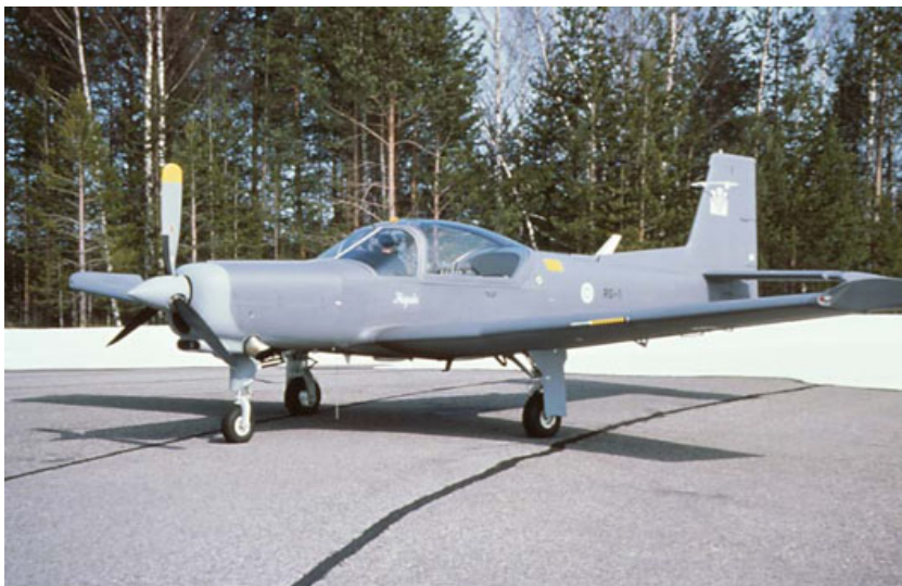
Kuva 2.6. Suomalaisvalmisteinen Redigo yhteyslentokone. /1/

Redigo on suomalaisvalmisteinen yksimoottorinen potkuriturbiinikone. Ilmavoimat käyttää yhdeksää Valmetin rakentamaa konettaan yhteyslentotoiminnassa. Alun perin Redigosta tosin kaavailtiin alkeiskoulukonetta Vinkan seuraajaksi, mutta suunnitelmista luovuttiin. Yhtenä syynä tähän olivat vaikeudet prototyyppien koelentoilla, minkä takia koneiden menekki ulkomaillekaan ei ollut toivottua. Ilmavoimien palveluskäytössä nämä nelipaikkaiset pienkoneet ovat olleet vuodesta 1992. Redigo on esitetty kuvassa 2.6. /1/