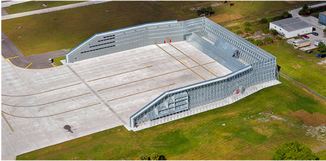
Kuva 3.4. GRE-tyyppinen lentokoneiden koekäyttöpaikka. /26/