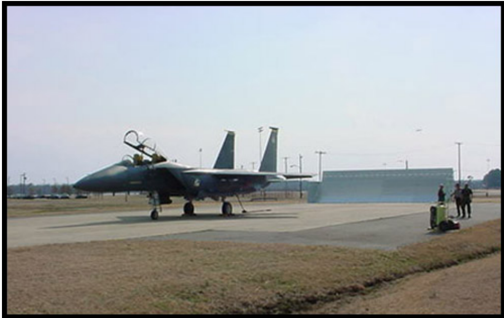
Kuva 3.3. Hävittäjälentokone koekäytössä suihkuvirtausaidalla varustetulla koekäyttöpaikalla. /27/