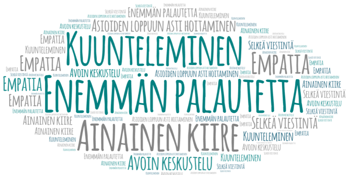
Kuva 3. Sanapilvi: kehitysehdotuksia esihenkilölle

Haastateltavat eivät osanneet kertoa, onko esihenkilö tehnyt toimenpiteitä seksuaalista häirintää ennaltaehkäistäkseen. Tätä kuitenkin pidettiin tärkeänä asiana esihenkilön toiminnassa. Esihenkilöltä toivottiin selkeää rajojen asettamista siitä, mikä on hyväksyttävää, sekä esimerkkiä siitä, miten tilanteisiin tulisi puuttua. Esihenkilön aktiivinen puuttuminen epäasialliseen käytökseen lisää luottamusta ja tukee turvallisuuden tunnetta työpaikalla. Tämä on erityisen tärkeää ilmapiirin kannalta, sillä johdonmukainen puuttuminen viestii selkeästi siitä, mitä organisaatiossa pidetään hyväksyttävänä ja mitä ei. Kuvassa 3 esitellään sanapilven muodossa esihenkilöille annettuja kehitysehdotuksia.