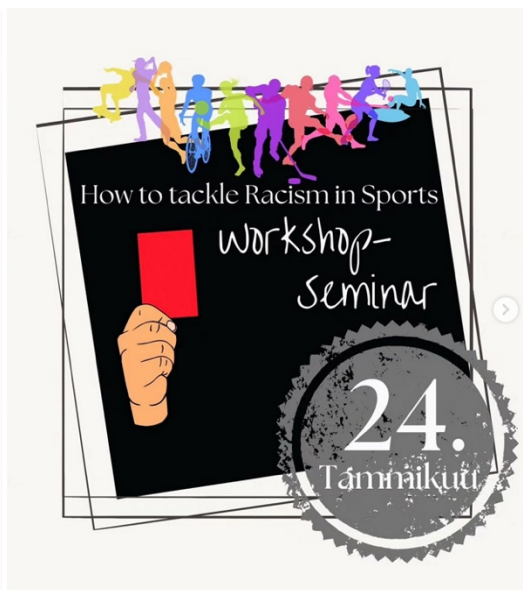
Kuva 3. Kuvakaappaukset Instagramista (punainenristi 2020; rasmus_ry 2024).

Muista erottuva käsikuvitus on Planin kuva (kuva 1), jossa on neljä eriväristä ja eri asennossa olevaa kättä. Yksi näyttää voitonmerkkiä, yksi peukkua, yksi on nyrkissä ja yksi avonainen. Kädet eivät kommunikoi keskenään ja ne kuuluvat selvästi eri ihmisille. Kuvituksessa on ehkäpä haluttu viestiä vain ihmisten erilaisuudesta värien ja käsimerkkien kautta.