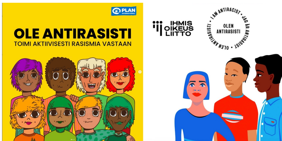
Kuva 4. Kuvakaappaukset Instagramista (plansuomi 2024; ihmisoikeusliitto 2022).

Myös Ihmisoikeusliiton kuvituksessa (kuva 4) voi nähdä pieniä hymyjä osalla hahmoista, tai vähintäänkin tynen rauhallisen ilmeen. Kaikki ihmishahmot ovat näissä kahdessa kuvituksessa keskenään erinäköisiä ja erivärisiä.