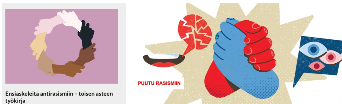
Kuva 2. Kuvakaappaukset verkkosivuilta (rauhankasvatus.fi n.d.; punainenristi.fi 2024).

Yhteen puristuneita käsiä on kuvattu kahdessa kuvituksessa, Rauhankasvatusinstituutin ja SPR:n (kuva 2). Rauhankasvatusinstituutin kuvituksessa on seitsemän eriväristä kättä, jotka pitelevät toisiaan ranteista kiinni muodostaen näin ympyrän. Käsien liittyminen yhteen tuo mieleen yhteistyön eri ihmisten välillä ja ajatuksen siitä, että antirasistisessa työssä ihmiset tukevat toinen toisiaan. SPR:n kuvassa puolestaan on kaksi toisiaan puristavaa kättä, joista toinen on sininen ja toinen punainen. Kädet ovat kuvituksen keskipisteenä, mutta niiden lisäksi kuvassa on myös muita kehonosia eli avonainen suu, josta tulee säröilevä puhekupla ja toinen puhekupla, jossa on kolme silmää.