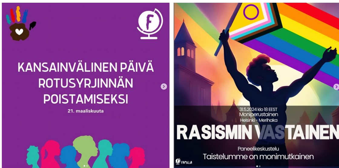
Kuva 5. Kuvakaappaukset Instagramista (familia_ry 2024).

Ihmisiä kuvaavista kuvituksista joukosta erottuu etenkin Amnesty'n kuvitus (kuva 6), jossa on harmaita, tikku-ukkomaisia ihmishahmoja. Hahmot näyttävät rypistetyistä paperista leikatuilta, ja ne ovat muuten samanlaisia yhtä eriväristä hahmoa lukuun ottamatta. Kuvitus liittyy kuvan tekstin mukaan rakenteelliseen rasismiin. Punaisen hahmon voi siis ajatella symboloivan vähemmistön edustajaa, joka kohtaa rakenteellista rasismia muiden ihmisten joukossa.