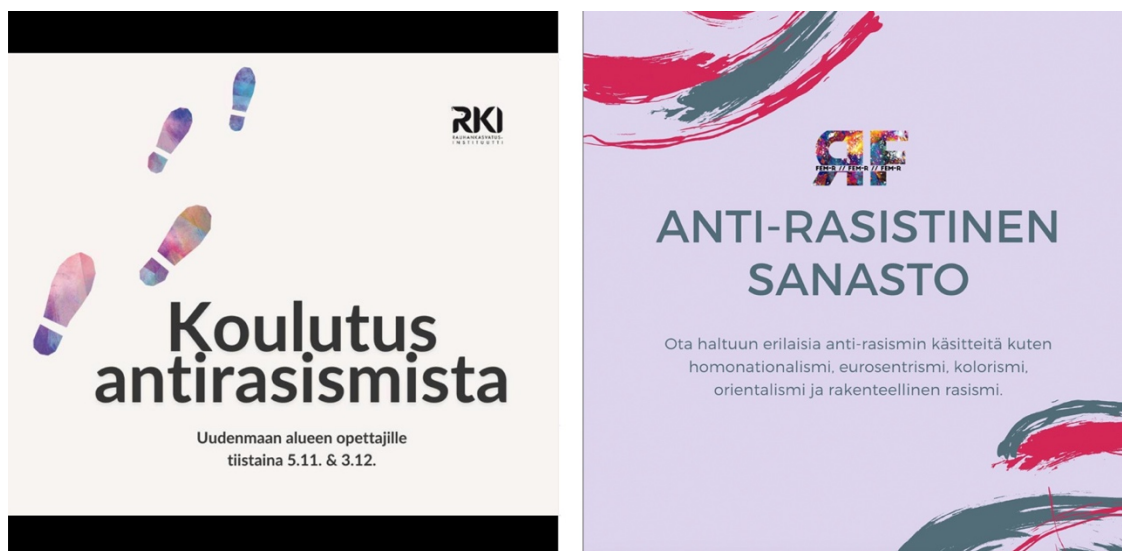
Kuva 9. Kuvakaappaukset Instagramista (rauhankasvatus 2024; rfeministit 2020).

Abstraktein kuvituksista on Fem-R:n kuvitus (kuva 9), jossa kuvan keskellä olevaa tekstiä reunustaa kulmissa harmahtavat ja punaiset, siveltimenvetoja muistuttavat viivat. Yksinkertaisella abstraktilla kuvituksella saadaan katse kiinnittymään tekstiin, joka on kuvassa selkeästi pääosassa.