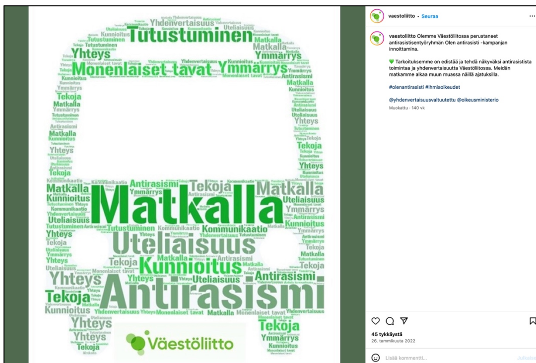
Kuva 8. Kuvakaappaus Instagramista (vaestoliitto 2022).

Väestöliiton kuvitus symboloi selvästi sanoihin liittyvää matkaa, ja kuvan yhteydessä oleva tekstikin vahvistaa tämän. Kuvitus liittyy järjestön matkaan kohti antirasistista toimintaa työryhmän perustamisen myötä.