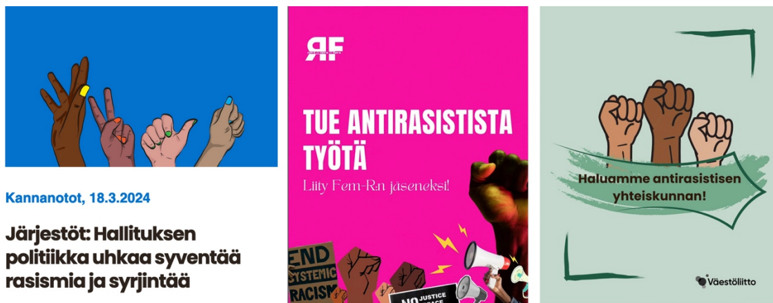
Kuva 1. Kuvakaappaukset verkkosivuilta ja Instagramista (plan.fi 2024; rfeministit 2024; vaestoliitto 2023).

Yhteen puristuneita käsiä on kuvattu kahdessa kuvituksessa, Rauhankasvatusinstituutin ja SPR:n (kuva 2). Rauhankasvatusinstituutin kuvituksessa on seitsemän eriväristä kättä, jotka pitelevät toisiaan ranteista kiinni muodostaen näin ympyrän. Käsien liittyminen yhteen tuo mieleen yhteistyön eri ihmisten välillä ja ajatuksen siitä, että antirasistisessa työssä ihmiset tukevat toinen toisiaan. SPR:n kuvassa puolestaan on kaksi toisiaan puristavaa kättä, joista toinen on sininen ja toinen punainen. Kädet ovat kuvituksen keskipisteenä, mutta niiden lisäksi kuvassa on myös muita kehonosia eli avonainen suu, josta tulee säröilevä puhekupla ja toinen puhekupla, jossa on kolme silmää.