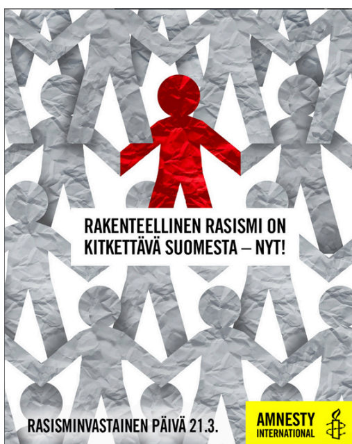
Kuva 6. Kuvakaappaus Instagramista (amnestyfinland 2023).

Ihmisiä kuvaavista kuvituksista joukosta erottuu etenkin Amnesty'n kuvitus (kuva 6), jossa on harmaita, tikku-ukkomaisia ihmishahmoja. Hahmot näyttävät rypistetyistä paperista leikatuilta, ja ne ovat muuten samanlaisia yhtä eriväristä hahmoa lukuun ottamatta. Kuvitus liittyy kuvan tekstin mukaan rakenteelliseen rasismiin. Punaisen hahmon voi siis ajatella symboloivan vähemmistön edustajaa, joka kohtaa rakenteellista rasismia muiden ihmisten joukossa.