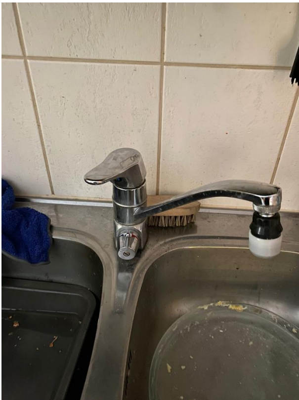
Kuva 5. Kohteen keittiöhana. (Heinimäki, 2024)