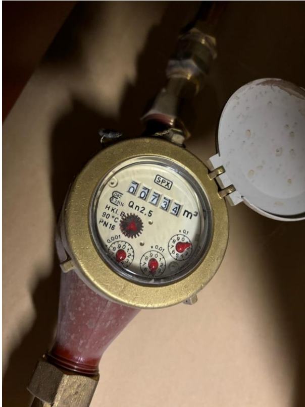
Kuva 8. Kohteen lämpimänveden vesimittari. (Heinimäki, 2024)

Vesimittari näytti lämpimänveden määräksi 734 m 3 , joten jaetaan kyseinen määrä 24 mistä saadaan vuodessa käytetty lämpimän veden määrä.