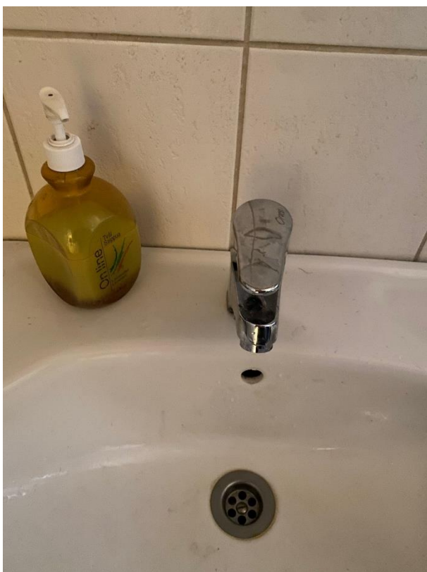
Kuva 1. Kohteen pesuallashana. (Heinimäki, 2024)

Kohteen kaikki hanat sekä muut vesikalusteet ovat alkuperäisiä vuonna 2000 asennettuja. Poikkeuksena kuvassa 3 nähtävä suihku on uusittu vuonna 2020.