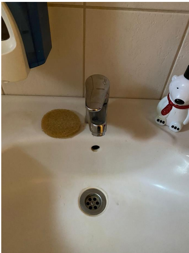
Kuva 2. Kohteen pesuallashan, jossa käsisuihku. (Heinimäki, 2024)