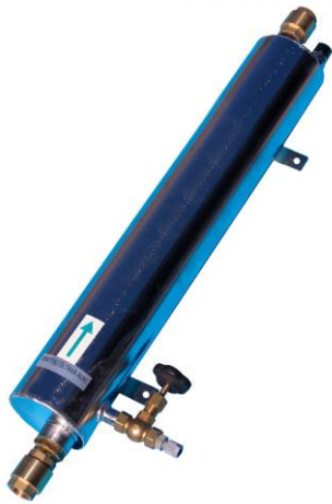
Kuva 10. Aqua-hapetin kaivoveden ilmastamiseen (Water 4 you n.d.)

Rikkivedyn poistamiseksi käyttövedestä voidaan suositella kaivoon asennettavaa vedenhapetinta. Alla kuvassa 8 on Water 4 you -nimisen yrityksen rikkivedyn poistoon kehitetty hapetin. Kyseisen hapettimen hinta on tällä hetkellä 775 €. Hintaan ei sisälly asennus.