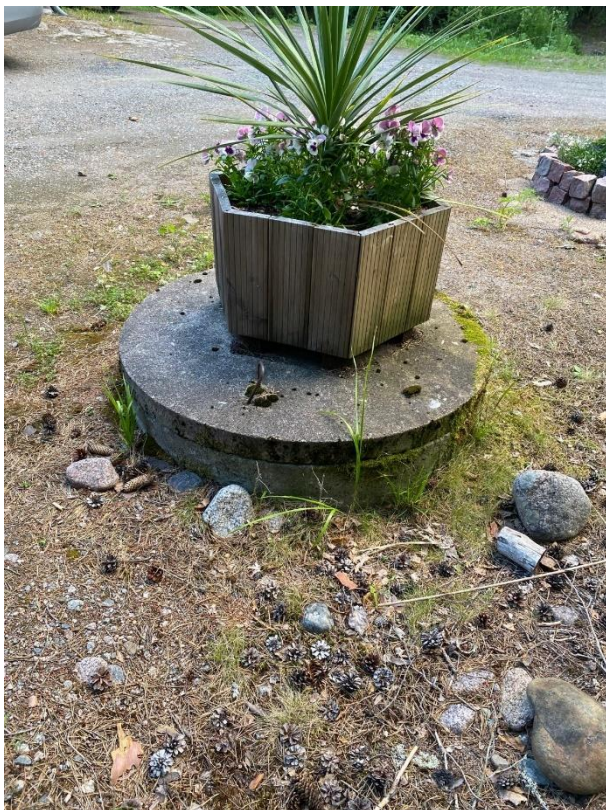
Kuva 6. Kohteen vesikaivo. (Heinimäki 2024)