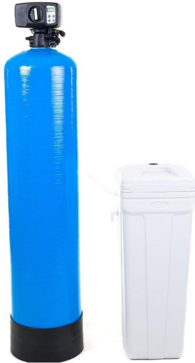
Kuva 11. KANKDF-44A-vedensuodatin (Jalovesi Oy. n.d.)

Vesikalusteiden virtauksien osalta voidaan suositella hanojen sekä vanhemman suihkusekoittajan vaihtoa jo pelkästään niiden käyttöiän perusteella, hanoissa käyttöikä on 15–20 vuotta, ja 2000-luvulla rakennetun omakotitalon vesikalusteet alkavat olla jo käyttöikänsä lopussa. Suihkusekoittajassa käyttöikä on 15 vuotta, joten alkuperäinen suihkusekoittajan käyttöikä on ylitetty 9 vuodelle. Hanojen virtauksiin voidaan saada myös vaihtotoimenpiteillä parannusta virtaamien osalta. Vesikalusteiden vaihto parantaa myös omakotitalon energiatehokkuutta, joten näiltä osin voidaan suositella toimenpidettä.