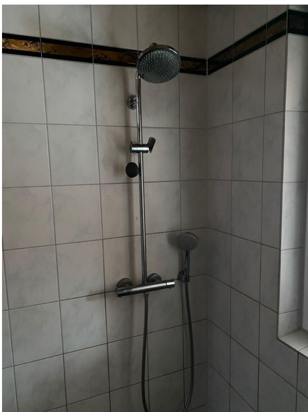
Kuva 3. Kohteen suihkukhana. (Heinimäki, 2024)