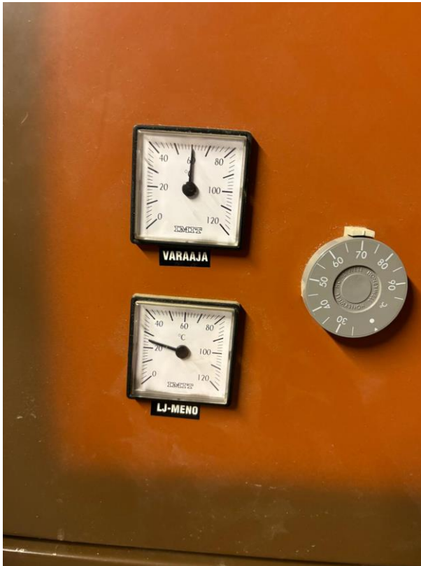
Kuva 9. Varaajan lämpötilat. (Heinimäki, 2024)

Käyttövesikaivo vaikutti silmämääräisesti moitteettomalta. Kaivon kansi oli tukevasti kaivon päällä, ja kaivoa ympäröivä maa-aines vietti pääasiassa pois-päin. Näin on voitu varmistaa, ettei sade- eikä sulamisvedet pääse vahingoittamaan käyttövettä.