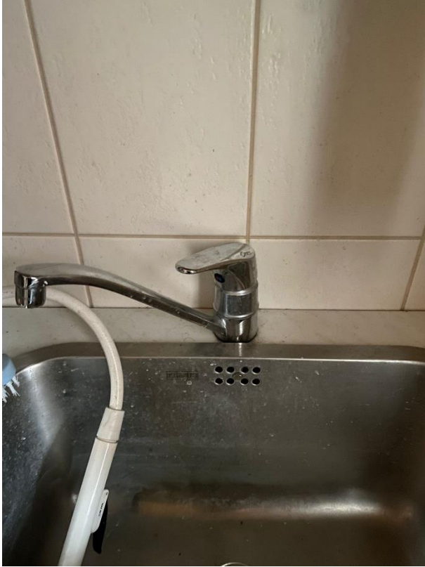
Kuva 4. Kohteen kodinhoitohuoneessa sijaitseva keittiöhana. (Heinimäki, 2024)