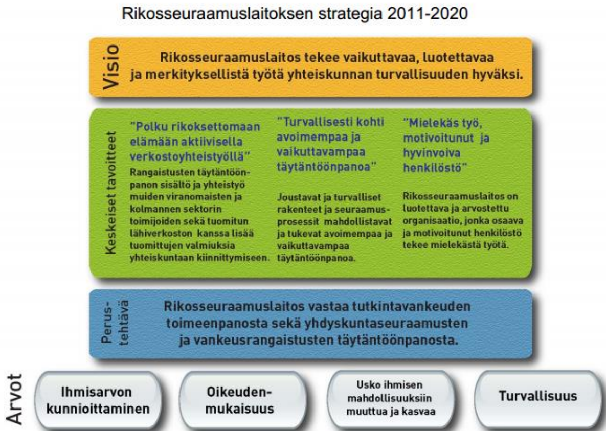
KUVIO 2. Rikosseuraamuslaitoksen toimintastrategia ja arvot (Rikosseuraamuslaitos 2013c.)

Organisaationa Rikosseuraamuslaitos on hyvin laaja, sillä toimijoita on paljon ja lähes joka puolella Suomea. Keskeisten toimijoiden, rikosseuraamusalueitten lisäksi organisaatioon kuuluu keskushallinto (RISE KEHA) yksikköineen, terveydenhuoltoyksikkö (RTHY), oma rikosseuraamusalan koulutuskeskus (RSKK) sekä sisäinen tarkastus. Itse rikosseuraamusalueita on kolme: Etelä-Suomen rikosseuraamusalue (ESRA), Länsi-Suomen rikosseuraamusalue (LSRA) sekä Itä- ja Pohjois-Suomen rikosseuraamusalue (IPRA). Rikosseuraamusalue sisältää aluekeskuksen (Alke), arviointikeskuksen (Arke), vankiloita ja yhdyskuntaseuraamustoimistoja (yksitoimisto). Lisäksi tämä alue sisältää rikosseuraamuskeskuksia (Rike), joiden alaisuudessa toimii vankiloita ja yhdyskuntaseuraamustoimistoja. (Rikosseuraamuslaitos 2013a; Rikosseuraamuslaitos 2013b.)