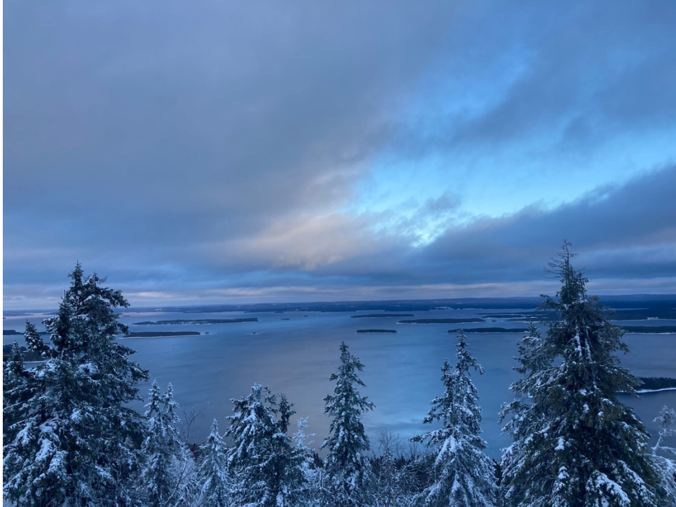
Kuva 1. Kansallismaiset Ukko-Kolin huipulta.