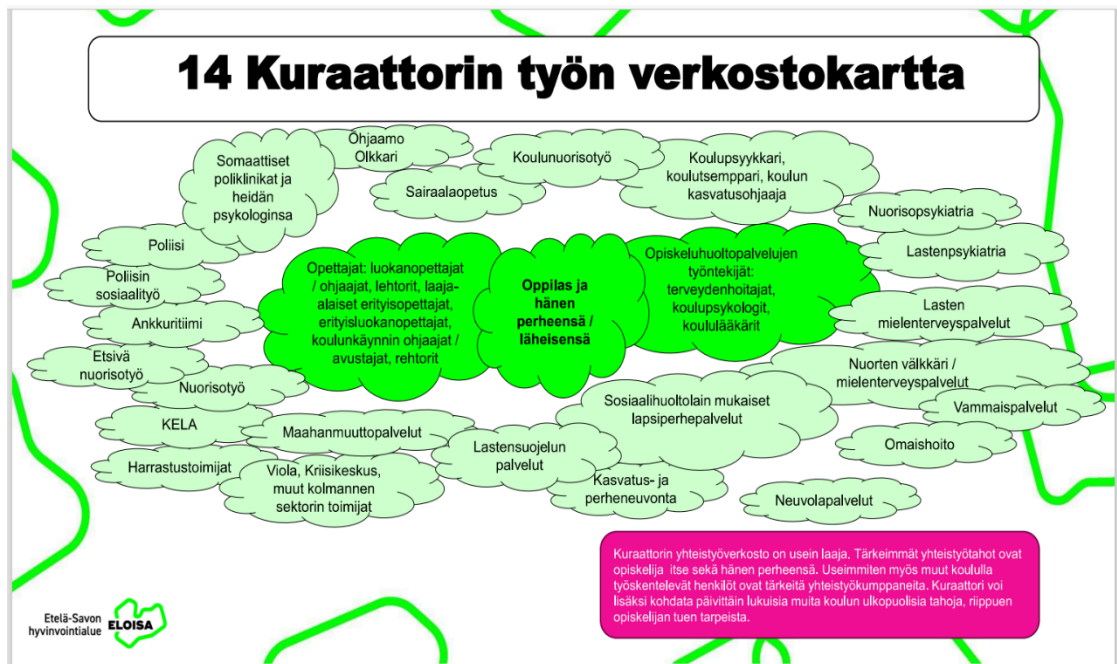
Kuva 1. Kuraattorin työn verkostokartta (Eloisa 2023)

Kuraattorin yksilökohtaiseen työhön kuuluu sekä oppilaan tilanteeseen tarvittavan yhteistyöverkoston kokoaminen, että jo olemassa olevien verkostojen kanssa toimiminen (Eloisa 2023).