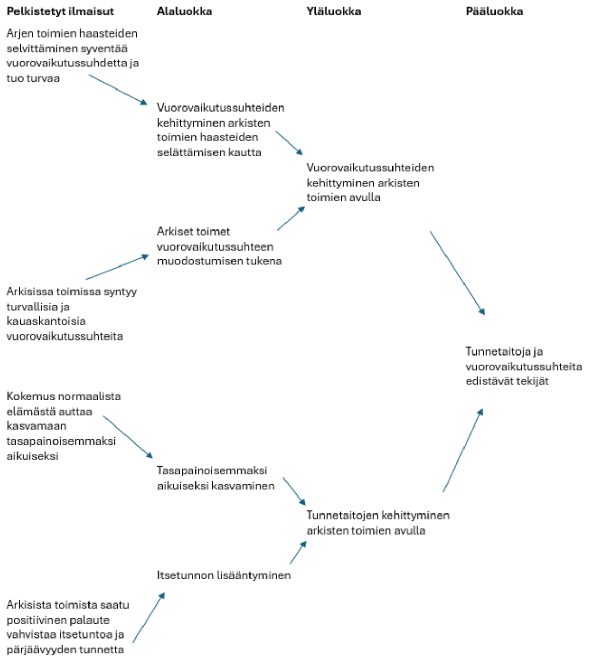
Kuvio 2: Ote sisällönanalyysitaulukosta