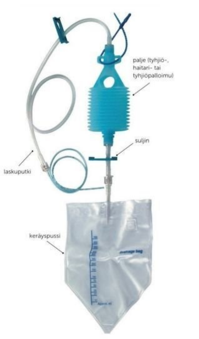
KUVA 1. Alipainehaavaimujärjestelmä (Aura & Kinnunen, 2022, s. 210).

Tutkimustuloksissa on selvinnyt, että dreenin käytön hyöty ja tarpeellisuus vaihtelevat huomattavasti potilaan kokonaisvaltaisen voinnin ja tehdyn toimenpiteen laajuuden mukaan. Lisäksi tutkimuksessa havaittiin, että suurin osa 48 tunnin jälkeen kertyvästä eritteestä ei johtuisikaan leikkauksesta vaan itse haavadreenistä. Tämä tieto viittaa siihen, että haavadreeni voitaisiin useammassa tapauksissa poistaa turvallisesti kahden vuorokauden kuluttua, sillä kertyvä erite ei ole haavasta peräisin. (Panda., ym., 2015).