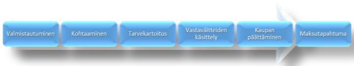
Kuvio 1. Työn eteneminen myyntiprosessin mukaisesti

Joidenkin prosessien, kuten Alasen ym. (2005, 73) myyntiprosessin alussa mainitaan usein myös valmistautumisvaihe ja loppuun sijoittuu vielä lisämyynnin vaihe. Tässä työssä päätin käsitellä edellä listatun viiden vaiheen lisäksi myös valmistautumisvaihetta, vaikka se usein jätetäänkin pois kuluttajapuolen myyntiprosesseista, kuten Rubanovitschin ja Aallon (2005, 37) myynnin ympyrästä. Käsitellen lisämyyntiä myyntiprosessin vaiheiden kautta ja mielestäni lisämyyntiin pystytään valmistautumaan jo valmistautumisvaiheessa. Seuraavaksi työssäni etenen kuvion mukaisten vaiheiden kautta: