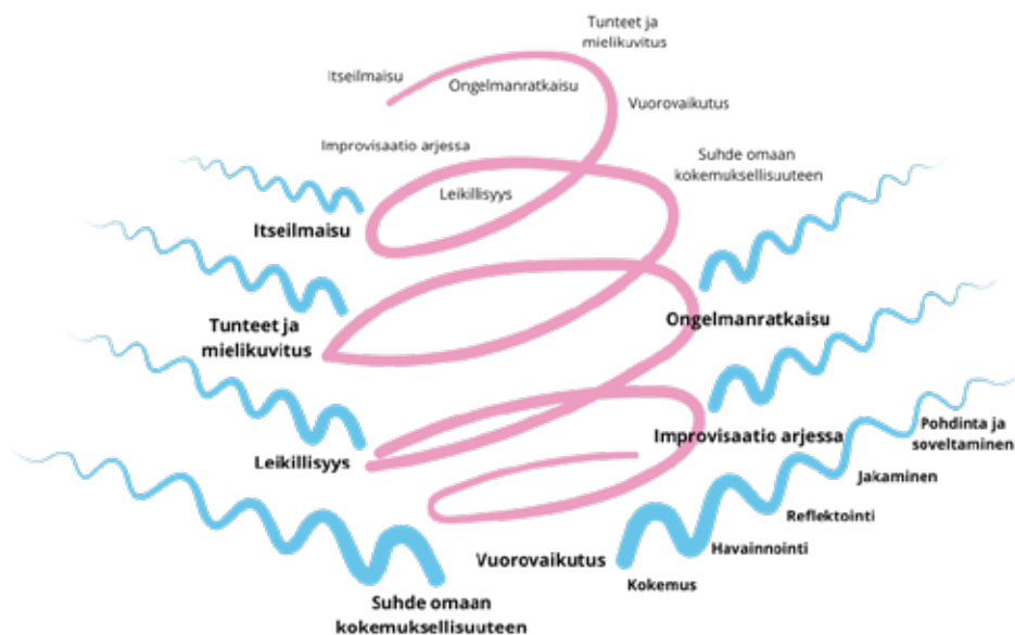
Kuvio 3. Luova kierre luovuusosaamisen kertymisessä ja kehittämisessä (Oona Tikkaaja 2024).