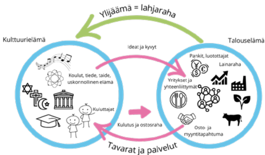
Kuvio 1. Sivistys luo vaurautta ja varaus sivistystä (Johannes Kananen 2024).

kulttuurielämän aluetta. Kestävän yhteiskunnan talusmallin mukaan toimivassa tulevaisuuden yhteiskunnassa kasvatuksella, koulutuksella ja sivistyksellä tavoitellaan inhimillistä kasvua, tunnistetaan arvokkaita tarkoituksia omalle elämälle sekä luodaan hyvinvointia luottamusta ja sosiaalista pääomaa kasvattamalla. (Kananen ym. 2024.)