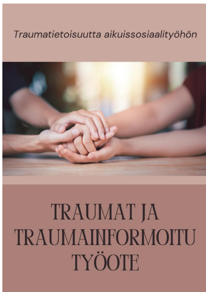
Kuva 2. Oppaan kansilehti.

Oppaassa perehdytään traumojen ja traumainformoidun työotteen teoreettiseen viitekehykseen rajatusti ja jäsennellysti. Opas avaa trauman käsitettä sekä trauman ilmenemis- ja näyttäytymismuotoja. Lisäksi se perehdyttää traumainformoidun työotteen periaatteisiin, traumatietoisuuteen asiakastyössä ja traumainformoidun organisaation kehittymisen vaiheisiin. Opas sisältää asiantuntijan hyvinvoinnin muistilistan sekä asiakkaan toipumisen edistämisessä huomioitavia asioita. Lisäksi oppaaseen on tuotu muutama työväline käytettäväksi asiakastyössä hyvinvoinnin ja toipumisen näkökulma huomioiden. Oppaan vinkkejä ja linkkejä -osion avulla on mahdollista tutustua aihetta käsitteleviin teoksiin sekä lisätä tietoa ja ymmärrystä syventäviin lisämateriaaleihin tutustumalla verkkolinkkien kautta. Lisäksi oppaaseen on koottu neljä esimerkkiharjoitusta, jotka voivat toimia niin työntekijän kuin asiakkaan palauttavina harjoitteina ja vireystilaa vakauttavina toimintoina.