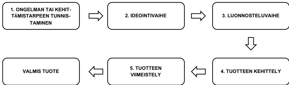
Kuva 5. Tuotekehitysprosessi (Jämsä & Manninen 2000, 28)

Siirtyminen vaiheesta toiseen ei vaadi, että edellinen vaihe on loppunut esimerkiksi asiakkaaseen yhteyden ottaminen tuotteen luonnosteluvaiheessa voi täsmentää kehittämistarvetta (Jämsä & Manninen 2000, 28). Seuraavissa alaluissa käymme tarkemmin tuotekehityksen eri vaiheita.