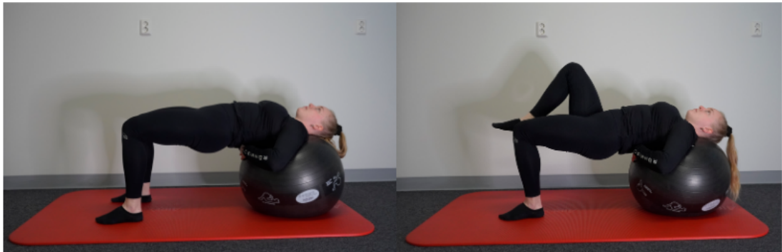
Kuva 3. Palloharjoite 2 (Hakkarainen & Ristolainen 2024)

Toisessa liikkeessä (kuva 3) hartiat asetetaan pallon päälle ja jalat lattialle polvet 90 asteen kulmaan, lantio pidetään ilmassa ja nostetaan jalkoja vuorotellen ilmaan (Kahle & Gribble 2009).