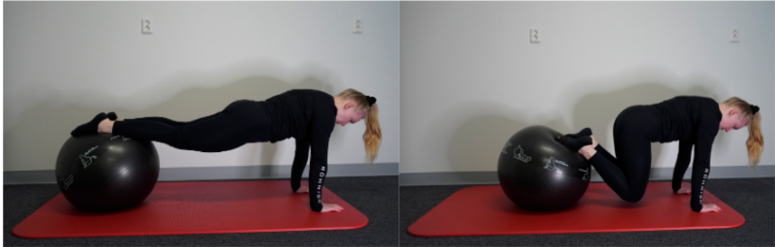
Kuva 2. Palloharjoite 1 (Hakkarainen & Ristolainen 2024)

Toisessa liikkeessä (kuva 3) hartiat asetetaan pallon päälle ja jalat lattialle polvet 90 asteen kulmaan, lantio pidetään ilmassa ja nostetaan jalkoja vuorotellen ilmaan (Kahle & Gribble 2009).