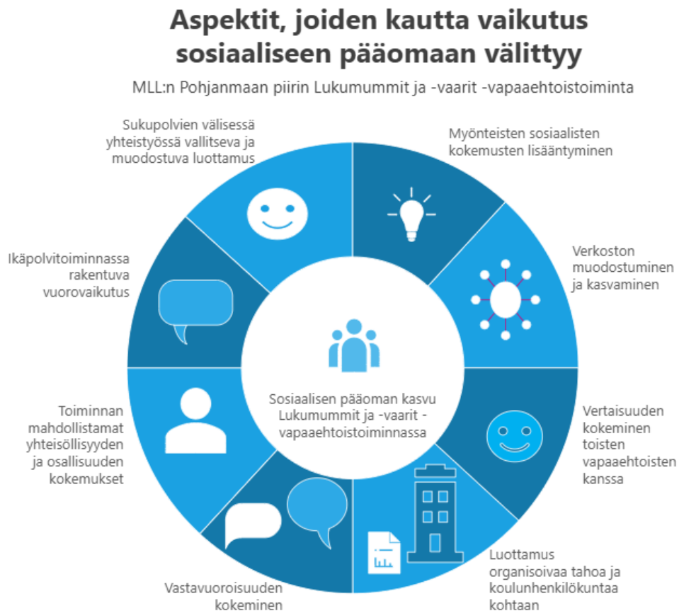
Kuvio 2. Sosiaalisen pääoman kannalta Lukumummit ja -vaarit -vapaaehtoistoiminnan merkittävät aspektit.

sosiaalisen pääoman muodostumisen kannalta, mutta eri vapaaehtoisten kohdalla eri osiot painottuvat enemmän tai vähemmän.