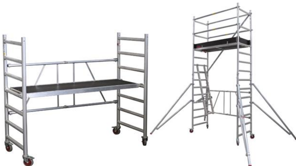
Kuva 15. Rakennustelineet (Tikli 2014.)

Rakennustyömaalla nojatikkaiden käyttäminen työalustana on kielletty. Nojatikkaita voidaan käyttää vain tilapäisenä kulkutienä, nostoapuvälineiden kiinnittämisessä ja irrottamisessa sekä muihin lyhytaikaisiin, kertaluontoisiin töihin. Tikkaita käyttäessä työnantajan tulee arvioida tikkaiden käytöstä mahdollisesti aiheutuvat vaarat ja vaarojen merkitys työntekijälle. Nojatikkaita käytettäessä on noudatettava erityistä varovaisuutta, huomioitava alustan liukumattomuus sekä asetettava tikkaat oikeaan kaltevuuteen, joka on 70–75°. Myös tavaroiden kuljettaminen nojatikkailla on kielletty. (Hietavirta ym. 2011, 101.)