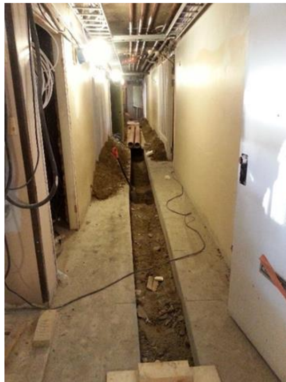
KUVA 9. Lattiakaivanto.

Peruskorjaustyömailla esiintyy useasti myös terveydelle vaarallisia aineita. Tällaisia aineita ovat mm. asbesti, kreosootti, PCB ja lyijy. Lisäksi purkutöissä syntyy yleensä terveydelle haitallista pölyä, joita ovat kvartsi-, sementti-, kalkki-, mineraalivilla- ja puupöly. (Hietavirta ym. 2011, 128.)