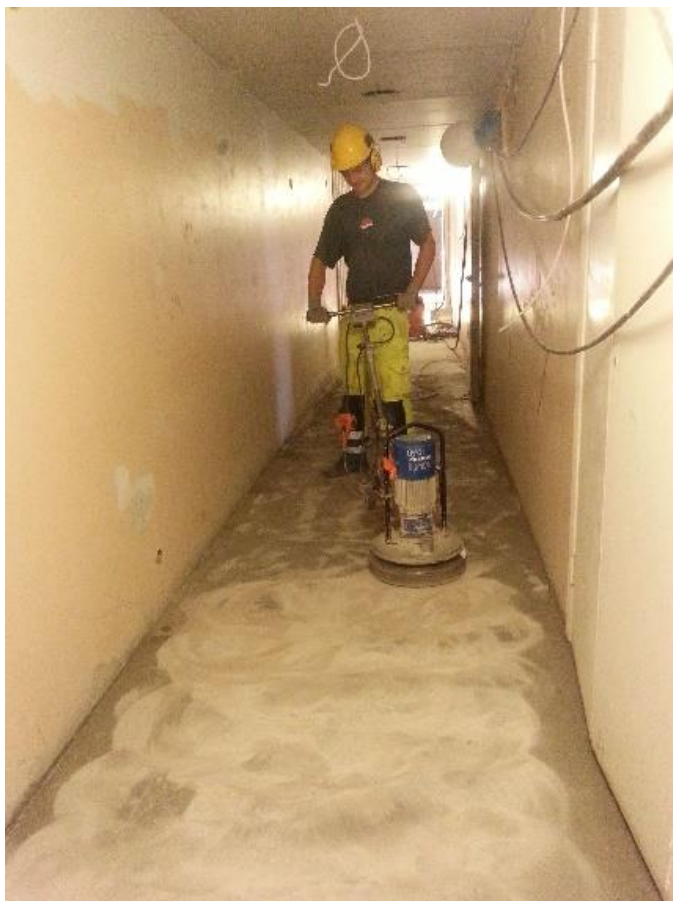
KUVA 13. Lattian hiontatyö

Rakennustyömailla käytetään paljon erilaisia koneita, laitteita ja työvälineitä. Tyypillisiä koneita, laitteita ja työvälineistä LVIS -peruskorjaustyömaalla ovat kirvesmiesten käyttämät työvälineet, kuten naulaimet, sahat, sirkkelit ja vasarat. Työmaan purkuvaiheessa purku-urakoitsijat käyttävät timanttisahoja ja – poria ja erikokoisia piikkauskoneita.