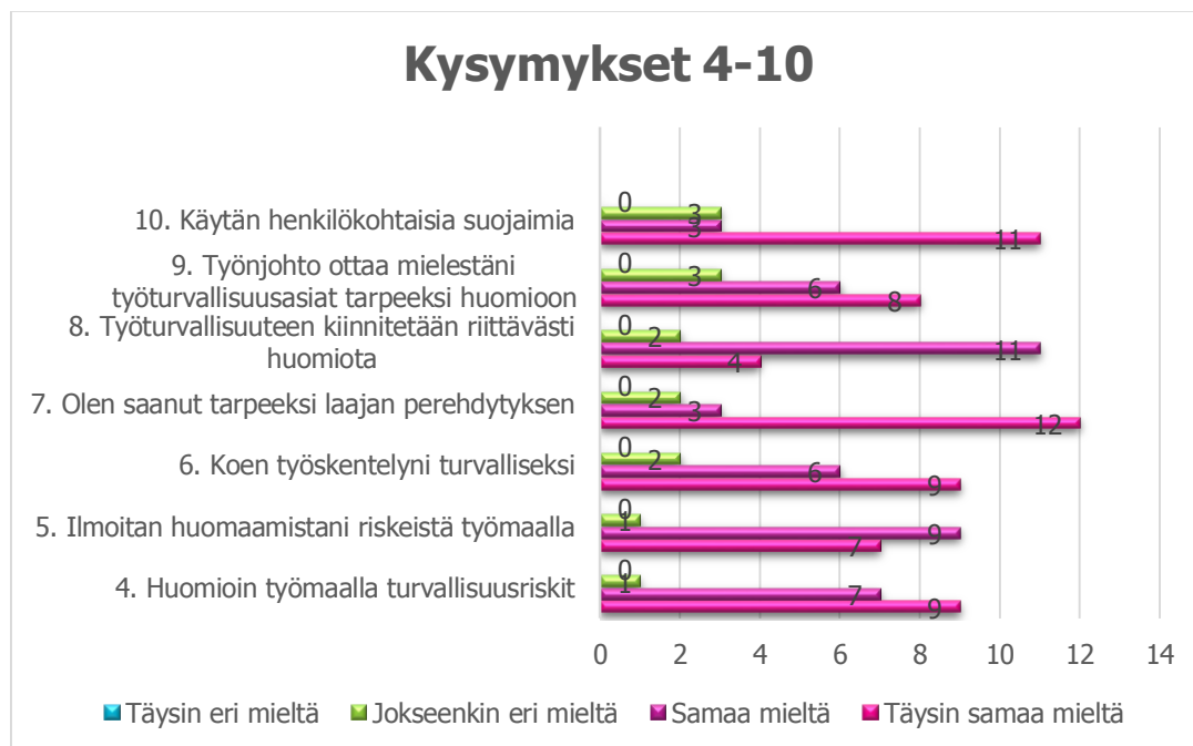
KUVIO 2. Kysymykset 4-10, vastaajien huomiot työturvallisuudesta

Yhdeksäs väittäjä koski työnjohtajien asennetta työturvallisuutta kohtaan. Kysymyksessä kysyttiin, ottavatko työnjohtajat vastaajan mielestä riittävän hyvin työturvallisuusasiat huomioon. Vastaajista kahdeksan oli väittämän kanssa täysin samaa mieltä, kuusi samaa mieltä sekä kolme jokseenkin eri mieltä. Viimeisessä väittämässä kysyttiin, käyttääkö vastaaja henkilökohtaisia suojaimia. Vastaajista suurin osa eli 11 oli täysin samaa mieltä ja kolme vastaajaa oli sekä samaa mieltä, että hieman eri mieltä.