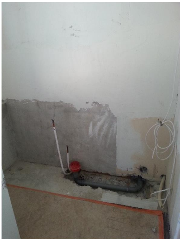
KUVA 6. Purettu keittiö.