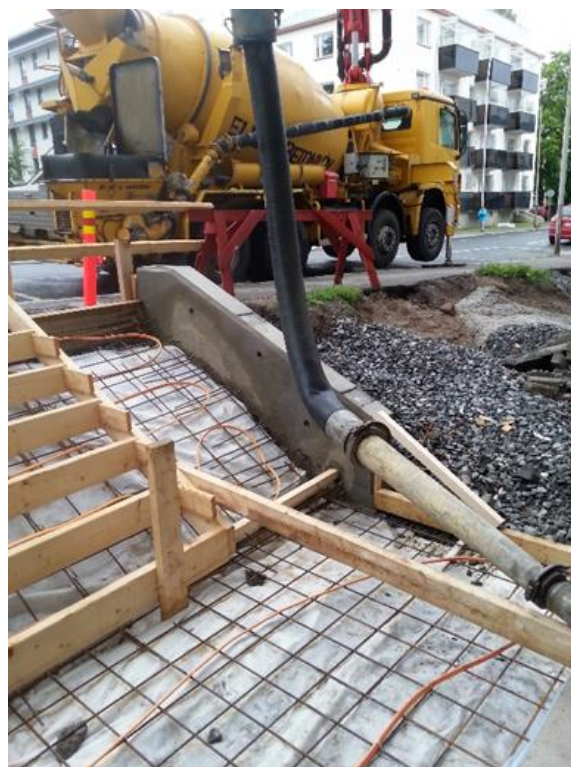
KUVA 10. Kirvesmiehen tekemä uusi alaslaskukatto. KUVA 11. Uuden sisääntulon porrasmuotti.