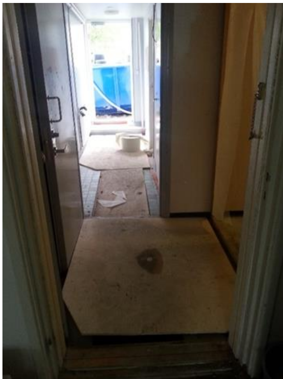
KUVA 8. Lattiakaivannon suojaus