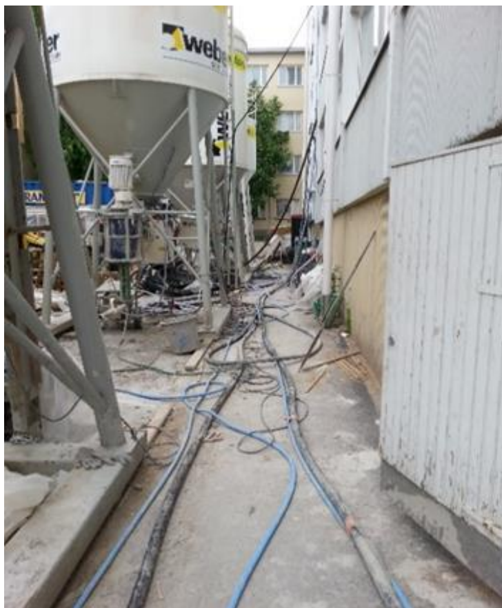
KUVA 3. As Oy Kuninkaankatu 29, sisäpiha LVIS –peruskorjauksen aikana