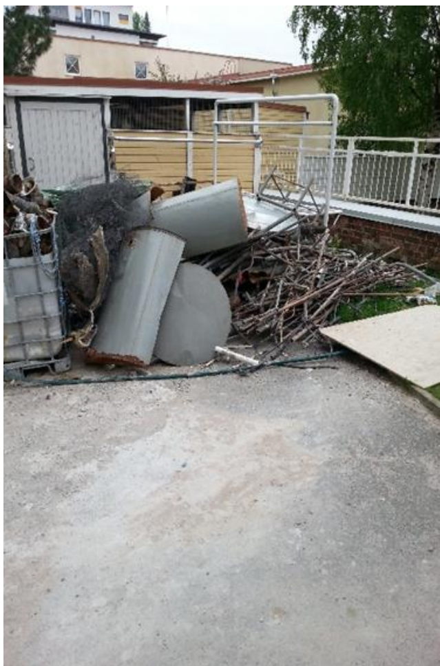
KUVA 5. Työmaan metallijäte, As Oy Kuninkaankatu 29

Konttien tuonnin jälkeen on vuorossa työmaan sähköistyksen tekeminen, jonka kytkennän suorittaa sähkömies. Työmaasähkö tuodaan työmaakonteille ja varastoille työmaakeskukselta. Työmaan sähköistykseen kuuluu myös porraskäytävien ja työmaa-alueen sähköistys. Työmaan sähköistyksestä sekä valaistuksesta on tehtävä tarpeellinen suunnitelma. Suunnitelman laadinnassa on järkevää käyttää apuna sähköalan ammattilaisia. Sähkökeskukset ja kaapelit on sijoitettava turvallisesti ja siten, että niitä on helppo käsitellä. Sähköjohdot ja kaapelit tulee ripustaa esimerkiksi seinille, jotta kulkutiet pysyvät vapaina. Ulkoalueilla olevat ilma-kaapelit olisi sijoitettava siten, ettei niihin kohdistu nostureiden eikä muun työmaaliikenteen rasituksia. Työmaalla on huolehdittava, etteivät sähköjohdot ja koneet joudu kosketuksiin veden kanssa, sillä vesi ja sähkö on vaarallinen yhdistelmä. Sähkökeskukset on varustettu vikavirtasuojaimilla, jotka estävät mahdolliset sähköiskut ja häiriöt, jos kaapeli tai kone vioittuu. Työmaalla rikkinäiset jatkojohdot ja keskukset on poistettava välittömästi käytöstä. (Hieta-virta ym. 2011, 40.) Kuvassa 3 näkyy Kuninkaankatu 29 työmaan sisäpihan kulkutie, jossa on epäjärjestyksessä vaarallisesti tasoitesiiiloilta lähteviä letkuja sekä johtoja. Nämä letkut ja johdot olisi pitänyt sijoittaa kulkutien toiseen reunaan tai kokonaan pois kulkutieltä.