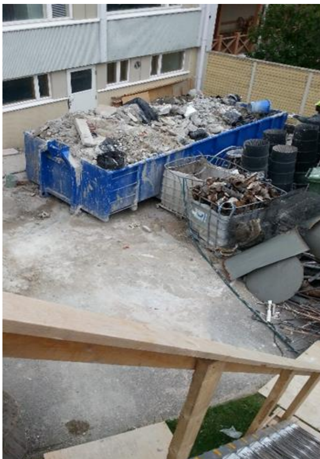
KUVA 4. Työmaan roskalava. As. Oy Kuninkaankatu 29

Työmaata perustaessa on työmaa-alue eristettävä huolellisesti ja alueen ulkopuolelle on lisättävä työmaata koskevat kieltokyltit estämään ulkopuolisten pääsyn työmaa-alueelle. Lisäksi työmaakonteille ja roskalavoille pitää tehdä ennen niiden tuomista työmaalle tukevat ja vakaat alustat. Työmaakontteja voidaan sijoittaa myös päällekkäin, jolloin ahtailla piha-alueilla saadaan säästettyä tilaa. Jos kontteja on päällekkäin, on ylimmälle kontille rakennettava kulkutie joka täyttää työturvallisuusmääräykset. Roskalavat ja muun purkutöistä syntyvän materiaalin varastot on sijoitettava siten, että ne on mahdollista tyhjentää välillä. Aina tämä ei kuitenkaan ole mahdollista, jos tontti on ahdas.