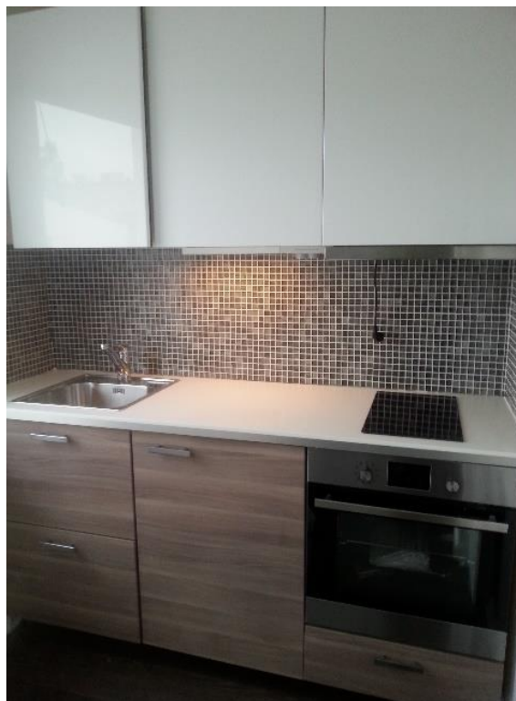
KUVA 7. Uusi keittiö

Purkutyöt aloitetaan yleensä heti, kun työmaa on saatu perustettua. Purkutyöt aloitetaan tyypillisesti kellaritiloista. Kerroksissa purkutyöt kohdistuvat asuntojen kylpyhuoneisiin ja rakenteisiin joissa sijaitsevat vanhat vesiputket, viemärit ja sähköjohdot. Perinteisessä linjasaneerauksessa purkutyön alle joutuu yleensä koko kylpyhuone. Purkutöiden laajuus riippuu käytettävistä menetelmistä. Joissain tapauksissa vanhat viemärit pinnoitetaan ja tällöin rakenteita ei tarvitse purkaa. Tässä opinnäytetyössä purkutöiden käsittely rajoittuu kuitenkin perinteiseen linjasaneeraustyömaahan. Purkutöitä ovat olemassa olevien rakenteiden purku, kuten rakennusosien, pintamateriaalin ja pintakäsittelyn purun sekä aukkojen teot, suojaukset sekä purkujätteen lajittelu ja poistaminen. Purkutyöt voivat sisältää myös kokonaisten rakennuksien tai rakenteiden purkuja. (Rakennusteollisuus RT ry 2006, 90.)