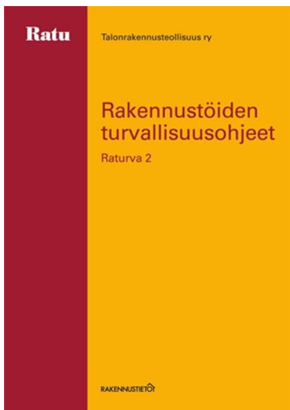
KUVA 2. Rakennustöiden turvallisuusohjeet, Raturva 2 – kirjan kansilehti. (Rakennustieto, 2014.)

Rakennustöiden turvallisuusohjeet –kirja, joka kuuluu Raturva –kansioon, tunnetaan nimellä Raturva 2. Kirjassa on työlajikohtainen turvallisuusohjeisto työhönopastukseen ja koulutukseen. Kirjan sisältö on tarkoitettu työnjohtajille sekä työntekijöille. Kirja sisältää työturvallisuuteen liittyvää tietoa perehdyttämisestä, aliurakoitsijoiden turvallisuussuunnittelusta, henkilösuojaimista, ergonomisesta työskentelystä, ulkomaalaisten työntekijöiden huomioimisesta sekä työnjohtajien ja työntekijöiden velvollisuuksista. Raturva 2 – kirja sisältää myös työlajikohtaisia ohjekortteja, joiden avulla työnjohto ja työntekijät voivat arvioida ja kirjata ylös työhön liittyviä vaaroja. Nämä ohjekortit auttavat myös työntekijöitä huomioimaan ja arvioimaan työhön liittyviä vaaroja. (Rakennusteollisuus ym. 2006, 5.)