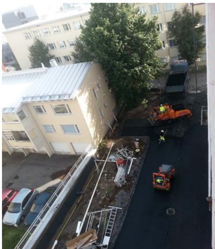
KUVA 12. Pihan asfaltointi, Kuninkaankatu 29

Taloyhtiön peruskorjaushankkeissa, etenkin LVIS -peruskorjauksissa, taloyhtiön pihoihin kohdistuu useimmiten maanrakennustöitä. Tyypillisiä maanrakennustöitä taloyhtiön peruskorjaushankkeessa ovat talon salaojituksen lisääminen tai uusiminen, rakennuksen ympäröivien maamassojen vaihdot, rakennuksen maanalaisten seinien vesieristys, tonttviemärin sekä vesijohtokaivantojen tekeminen.