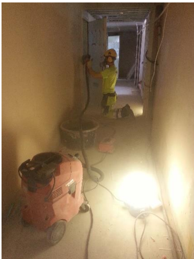
Kuva 14. Seinän hiontatyö

Myös timanttisahauksen ja porauksen lisäksi peruskorjaustyömailla käytetään paljon timanttihiomalaitteistoja. Kuvissa 9 ja 10 on meneillään timanttihiomatyö. Kuvassa 13 käynnissä on lattian hiontatyö. Kuvassa 10 seinän hiontatyö. Seinän hiontatyössä käytössä on käsitimantti -hiomakone, joka on varustettu automaatti-imurilla.