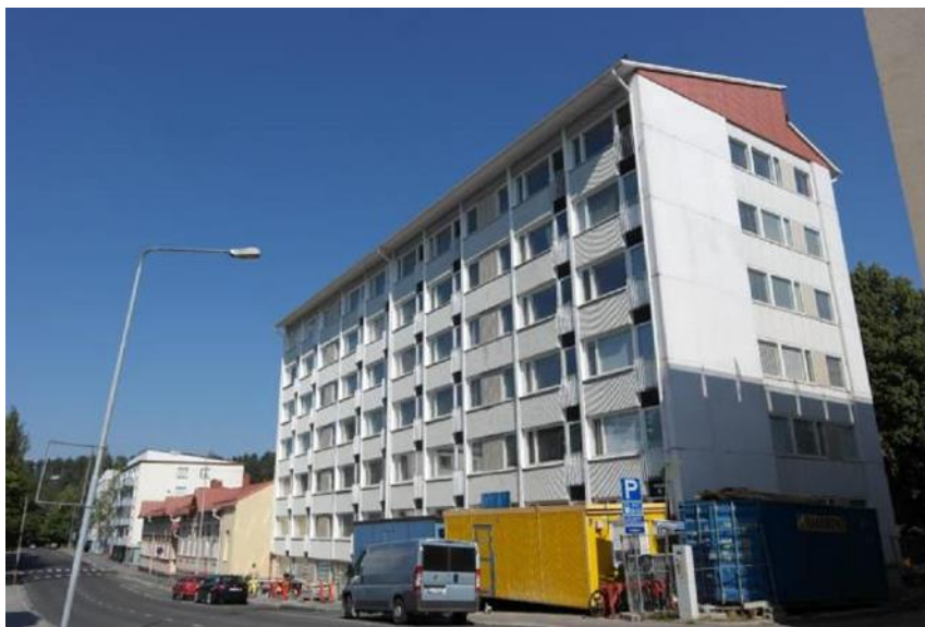
KUVA 1. As Oy Kuninkaankatu 29

As Oy Kuninkaankatu 29 on Kuopion keskustassa sijaitseva, vuonna 1958 rakennettu asuinkerrostalo, jossa on 6 kerrosta kahdessa porraskäytävässä. Asuinkuoneistoja on yhteensä 50 kpl. Kohteen rakennustilavuus on 9 379 m 3 ja huoneistoala 2 249 m 2 . LVIS -peruskorjaus toteutettiin perinteisellä linjasaneerausmenetelmällä. Kohteessa uusittiin mm. käyttövesiputket, kiinteistön sähköistys, viemärit, kylpyhuoneiden vesieristeet, laatoitukset sekä kalusteet. Linjasaneerauksen lisäksi Kuninkaankadulla uusittiin vesikatto ja piharakenteita. Rakennuksen ulkopuolelle lisättiin salaojitus ja sadevesiviemärit ja kaivot uusittiin. As Oy Kuninkaankatu 29:n LVIS -peruskorjaus kesti vuoden 2014 helmikuusta lokakuuhun.