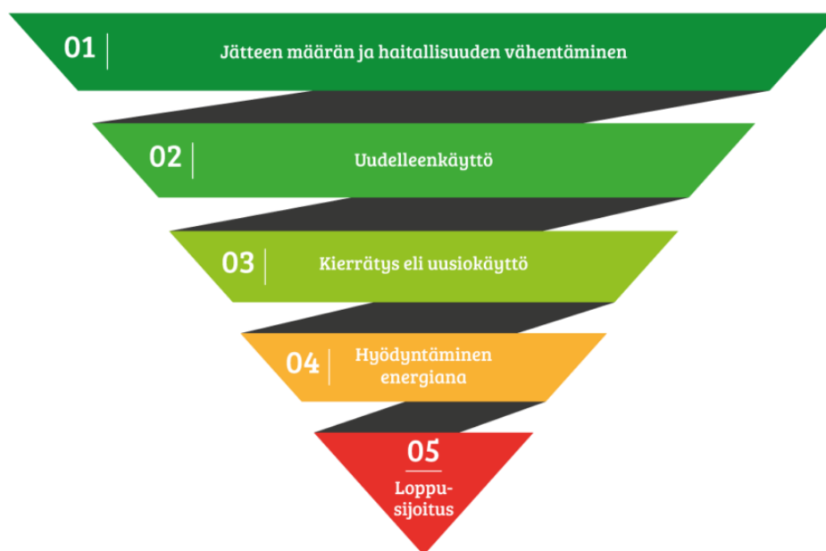
Kuva 1. Jätehierarkia (Lakeuden etappi 2024)

Laki maankäyttö- ja rakennuslain muuttamisesta (958/2012, § 117 c) määrää rakennushankkeeseen ryhtyvää huolehtimaan, että rakennus suunnitellaan ja rakennetaan siten, ettei se aiheuta terveydelle ja turvallisuudelle haittaa. Rakennustyömaa ei saa aiheuttaa haittaa terveydelle tai ympäristölle jätteen puutteellisen käsittelyn takia.