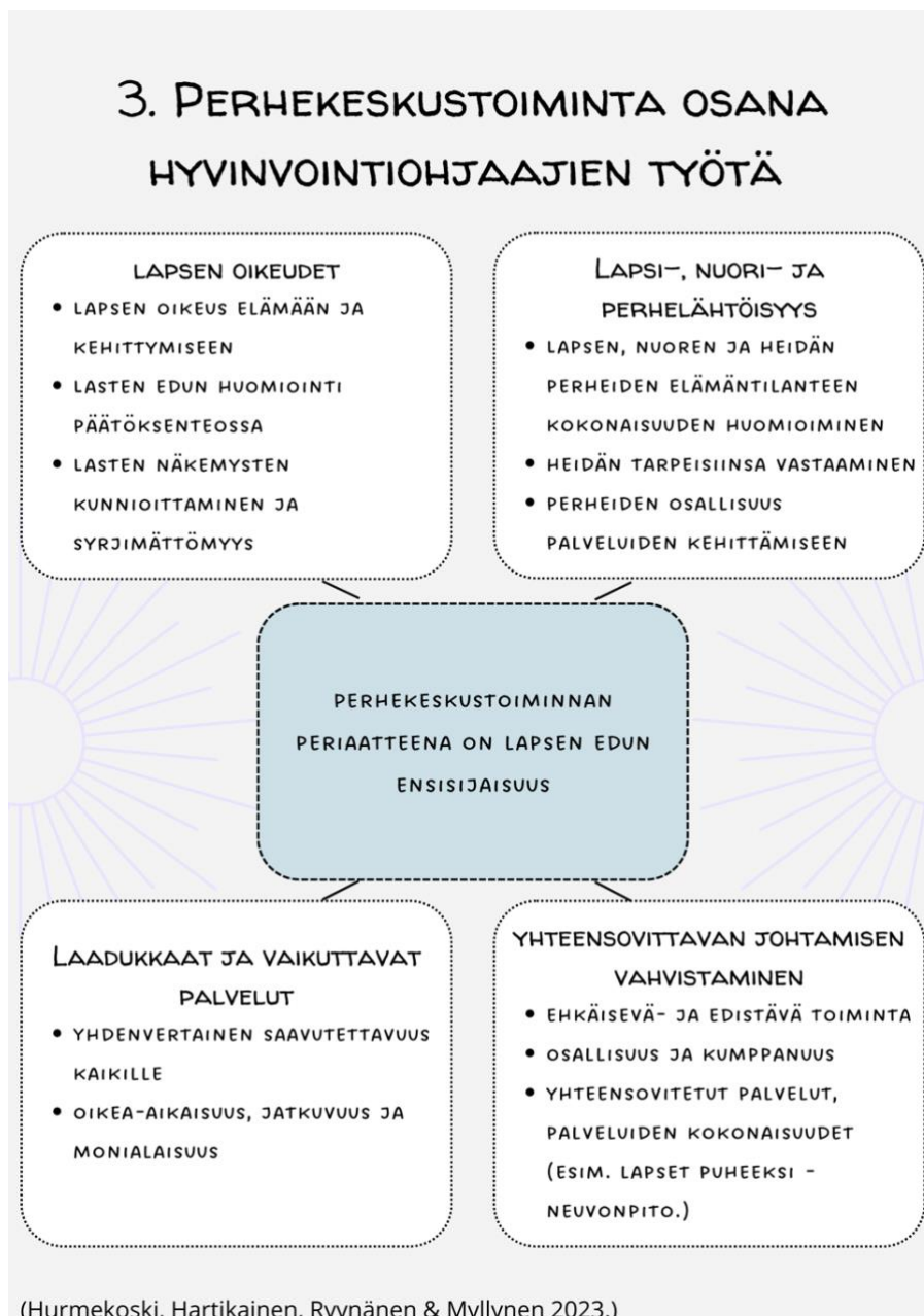
Kuva 2. Oppaan sivu perhekeskustoiminnasta osana hyvinvointiohjaajien työtä.

Koin erittäin tärkeäksi opinnäytetyön prosessissa mukana olleiden hyvinvointiohjaajien ajatukset ja näkemykset työstään. Halusin hyödyntää oppaan viimeisessä luvussa työpajojen keskustelussa esiin nousseita ajatuksia, joita mukana olleet hyvinvointiohjaajat kertoivat. Viimeinen luku sisältää yksittäisiä kommentteja, jotka hyvinvointiohjaajat kokivat merkittäviksi omassa työssään. Luvun kommenttien käyttöön on kysytty ja saatu lupa. Viimeinen sivu ennen lähdeluetteloä sisältää lyhyen yhteenvedon, johon olen kirjoittanut omia huomioitani työstä yhdistäen siihen teoriasta saatua tietoa, sekä tietoa hyvinvointiohjaajien työtä tekeviltä ammattilaisilta.