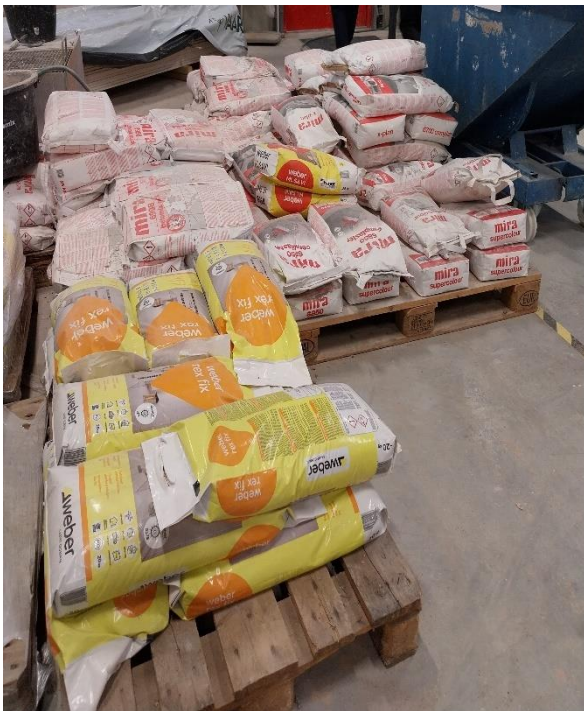
Kuva 12 Jauhemaiset kemikaalit