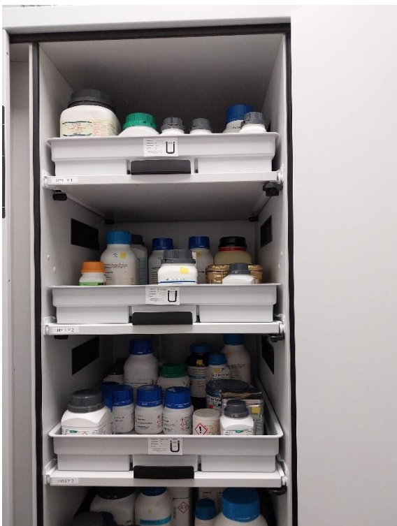
Kuva 8 Kemikaalit jaoteltu vuotokaukoyhlyissä