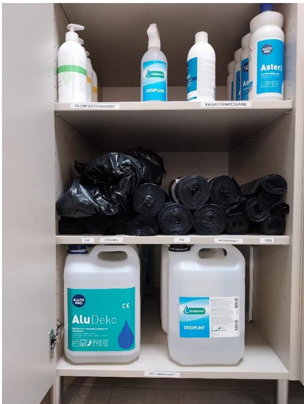
Kuva 5 Astianpesuaineet