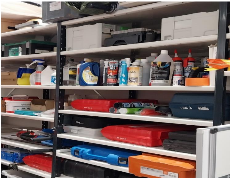
Kuva 3 Kemikaalit hyllyssä yhteiskäyttötilassa

Kemikaalien turvallinen säilytys kiinteistöpalveluiden yhteiskäyttötiloissa edellyttää huolellista suunnittelua, säännöllistä tarkastusta ja asianmukaista koulutusta. Noudattamalla lakeja ja ohjeistuksia sekä pitämällä kemikaaleihin liittyvän tiedon ajantasaisena varmistetaan, että kiinteistöhuolto toimii turvallisesti ja ympäristöystävällisesti.