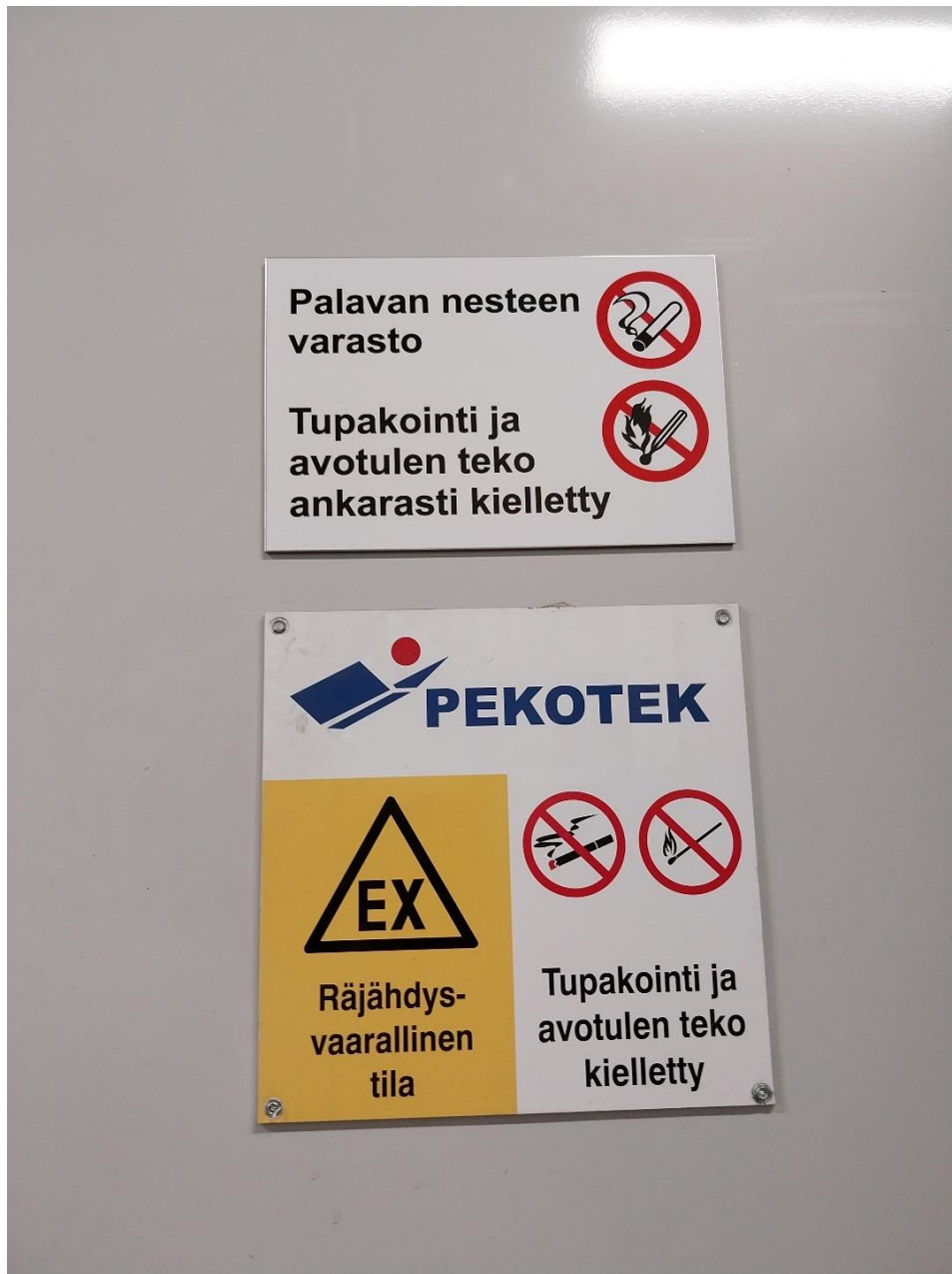
Kuva 14 ATEX-tilan merkinnät