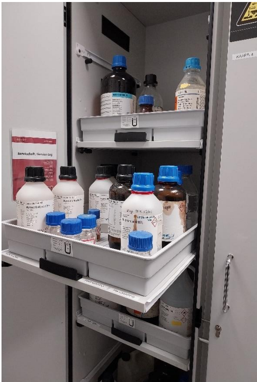
Kuva 9 Kemikaalit vuotokaukalohyllissä