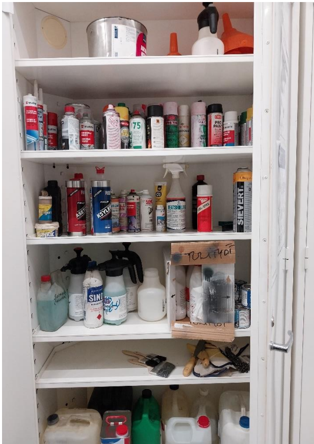
Kuva 2 Metallialan kemikaalit kaapissa

Noudattamalla voimassa olevia lakeja ja ohjeistuksia, kuten kemikaalilakia, työturvallisuuslakia sekä EU:n CLP- ja REACH-asetuksia, metallialan koulustoitto pystyy täyttämään sekä turvallisuus- että ympäristövaatimukset. Kun turvallisuustoimenpiteet yhdistetään laadukkaaseen koulutukseen ja säännöllisiin tarkastuksiin, on työympäristö sekä opiskelijoille että henkilökunnalle mahdollisimman terveellinen ja turvallinen.