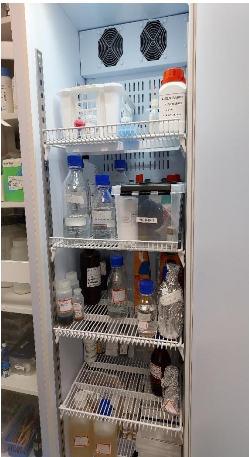
Kuva 10 Kemikaalit jääkaapissa