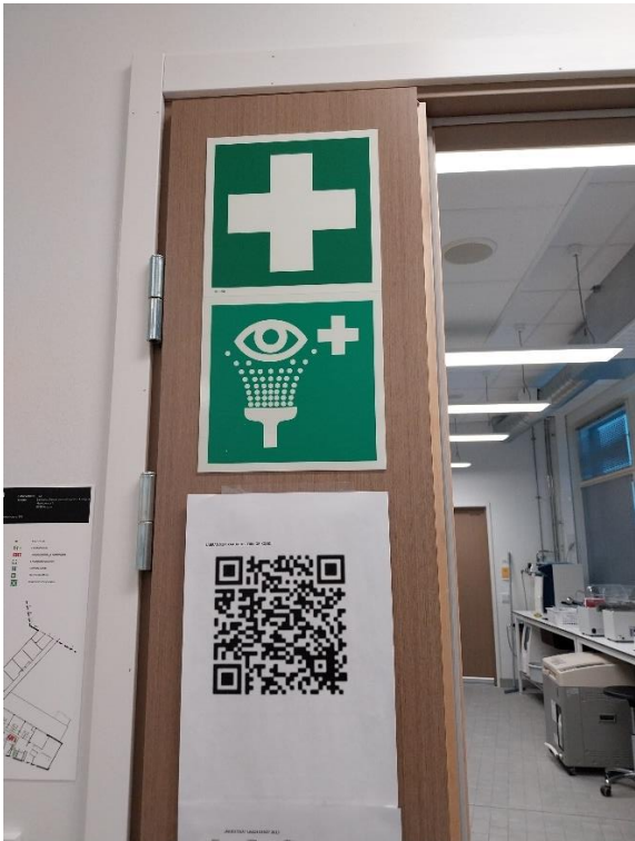
Kuva 7 Silmähuuhtelu ja ensiapupisteen merkinnät