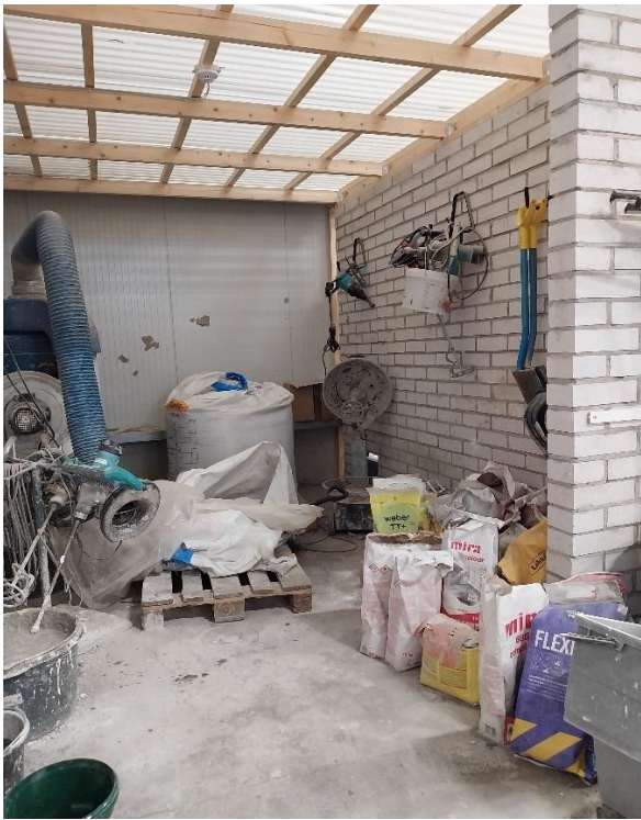
Kuva 11 Sekoitustila tehokkaalla imurilla