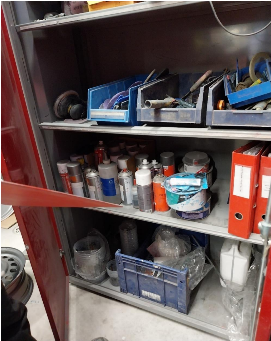
Kuva 15 Käyttöturvallisuustiedotteet kaapissa