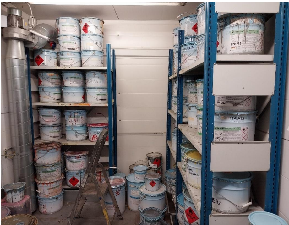
Kuva 13 Maalivarasto

Paloturvallisuus: Rakenteiden on kestettävä tulipaloa, ja varastossa on oltava alkusammutuskalusto (esim. jauhe- tai vaahtosammuttimet).