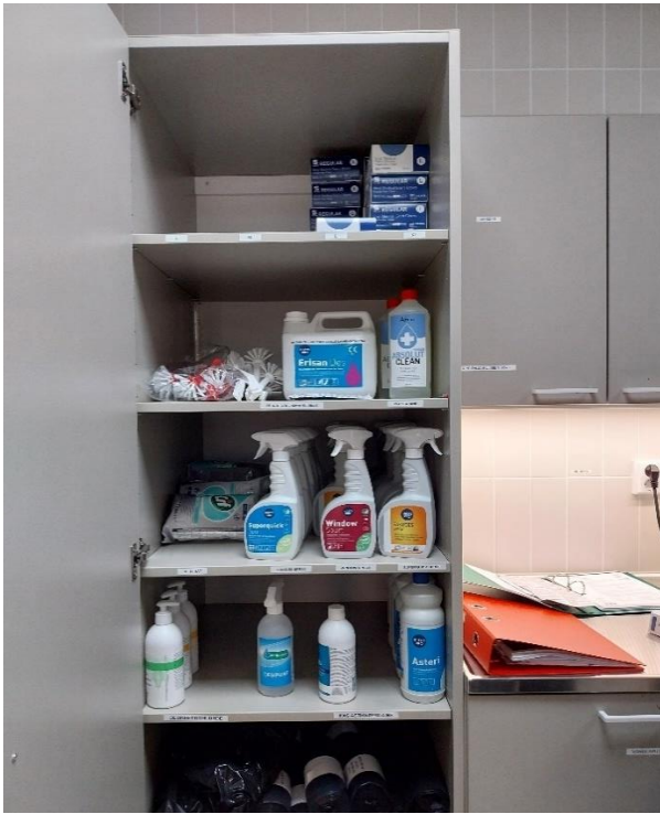
Kuva 4 Siivousvälineet ja pesuaineet