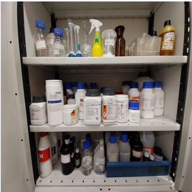
Kuva 17 Kemikaalit eritelty hyllyittäin