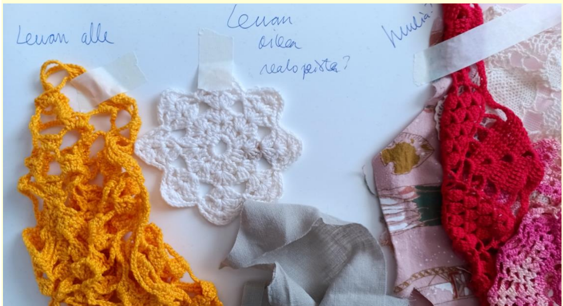
Kuva 3. Materiaalilajittelua ja määrittelyä teokseen.

Keskeinen osa työskentelyämme roskataiteilijoina on materiaalien lajittelu ja niiden potentiaalın kartoittaminen. Toisin kuin perinteisessä taiteellisessa suunnittelussa, jossa materiaali valitaan ennalta määritellyn vision mukaisesti, roskan parissa työskennellessä lopputulos muotoutuu pitkälti käytettävissä olevien materiaalien ehdoilla. Esimerkiksi Roskapressa-teoksessa tulevaisuuden presidentin muotokuvan kasvojen pääväri määräytyi sen perusteella, mitä saaduissa materiaaleissa oli eniten – ilman, että mitään värjättiin tai valittiin etukäteen "sopivaksi".