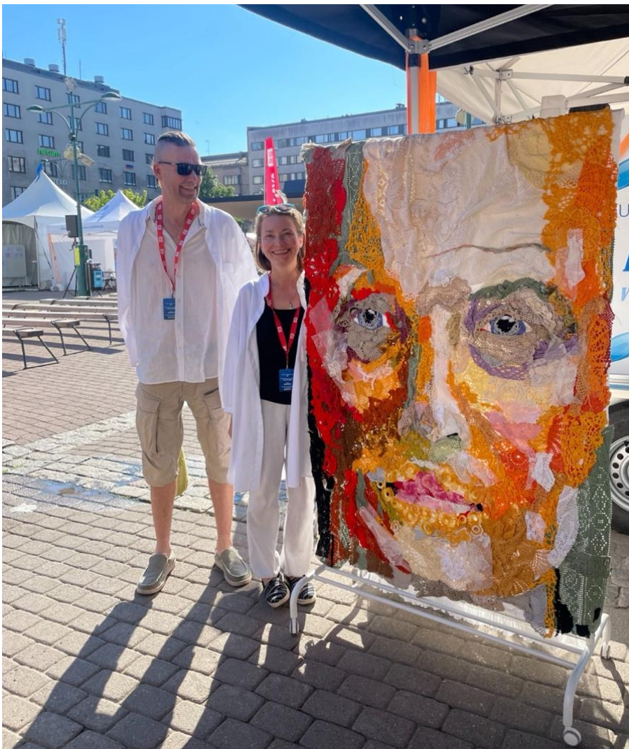
Kuva 2. Juuri valmistunut Roskapressa-teos ja sen tekijät Porissa 27.6.2024.

Teos koostuu hylätyistä pitsiliinoista ja valoverhoista. Emme päättäneet materiaaleja itse, vaan otimme vastaan tekstiilinkierrätyskeskus Nextiili ry:ltä sellaista tekstiiliä, jota sinne oli kertynyt käyttö- ja jatkojalostuskelvottomana. Jättemateriaalin käyttö konkretisoi upcyclingin periaatetta: arvottomana pidetty saa uuden elämän. Tekstiilijätteen hyödyntäminen liittyi suoraan Second Hand Tampere -yhdistyksen keskusteluteemaan (liite 2), jossa käsiteltiin kiertotaloutta erityisesti tekstiiliteollisuuden näkökulmasta. Tekstiiliteollisuus on yksi maailman suurimmista ympäristökuormittajista, ja sen kierrätysaste on yhä matala (VTT n.d.). Lavakeskustelun aikana Roskapressa toi näkyväksi tätä ongelmaa ja samalla demonstroi, miten hylättyä materiaalia voi hyödyntää.