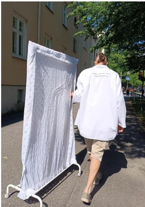
Kuva 12. Roskapressan kuljetus läpi Porin kaupungin.

Roskapressa ei ole pelkkää kierrätystaidetta, sillä siinä materiaalit eivät jää passiiviseksi, vaan ne työstetään uudelleen. Toisaalta, jos upcyclingin ydin on arvon nostaminen, voidaan kysyä: nouseeko Roskapressan materiaalien arvo