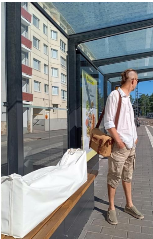
Kuva 4. Roskapressa kantokassissaan.

Vaikka nämä ratkaisut eivät suoraan lisää materiaalien esteettistä arvoa, ne ovat olennainen osa upcycling-ajattelua. Kyse ei ole pelkästään materiaalien uudelleenkäytöstä, vaan myös teoksen elinkaaren ja toimintatapojen tarkastelusta kestävyiden näkökulmasta. Kokare, Oliveira ja Godina (2023, 537–538) toteavatkin, että mikäli prosessia ei tarkastella kokonaisvaltaisesti, yksittäiset kestävyystekijät voivat antaa harhaanjohtavan kuvan sen ympäristökestävyydestä. Pelkkä materiaalin uudelleenkäyttö ei vielä tee taideteoksestakaan upcyclingia, vaan keskeistä on teoksen koko elinkaari, tuotantoprosessin valinnat ja niiden ympäristövaikutukset.