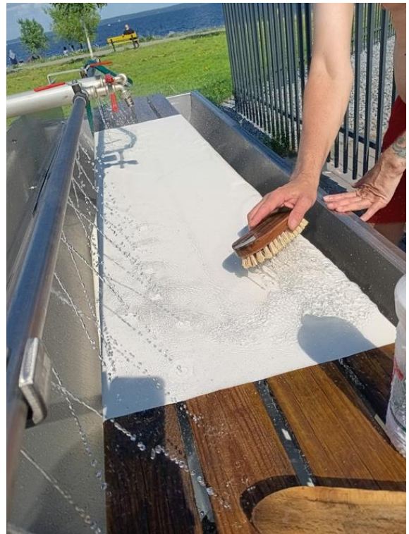
Kuva 11. Rikkinäisen rullaverhon pesu Roskapressan kantokassin materiaaliksi. Upcyclausta lopulta?

Ehkä suomenkieliselle termille ei ole edes tarvetta, mutta käsitteen sisältö kaipaa selkeyttämistä. Meillä upcycling näkyy kokonaisuudessaan osana luovaa prosessia ja roskamateriaalien arvostusta. Ehkä se uusiojalostus voisi olla osuva termi, mutta sen vakiinnuttaminen vaatisi kyllä laajempaa keskustelua ja yleisempää hyväksyntää.