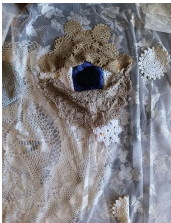
Kuva 10. Ankeahko alku materiaalin rajallisuuden edessä.

Meille roskamateriaali on tärkeä katalyytti taiteen teossa. Roskan rajallisuus haastaa mielikuvituksen ja luovuuden paremmin kuin rajattomat materiaalivarannot ja mahdollisuudet.