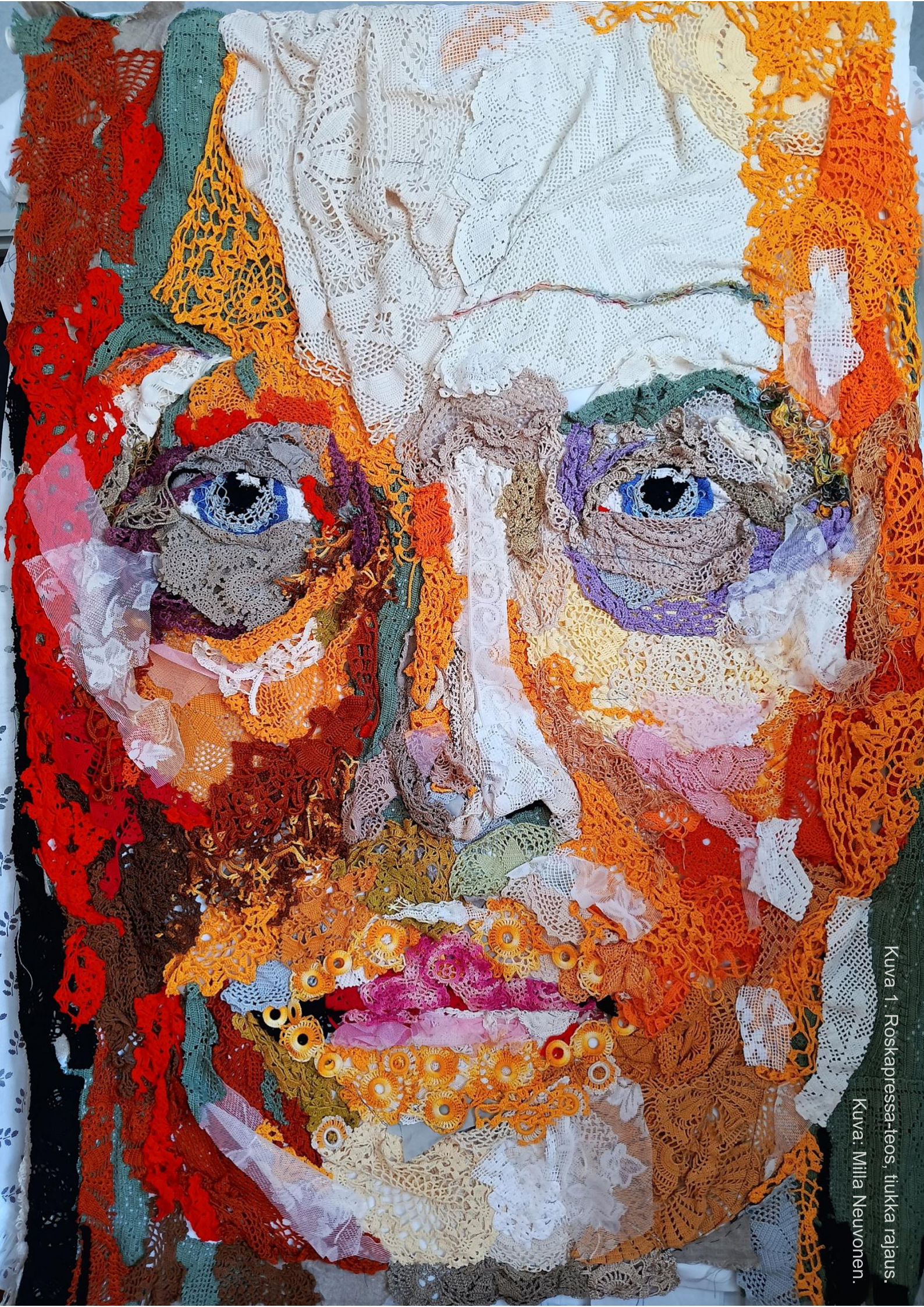
Kuva 1. Roskappressa-teos, tiukka rajaus.