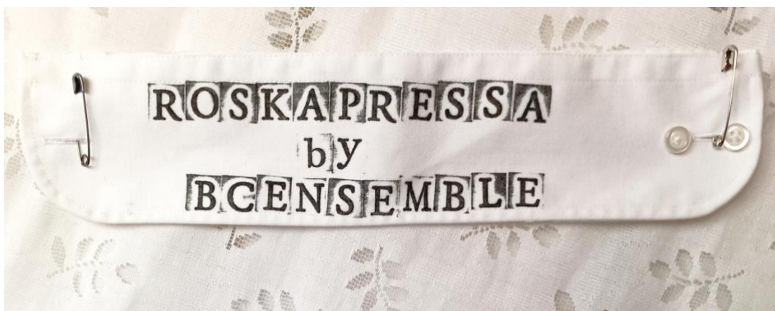
Kuva 13. Roskapressa jatkaa kiertuettaan.

Kaikilla näillä aloilla materiaalin uudelleenmuokkaus ja luova ajattelu ovat keskeisessä roolissa – ja mistäpä löytyisi parempia monialaisia käsillä ajattelijoita kuin visuaalisen alan taiteilijoista, erityisesti roskataiteilijoista?