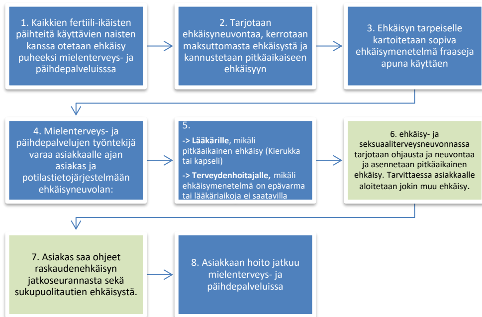
Kuva 3 Opinnäytetyön tuloksena syntynyt toimintamalli

Ennen toimintamallin käyttöönottoa mielensterveys- ja päihdepalvelujen työntekijät tarvitsevat ehkäisyaiheista täydennyskoulutusta sekä ohjauksen ajanvarauksen tekemiseen ehkäisy- ja seksuaaliterveysneuvonnan ajanvarauskirjalle. Työnkuvan muuttuessa työnantajan on turvattava henkilöstön osaaminen ja työnantaja on velvollinen tarjoamaan henkilöstölle täydennyskoulutusta aiheesta. (Laki sosiaali- ja terveydenhuollon järjestämisestä 612/2021, Luku 2 §8) Laki terveydenhuollon ammattihenkilöistä 18. pykälässä kuvataan myös työntekijän velvollisuus hankkia täydennyskoulutusta (Laki terveydenhuollon ammattihenkilöistä 559/1994 §18). Haastattelun ja Delfoi-kierroksen tulosten mukaan henkilökunnan täydennyskoulutus onnistuisi Länsi-Uudenmaan hyvinvointialueen sisäisenä koulutuksena, jonka ehkäisy- ja seksuaaliterveysneuvonnan lääkäri tai terveydenhoitaja pitäisi. Etäyhteydellä järjestettävän sisäisen koulutuksen suurimpia etuja ovat riippumattomuus ajasta ja paikasta, mikä mahdollistaa työn ohessa järjestettävän täydennyskoulutuksen. Etäyhteydellä järjestettävä koulutus on myös kustannustehokas. (Hirvimäki ym., 2021, ss. 6–9)