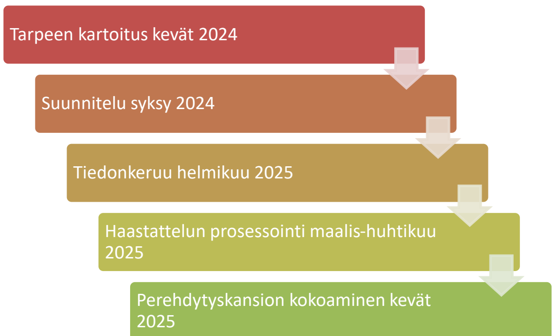
Kuvio 3. Opinnäytetyön prosessi

Halusin toteuttaa jotain tarpeellista perhekodin arkeen. Akkian nuorisokodeilla on perehdytyskansiot mutta ne eivät palvele perhekodin perehdyttämisessä kuin Akkian esittelyn osalta. Perhekoti tarvitsee oman kansion. Lähdin siis toteuttamaan työtäni todelliseen tarpeeseen. Olin päättänyt, että toteutan opinnäytetyöni toiminnallisesti tekemällä.