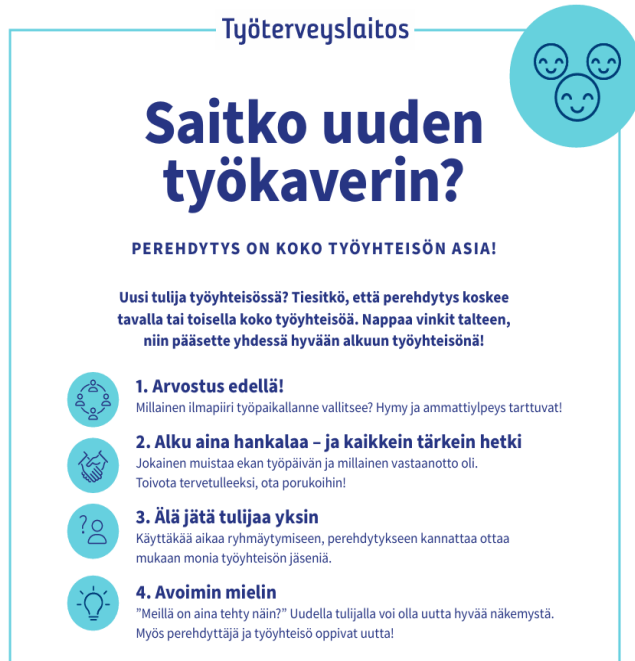
Kuvio 2. Saitko uuden työkaverin (Työterveyslaitos 2025)

Työterveyslaitos on julkaissut huoneen taulun, saitko uuden työkaverin. Siinä muistutetaan hyvin myös työntekijöitä perehdytyksessä. Miten kerron työpaikan ilmapiiristä uudelle, jotta hänen on turvallinen olla. Hymy ja ammattitilpeys ovat tärkeitä ja jäävät kuulijan mieleen. Jokaisen pitää muistaa, että alku on hankalaa. Muistellaan omaa eka työpäivää ja siihen liittyviä asioita. Tärkeää on, että et jätä yksin vaan otat porukkaan. Avoimin mielin uuden edessä, uudella tulijalla voi olla paljon tavaraa tuotavaksi uuteen työpaikkaan, unohda fraasi meillä on aina tehty näin. (Työterveyslaitos 2025.)