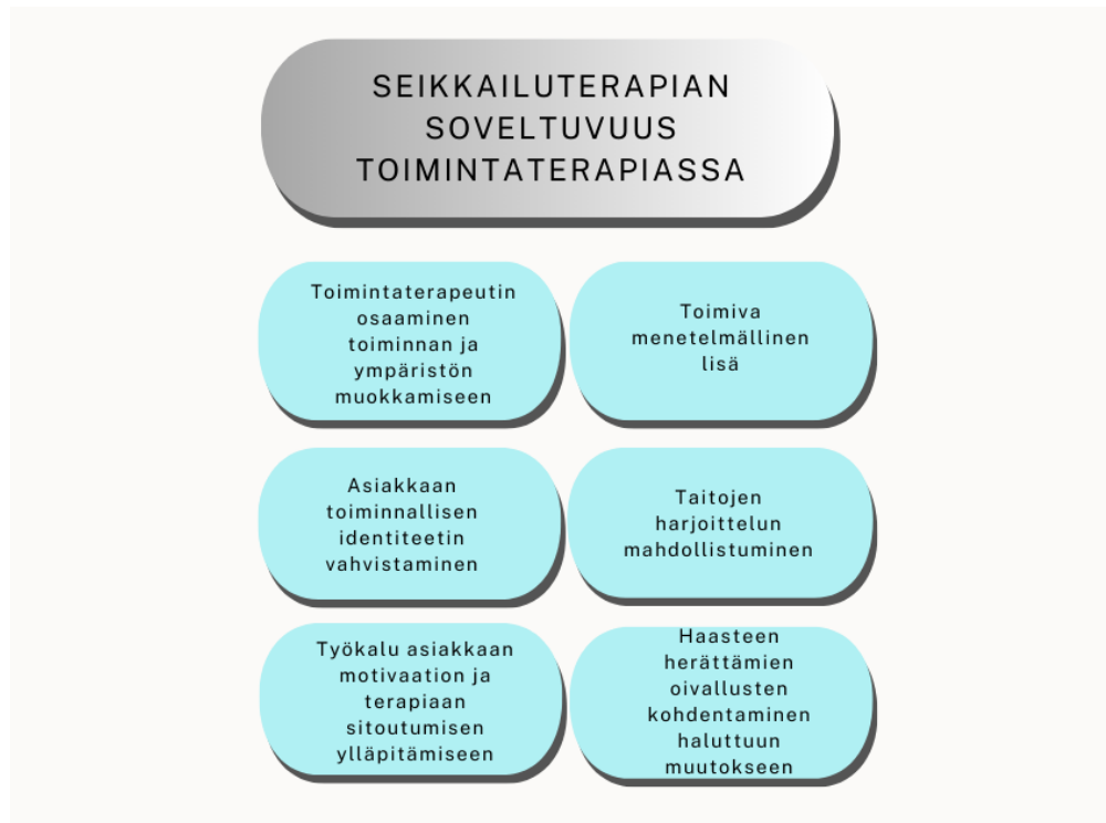
Kuvio 3: Seikkailuterapiian hyödyntäminen toimintaterapiassa