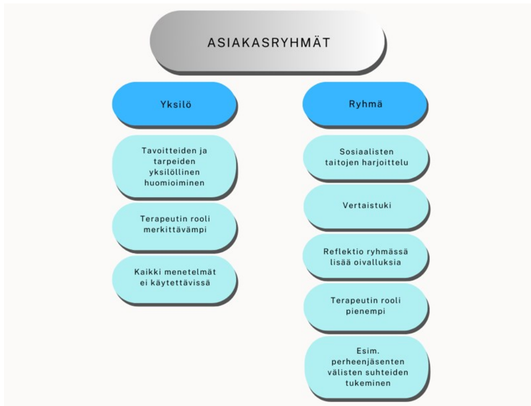
Kuvio 1. Asiakasryhmät