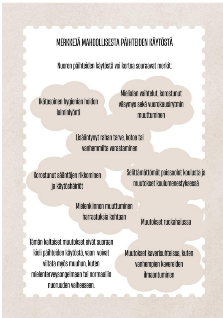
Kuva 3. Oppaan sivu 14 – Merkkejä mahdollisesta päihteiden käytöstä (Mielenterveystalo, n.d.)