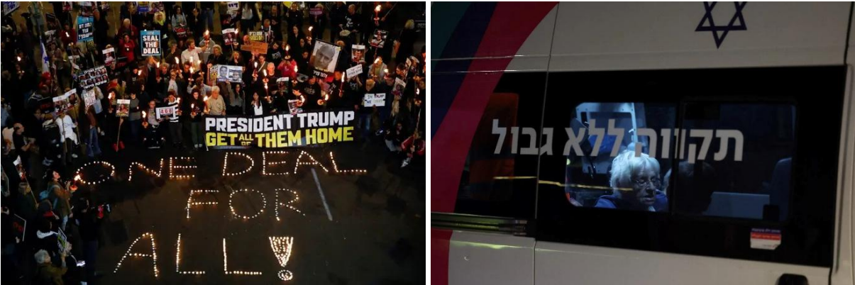
Kuva 5 (HS). Ihmiset kokoontuivat kynttilämielenosoitukseen panttivankien puolesta torstaina Tel Avivissa (Shir Torem, Reuters 2025)