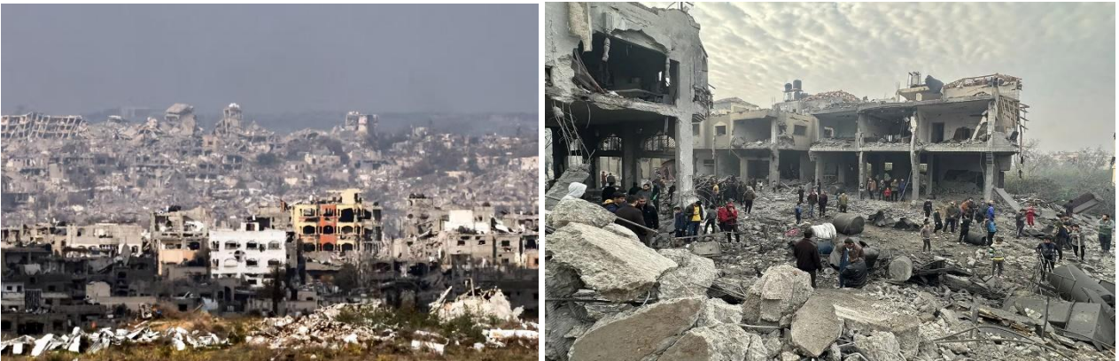
Kuva 7. Tuhoutuneita rakennuksia Pohjois-Gazassa, kuvattuna Israelin puolelta rajaa torstaina