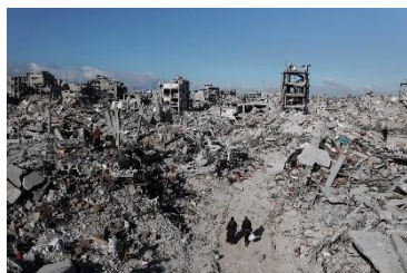
New York Times