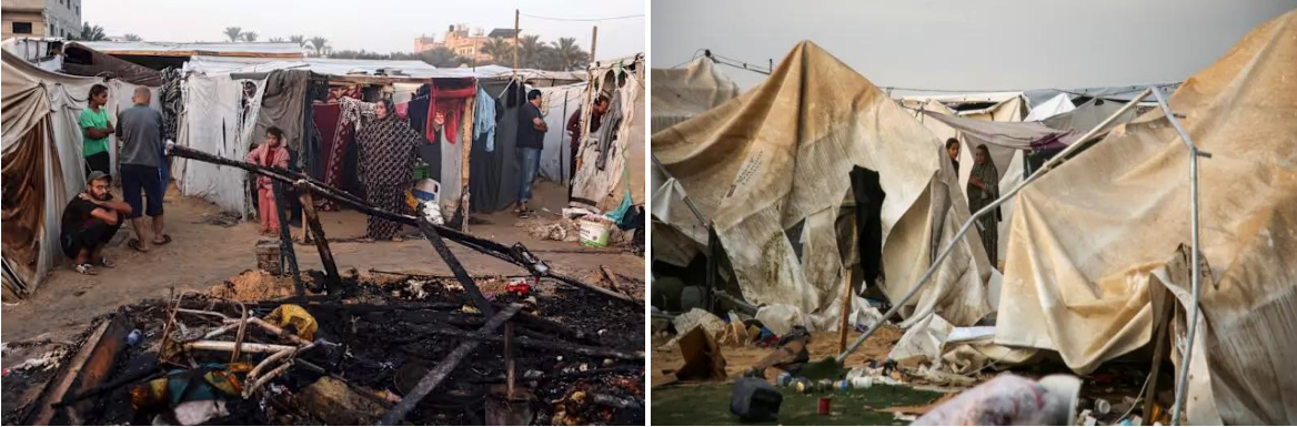
Kuva 1 (Yle). Siviilit katselivat Israelin ilmaiskun jälkiä Deir al-Balahissa Gazan kaistalla maanantaina (Eyad Baba, AFP 2024)

Myös näiden kuvien kuvatekstit on suomennettu lukukokemuksen helpottamiseksi. Kuvatekstit vastaavat muuten alkuperäisiä, eivätkä ne ole minun tekemiäni.