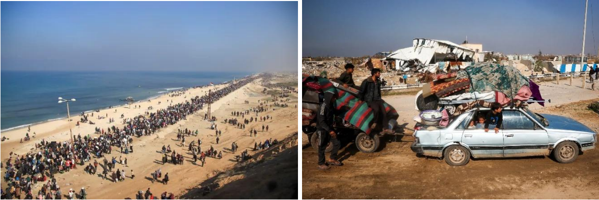
Kuva 9 (HS). Palestiinalaisia palaamassa Gazan pohjoisosiin maanantaina