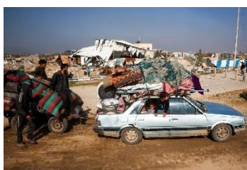
New York Times