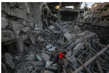
New York Times

Kuvissa korostuu laajakuvakulma ylhäältä alaspäin. Niissä ihmiset ovat pienessä koossa, minkä takia yksityiskohdat eivät erotu. Sen sijaan Israelin iskujen tuhot ja niiden seuraukset erottuvat selkeästi. Myös kuvan suunta ylhäältä alaspäin kuvailee voimasuhteita Israelin armeijan ja Gazan siviilien välillä, sillä ylhäältä alaspäin kuvaaminen on klassinen tapa kuvailla voimasuhteita. Näissä esimerkkikuvissa Israel esitellään ylivertaisenä, kun taas Gazan siviilit näyttävät heikkoina ja altavastajina.