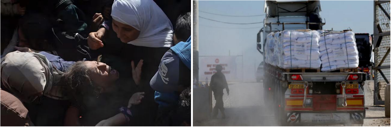
Kuva 5. Epätoivoiset ihmiset jonottivat leipää Gazan kaistalla lokakuun lopussa