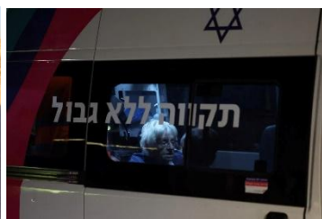
New York Times