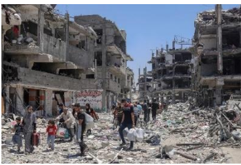
New York Times

Kuvissa korostuu mielestäni ihmiset, jotka ovat osana massaa. Niissä ei esiinny yksityiskohtia, vaan ihmiset ovat käytännössä lähes tunnistamattomia. Vain ensimmäisessä kuvassa näkyy henkilöitä, jotka voisi tunnistaa kuvasta.