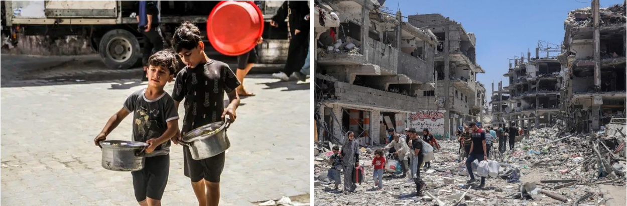
Kuva 1 (HS). Kaksi poikaa kantoi saamaansa ruoka-apua Gazan kaupungissa lokakuussa