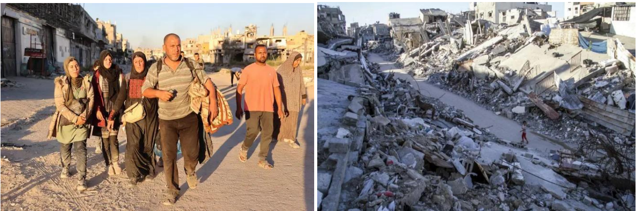
Kuva 3 (Yle). Kuvituskuva. Israelin armeijan tuhoamia rakennuksia kuvattuna 12. lokakuuta Gazan kaupungissa Gazan kaistan pohjoisosissa