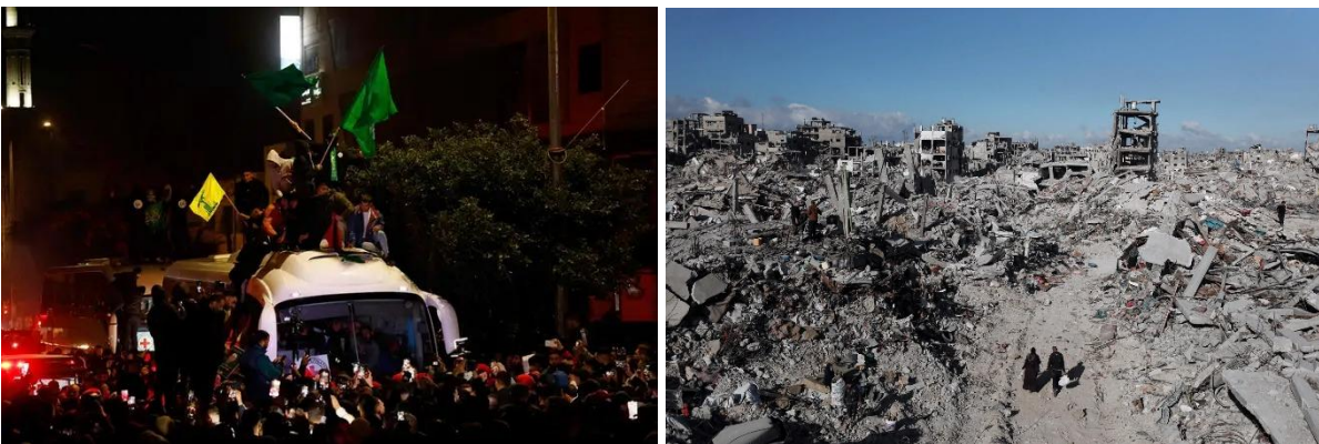
Kuva 7 (HS). Israel vapautti 90 palestiinalaisvankia tuntien viivästyksen jälkeen