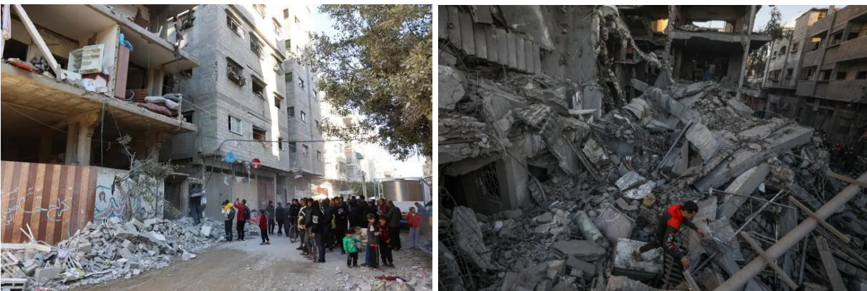
Kuva 3 (HS). Israelin iskut Gazaan surmasivat sunnuntaina ainakin 40 ihmistä