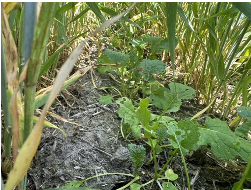
Figur 1. Höstrybs etablerat i vårkorn i reläodlingssystem.