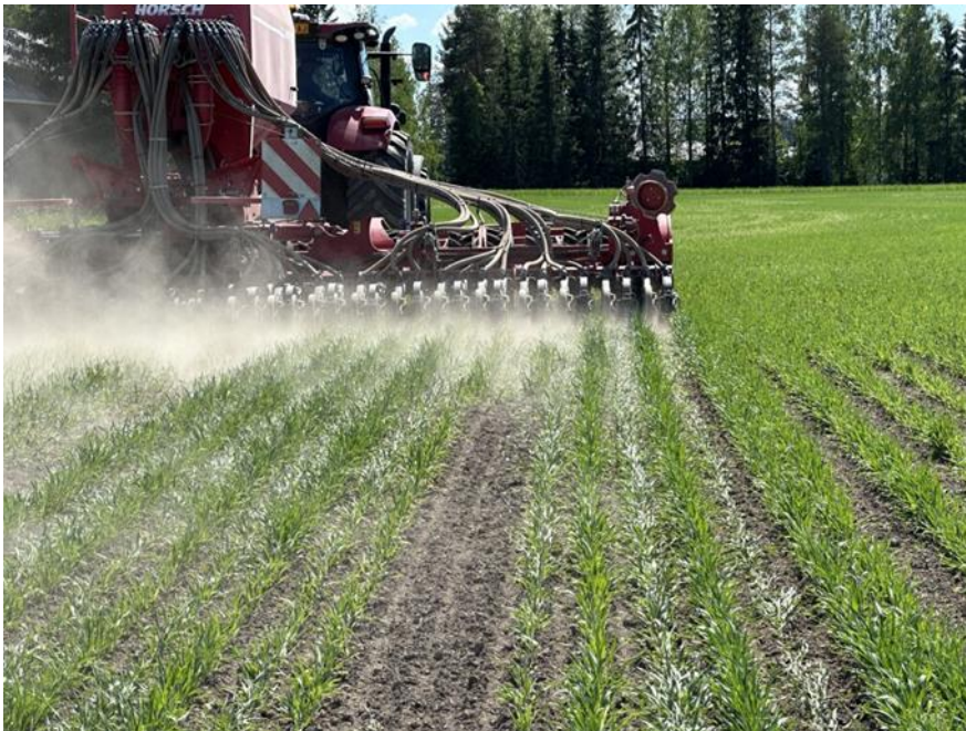
Figur 4. Insådd av höstrybs i vårkorn.

Etablering efter skyddsgrödans sådd underlättar ogräsbekämpningen men kräver en extra körning i det växande kornbeståndet. I Somero 2024 etablerades höstrybs cirka tre och en halv vecka efter skyddsgrödans sådd. Insådden av höstrybsen utfördes med en vanlig kombisåmaskin av märket Horsch (figur 4). Med hjälp av automatstyrning kunde höstrybsen sås in mellan kornraderna. (Liespuu, 2024a).