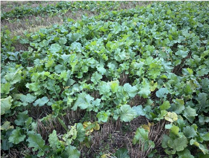
Figur 5. Höstrybsbestånd etablerat i ett reläodlingssystem inför övervintring

På våren gör odlaren beslutet om höstoljeväxtbeståndet har klarat vintern eller ifall beståndet skall sås om med en annan gröda. Höstoljeväxtbeståndet kan se eländigt ut på våren efter att snön har smultit bort då bladen ofta är helt förstörda, ändå är inte hoppet ute så länge tillväxtpunkten är vid liv och rötterna är i gott skick (Vyr, 2012). Höstoljeväxten har dock en god förmåga att kompensera för ett lågt plantantal på våren och ett övervintrande plantantal på 12–13 st/m 2 som är jämnt fördelade kan ge full skörd. Ifall plantantalet är lägre kommer skörden att reduceras och vid enbart 5–6 övervintrande plantor per kvadratmeter borde beståndet brytas och sås om. (Ryegård, 2013).