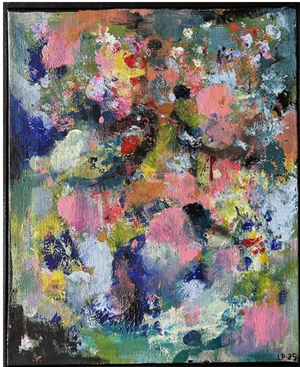
Kuva 3. Sivutuote, (2025), 49 cm x 41 cm, akryylimaalaus.