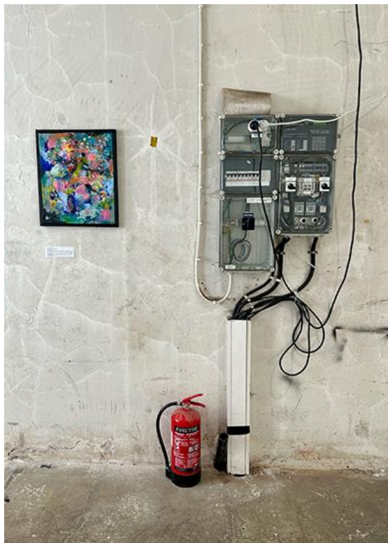
Kuva 4. Teoksen paikka sähkökaapin vieressä.

Kukaan näyttelyryhmäläisistä ei kommentoinut töitäni mitenkään, mutta mielenkiintoista oli, että Sivutuotteelle ehdotettiin paikkaa sähkökaapin vierestä, koska se “sopii siihen”. Olin itse samaa mieltä. Hieman rujo työni puhui samaa kieltä sähkökaapin kanssa. Huomasin myös, ettei kukaan ryhmästämmme ollut ottanut Sivutuotteesta kuvaa, vaikka näyttelykuvia jaettiin WhatsApp-ryhmässämme kymmeniä, ellei satoja. En tiedä, voiko siitä vetää mitään johtopäätöksiä, mutta mielessäni kävi, ettei sitä pidetty näyttelyryhmän keskuudessa kovin kiinnostavana tai taitavana teoksena. Jään odottamaan kantautuuko töistäni minkäänlaista palautetta näyttelyn aikana. (Päiväkirja 26.3.2025)