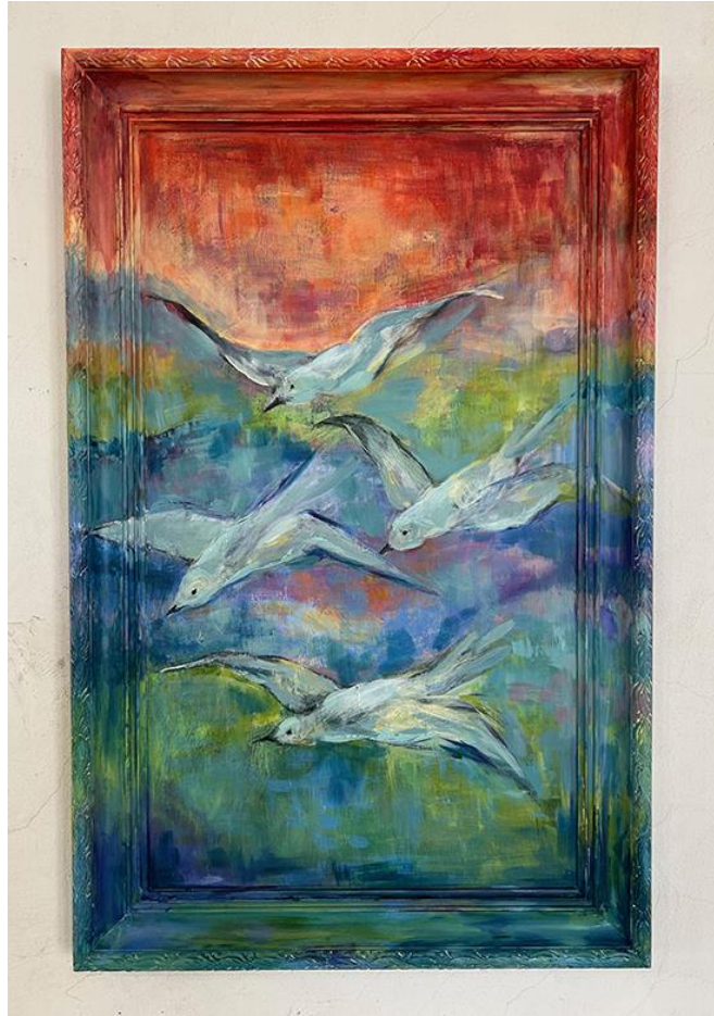
Kuva 2. Rajaloukkauksia (2025), 100 cm x 64 cm, akryylimaalaus.