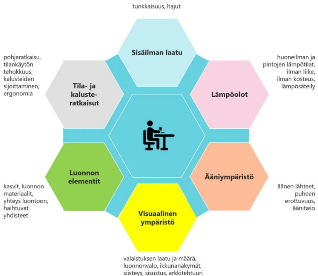
Kuva 3: Keskeiset hyvinvointiin ja työn sujuvuuteen vaikuttavat sisäympäristötekijät toimistossa. (Työterveyslaitos 2025).

Alla olevassa kuvassa (kuva 3) on hyödyllisiä vinkkejä toimistotilan luomiselle työhyvinvoinnin näkökulmasta. Sisäilman laatu, lämpötila ja ääniympäristö tuovat terveydellisiä аспекteja työhyvinvointiin, kun taas visuaalinen ilme, tila- ja kalusteratkaisut sekä luonnon elementit kohentavat mieltä, työergonomiaa ja selkeä järjestys parantaa keskittymiskykyä ja säästää aikaa työssä.