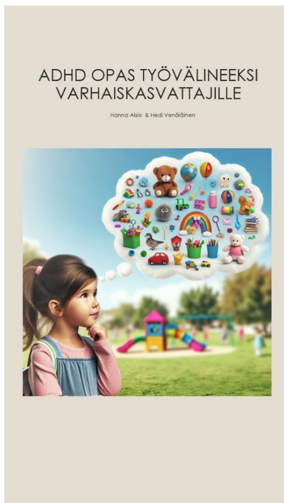
Kuva 1. Oppaan kansilehti.

Opasta tehdessämme hyödynsimme opinnäytetyöhöme käytettyä tietoperustaa sekä tutustuimme aiheeseen liittyviin nettisivuihin ja hyödynsimme Nepsy varhaiskasvatuksessa koulutuksessa saamaamme tietoa. Koulutuksessa esille nousi neurovahvistava lähestymistapa, jonka merkitystä halusimme tuoda oppaassa näkyville (kuva 2). Mielestämme neurovahvistava lähestymistapa on toimiva lähestymistapa huomioida ja kohdata ADHD-piirteisiä lapsia. Käsitteimme oppaassa varhaiskasvatuksen perusteissa mainittuja asioita lapsen tukeen liittyen, ja sen lisäksi opas sisälsi tietoa ja esimerkkejä ADHD-piirteiselle lapselle kohdennutusta tuesta.