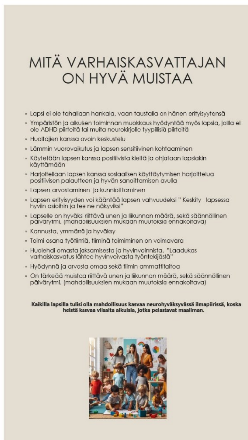
Kuva 4. Oppaan sivu mitä varhaiskasvattajan on hyvä muistaa.

Teoriatiedon tukiessa omaa jo olemassa olevaa tietoa pystyimme opasta tehdessämme hyödyntämään myös omia ammatillisia kokemuksia, etenkin esimerkkien kautta kertomisessa. Laadimme oppaan Powerpointilla. Opas on laadittu muotoon, josta se on helposti tulostettavissa.