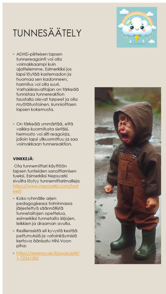
Kuva 3. Oppaan sivu tunnesäätely.

Oppaan yhtenä aiheena oli, kuinka varhaiskasvattajat voivat tuottaa lapselle onnistumisen kokemuksia. Kirjasimme oppaaseen selkeitä ja käytännönläheisiä vinkkejä, miten lapsen onnistumisen kokemuksia voidaan tukea ja lisätä.