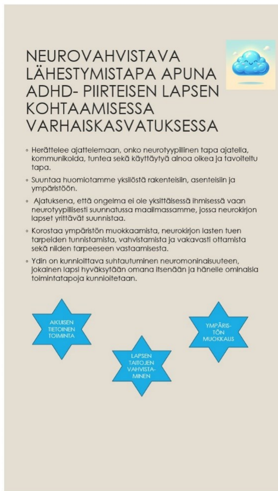
Kuva 2. Oppaan sivu neurovahvistava lähestymistapa tukena varhaiskasvatuksessa.

Halusimme tuoda oppaassa esille tietoutta tunnesäätelystä ja etenkin siitä, että ADHD- piirteisen lapsen tunnereaktiot voivat olla vahvempia kuin varhaiskasvattajat osaavat ajatella. Avasimme asiaa muun muassa esimerkin kautta: ”Jos lapsi löytää kastemadon ja huomaa sen kadonneen, harmitus voi olla suuri” (kuva 3). Varhaiskasvattajan on tärkeää tunnistaa tunnereaktion taustalla olevat tarpeet ja olla myötätuntoinen, kunnioittaen lapsen kokemusta. Tunnesäätelyyn liittyen oppaaseen lisättiin linkki, mistä voi tulostaa tunnemittarin lapsen kanssa käytettäväksi. Tunteidensäätelyyn liittyen nostimme oppaassa esiin aggressiivisen lapsen kohtaamisen varhaiskasvatuksessa. Toimimme siitä esille tärkeiksi havaitsemiamme näkökulmia ja mitä varhaiskasvattajien kannattaa ottaa huomioon kohdatessaan aggressiivinen lapsi varhaiskasvatuksessa tapahtuvissa tilanteissa.